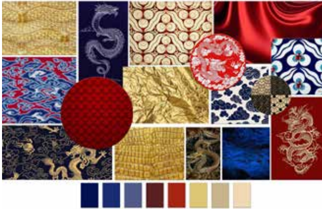
Görsel 4. Hikâye Panosu ve Renk Panosu, 2022, Kolaj Tekniği, 35x50cm.

Tasarım ortaya çıkarılırken esinlenen görsel unsurlar ve semboller bir araya getirilerek, estetik ve modern bir hikâye panosu oluşturulmuştur. Hikâye panosu, tasarım hakkında ön bilgiler vermekte olup tasarıma ait mesajlar içermektedir.