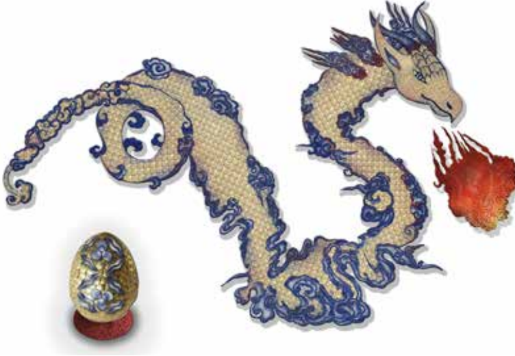
Görsel 5. Tasarımın Renklendirilmiş Hali, 2022, Dijital Tasarım, 35x50 cm.

Eskiz çizimi hazırlanan ve hikâye panosu yapılan tasarımın, altın rengine boyanacak olan yerleri toz altının, Arap zıncığı ile ezilmesi ve su ile karıştırılması sonucunda fırça yardımı ile elde boyanmıştır. Tarama sonucu dijital ortama aktarılan eskiz “Adobe Photoshop” programı ile renklendirilmiştir.