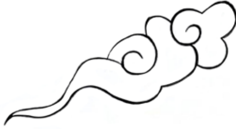
Görsel 1. Yğma Bulut, 2022, Dijital Çizim, 15x15 cm.

Bulut motifinin kökeni ejderha ile bağlantılıdır. Çin ve Türk mitolojisinde güç, koruyuculuk, su ve bolluk gibi unsurların temsilcisi olan ejder motifi iki farklı kültürü ortak paydada birleştirmektedir. Efsanevi bir yaratık olan ejderlerin ilkbaharda yer altından gökyüzüne kadar eriştiği ve bulutların arasında gezdiği rivayet olunmaktadır (Boydak F, 2017:3).