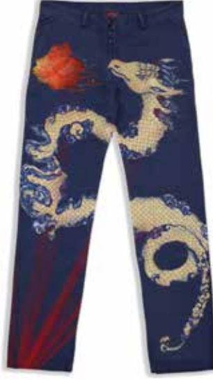
Görsel 8. Kot Pantolon Üzerinde Tasarımın Sunulması, 2023, Dijital Çizim, 35x50 cm.

Japon kültüründe yaygın olan kadın kıyafetlerine benzer tarzda lacivert bir elbise üzerine, “Adobe Photoshop” programı aracılığı ile desen fırçası ile kırmızı renk verilmiştir. Tasarımı yapılan motif, bel kısmından dolanarak vücudu sarıyormuş gibi konumlandırılarak elbise üzerine yerleştirilmiştir (Görsel 7.).