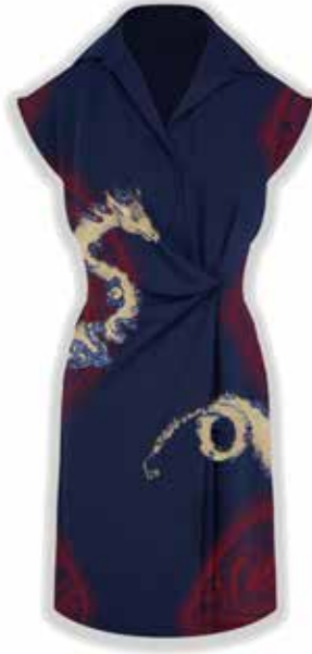
Görsel 7. Elbise Üzerinde Tasarımın Sunulması, 2023, Dijital Çizim, 35x50 cm.

“Adobe Photoshop” aracılığı ile lacivert renkte erkek kimonosunun sırt bölgesine konumlandırılan motif, gölgelendirme işlemi tamamlanarak hazırlanmıştır. Kol ağzlarında ve yaka kısmında bir kalın bir ince olacak şekilde iki adet bant çizilmiştir. Bantlar altın varak ve kırmızı renklerine boyanmıştır (Görsel 6.).