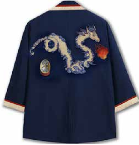
Görsel 6. Erkek Kimonosu Üzerinde Tasarımın Sunulması, 2022, Dijital Çizim, 35x50 cm.

“Adobe Photoshop” aracılığı ile lacivert renkte erkek kimonosunun sırt bölgesine konumlandırılan motif, gölgelendirme işlemi tamamlanarak hazırlanmıştır. Kol ağzlarında ve yaka kısmında bir kalın bir ince olacak şekilde iki adet bant çizilmiştir. Bantlar altın varak ve kırmızı renklerine boyanmıştır (Görsel 6.).