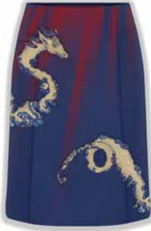
Görsel 9. Düz Dar Etek Üzerinde Tasarımın Sunulması, 2023, Dijital Çizim, 35x50 cm.

Kot pantolon görseli üzerine “Adobe Photoshop” programında ışık fırçası ile efekt uygulanmıştır. Tasarımı yapılan motif, bütün pantolonu kapsayacak şekilde boyutlandırılmıştır ve konumlandırılmıştır (Görsel 8.).