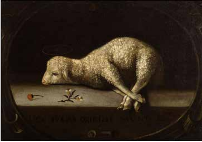
Görsel 2. Josefa de Obidos, Kurbanlık Kuzu/The Sacrificial Lamb , 1670-1684, Tuval Üzerine Yağlı Boya, 55.5 x 78.7 cm.