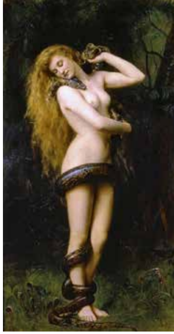
Görsel 1. John Collier, Lilith/Lilith , 1892, Tuval Üzerine Yağlı Boya, 194 X104 cm.