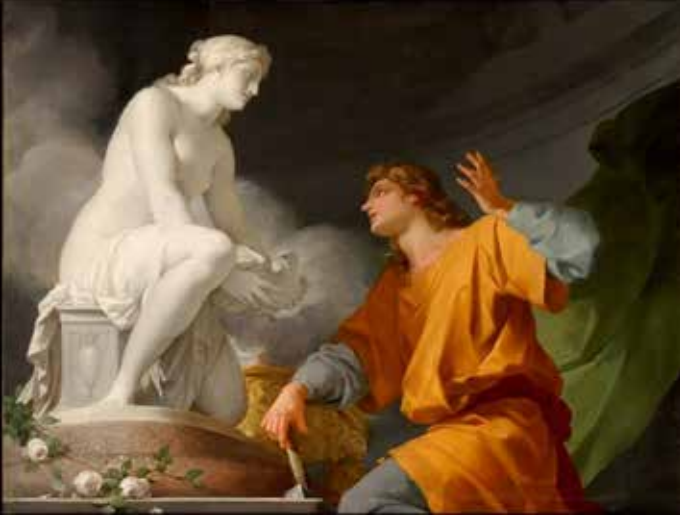
Görsel 3. Jean-Baptiste Regnault, Heykelin Kökeni ya da Yaptığı Heykele Aşık Olan Pygmalion/Pygmalion Praying Venus to Animate His Statue , 1786, Tuval Üzerine Yağlı Boya, 120x 140 cm.

Mitolojik hikayelerde ve dinsel metinlerde benzeri başka öykülere rastlamak, örneklerin sayısını arttırmak mümkündür. Akla gelen bir diğer öykü Âdem ve Hava 'nın yaratılışı ile ilgilidir. Semavi dinlerin hepsinin metinlerinde üzerinde anlaştıkları konuların başında Hava 'nın Âdem'in ilk eşi olmadığı hususudur. Öncesine cennette Adem'e eş olarak Lilith adlı bir kadın Tanrı tarafından yaratılmış; ne var ki, Âdem Lilith 'e kendisinin dengi olmadığını hissettirdiği için ilk eşi tarafından terk edilmiştir. Adem'in Tanrı'dan Lilith 'i geri getirmesini istemesi sonuç vermemiş Lilith 'in bu isteği reddetmesinden ötürü Adem'e her bakımdan tabi olacak eşi yaratmak için ilk erkeğin kaburgası kullanılmıştır. Yukarıda, Femme Fatal başlığı altında değindiğimiz Lilith üç büyük semavi inancın gayrı-resmi anlatılarında sistematik bir biçimde şeytanlaştırılarak da olsa günümüze değin varlığını sürdürmüştür.