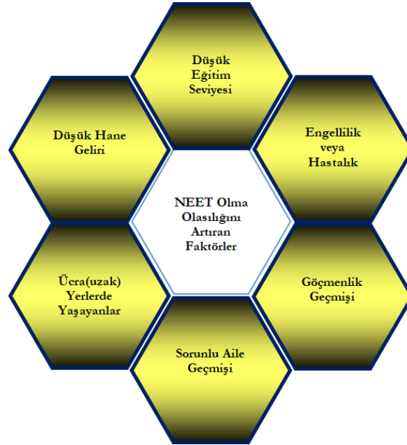
Şekil 1. NEET Olma İhtimalini Artıran Faktörler

NEET olmanın diğer önemli bir nedeni de mesleki eğitim ile işgücü piyasası arasında uyumsuzluğun yaşanmasıdır. Şekil 1'deki NEET olma olasılığını artıran faktörlere yönelik tedbirlerin yeterince alınamaması gençleri olumsuz etkilerken aynı zamanda NEET oranlarının artmasına da neden olmaktadır. Adeta bir bal peteğinin gözenekleri gibi birbirleriyle ilintili olan bu faktörlerin meydana getirdiği olumsuzlukların giderilmesinde yeni politikaların geliştirilmesi NEET grubunda yer alan gençleri çalışma hayatında daha aktif hale getirecek ve istihdamlarına katkı sağlayacaktır. Dolayısıyla bu konuda var olan sorunun çözümü için ilgili tüm aktörlerin yer alacağı ve sorumluluk üstleneceği bir mekanizmaya ihtiyaç duyulmaktadır.