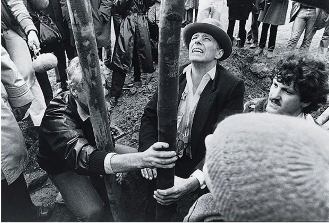
Resim 1. 7000 Oaks (7000 Meşe),1982

sistemi eleştirmekte var olan düzenin tahribatlarını farkındalıkla ele almakta, iş birliği içerisinde çözümler sunmaktadır. Çalışmalar aynı zamanda bir tür direniş eylemidirler. Çağımızın sorunlarından olan çevresel duyarsızlıklara karşı mücadeleci kimliği ile çığır açan Beuys tam da buna işaret etmektedir: doğal kaynaklar yok olmaktadır ama daha yapılacaklar vardır ve bunun için direnç göstermek gerekmektedir.