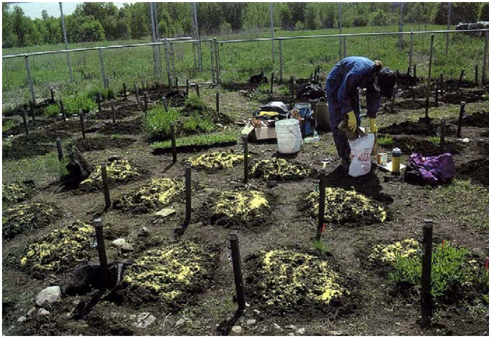
Resim 6. Revival Field, Mel Chin, 1990

Chin kültürün yarattığı tahribatı önleyecek bir yöntemi hayata geçirmiştir. Kapitalist sistemin içeriğine bakmaksızın bireylerin sağlığını önemli ölçüde etkileyecek kimyasalları hayatın her alanına bulaştırdığı gerçeği ile yaşanmaktadır. Burada doğa yararına alınan tüm önlem ve Chin'in gerçekleştirdiği çalışma, doğanın iyileşmesi ve sürdürülebilirlik ilkesiyle hareket ettiği bir tür direnç örneğidir. Chin "Now You See It" isimli kurşunun görünmeyen tehdidini anlatan iki bölümden oluşan animasyon filminin senaryolarını hazırlamıştır. Videolar 2014 yılında Los Angeles Şehir otobüslerinde milyonlarca kez oynatılmıştır. Güney Kaliforniya Sağlık ve Konut Konseyi ve Healthy Homes Collaborative ve Fundred Project ile ortaklaşa üretilmiştir. Animasyonda araçların egzoz dumanlarında ve dış cephe boyalarında yer alan kurşunun, insan sağlığını tehdit edici bir unsur olduğu açıklanmaktadır. Kurşuna maruz kalan çocuklarda öğrenme güçlüğüne sebep olduğu birinci videoda anlatılmaktadır. Ayrıca beyin ve kalp üzerinde olumsuz etkileri olduğu da gösterilmektedir. ( https://www.youtube.com/watch?v=Ztov8RxpLJK )