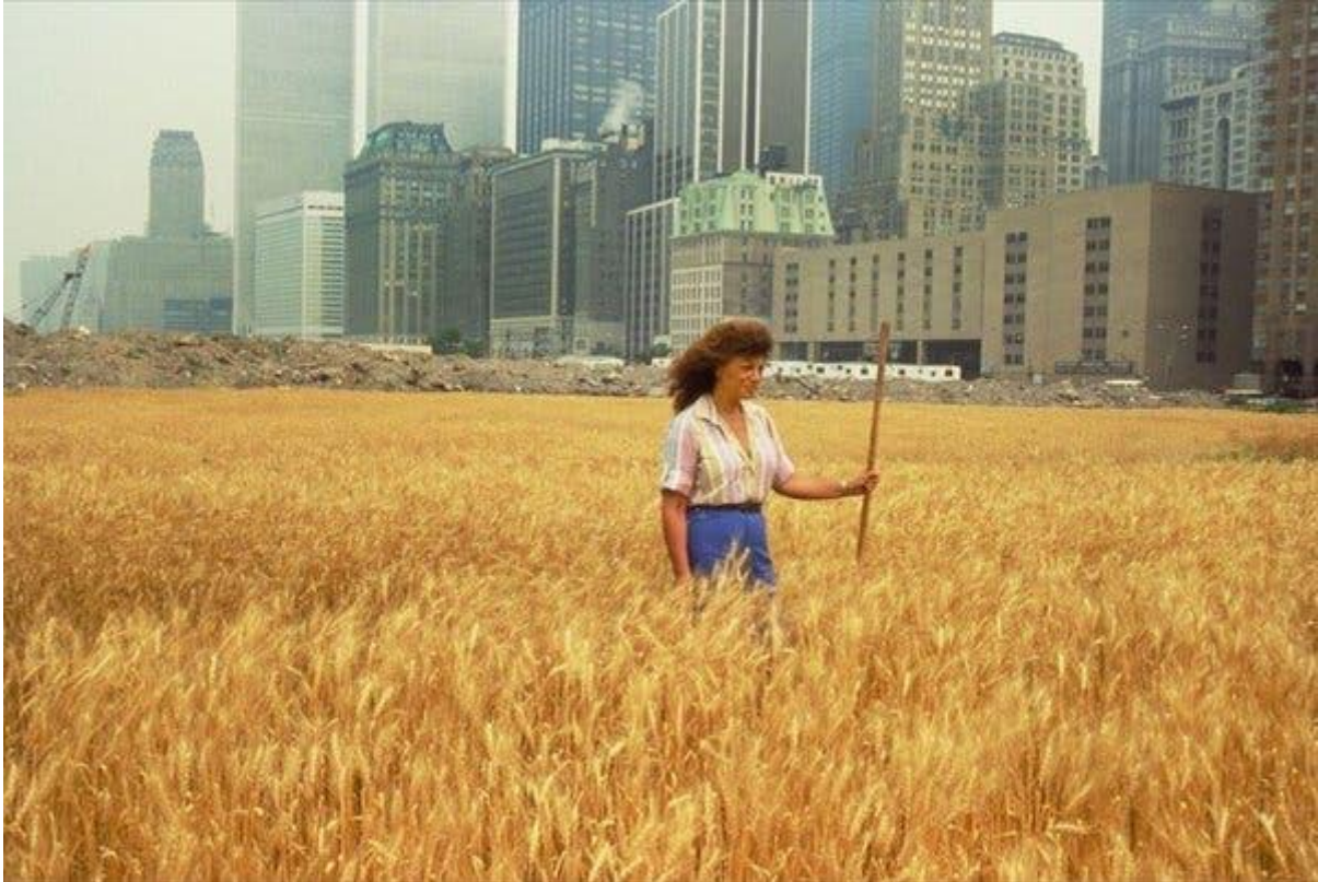
Resim 5. Agnes Denes, Buğday Tarlası-Bir Yüzleşme, Manhattan.1982

Buğday binlerce yıldır insanlık için önemli bir kaynaktır. Bolluk ve bereketi temsil ettiği için kutsal eski medeniyetlerce (Sümerler, Hititler...vb.) kutsal kabul edilmiştir. 1950'li yıllarda artan nüfus ve kentleşme ile bağlantılı olarak ürünlerin daha hızlı büyümesi amacıyla kimyasallar kullanılmıştır. Çünkü nüfus artışı ve tüketim arasındaki bağlantı hızlı üretimi beraberinde getirmektedir. Aynı yollarda buğday önemli dönüm noktalarından biri " Yeşil Devrim " olarak adlandırılır. Azotlu gübrelerin ve pestisitlerin buğday ekiminde yoğun bir şekilde kullanılmasıyla, buğday bitkisinden yapay ama hızlı bir şekilde ürün almak mümkün olmuştur ve dünya buğday üretimi 1961-85 yıllarında iki kat artırmıştır. Bu durum sistemin çıkarları amacıyla geliştirilmekte fakat olumsuz sonuçları konusunda çözüm sunulmamaktadır. (Atar, 2017, s.4.) Agnes Denes " Buğday Tarlası Bir Yüzleşme " isimli çalışması ile kötü yönetim, atık sorunu, dünyada halen var olan açlık ve ekolojik sorunlara dikkat çekmek istemektedir. Sanatçı çalışmasının temel mesajı olarak " yanlış belirlenmiş önceliklerimiz " ifadesini kullanmaktadır. Denes ektiği buğdayların hasadını yapar ve Minnesota Sanat Müzesinin düzenlediği " Dünya Açlığına Son Vermek İçin Uluslararası Sanat Sergisi " bünyesinde toplam yirmi sekiz ülkede sergilenir. Sergi boyunca insanların buğday tanelerinden almalarına izin verilir ve tohumların farklı topraklara ekilmesi sağlanmış olur. (Brown,2014, s.27.)