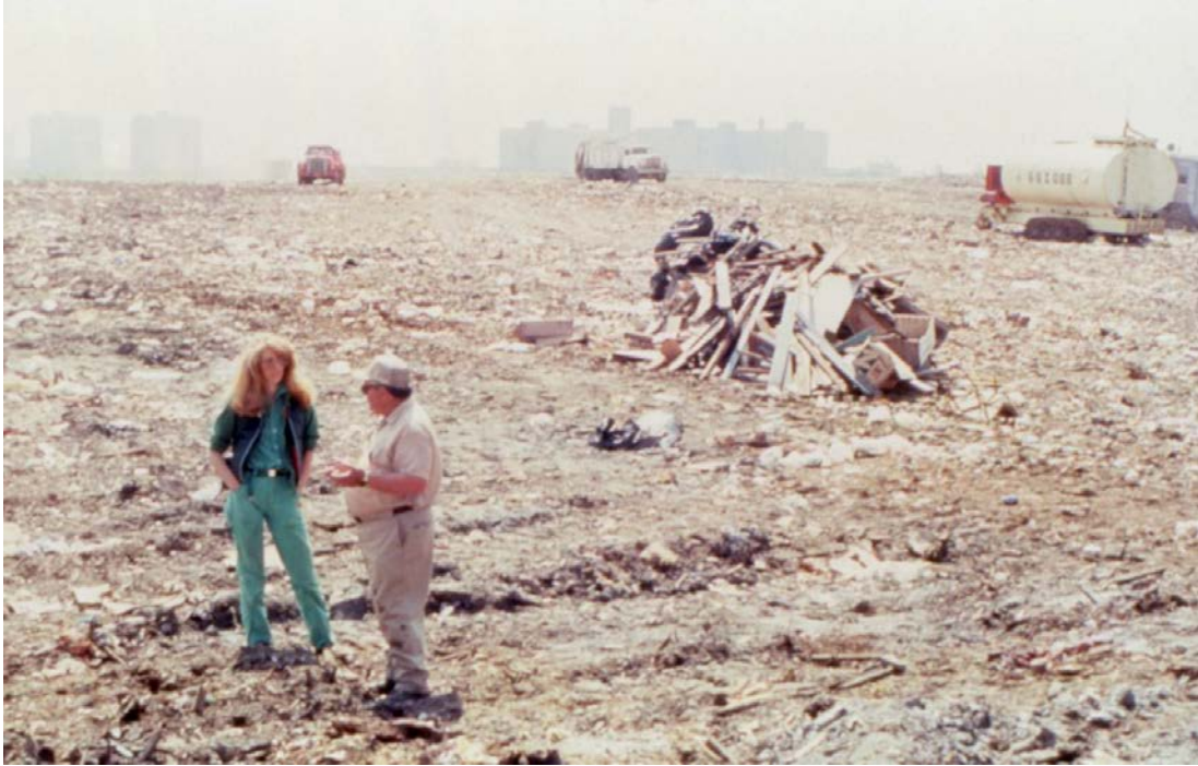
Resim 4 Mierle Laderman Ukeles, Touch Sanitation Performance, 1979-80

(Bknz. Resim 4) çalışması New York kentini baştan sona dolaşarak gerçekleştirmiştir. 8.500'den fazla temizlik işçisinin elini sıkarak şehri ayakta tuttukları için onlara teşekkür etmiştir. Ukeles daha sonra da sosyal, politik ve çevresel sorunları birleştirerek gelecekte sağlıklı bir ortam yaratabilmek için çalışmalarına devam ederken birçok kişiyi de sürece davet etmiştir. (Brown, 2014, s.14)