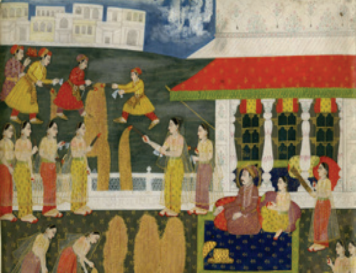
Resim 5 : Muhammed Şah için düzenlenmiş bir havai fişek gösterisi

Resim: Bkz. British Museum, Middle East, 1920,0917,0.237.