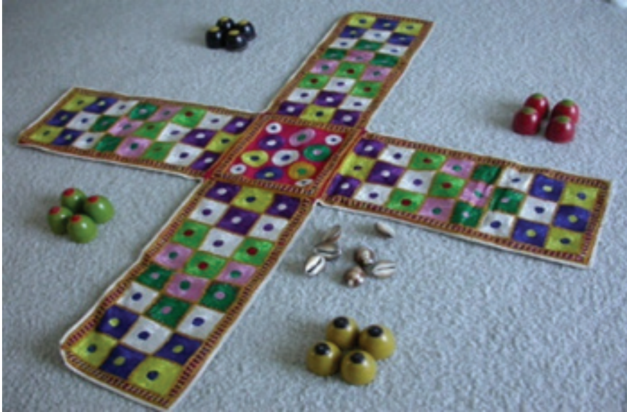
Resim 1: Chaupar oyunu