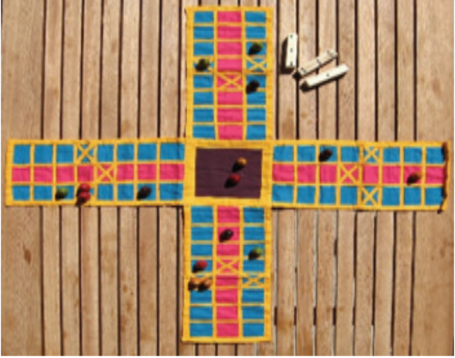
Resim 2: Peçiç Oyunu