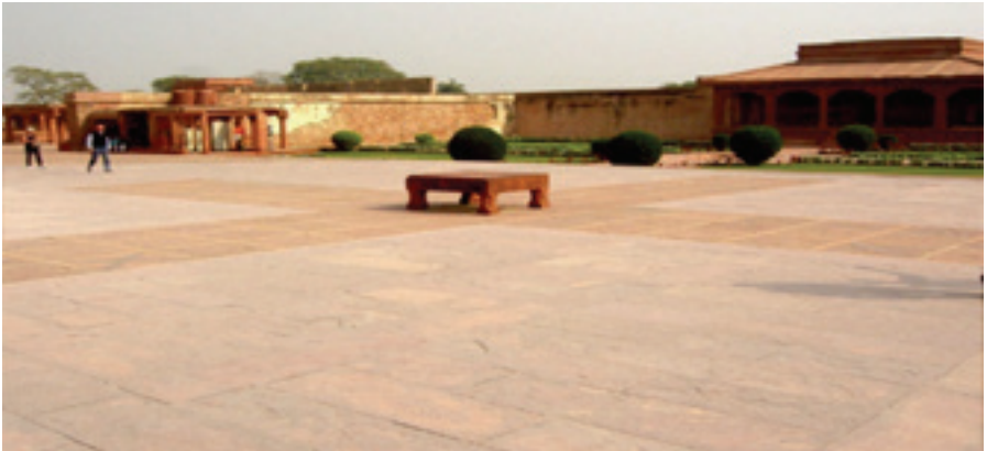
Resim 3: Fatehpur Sikri'deki Peçiç alanı