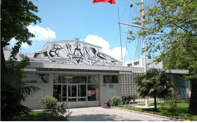
Figür.14. Deniz Müzesi Komutanlığı Kayıklar Galerisi

1970 yılında ise Ana Teşhir Binası yanında yer alan önceleri uçak hangarı, un ve temizlik ambarı gibi farklı amaçlarla kullanılmış bina müzeye tahsis edilerek koleksiyondaki tarihi kayıklar buraya taşınmış ve “Tarihi Kayıklar Galerisi” adıyla ziyarete açılmıştır.