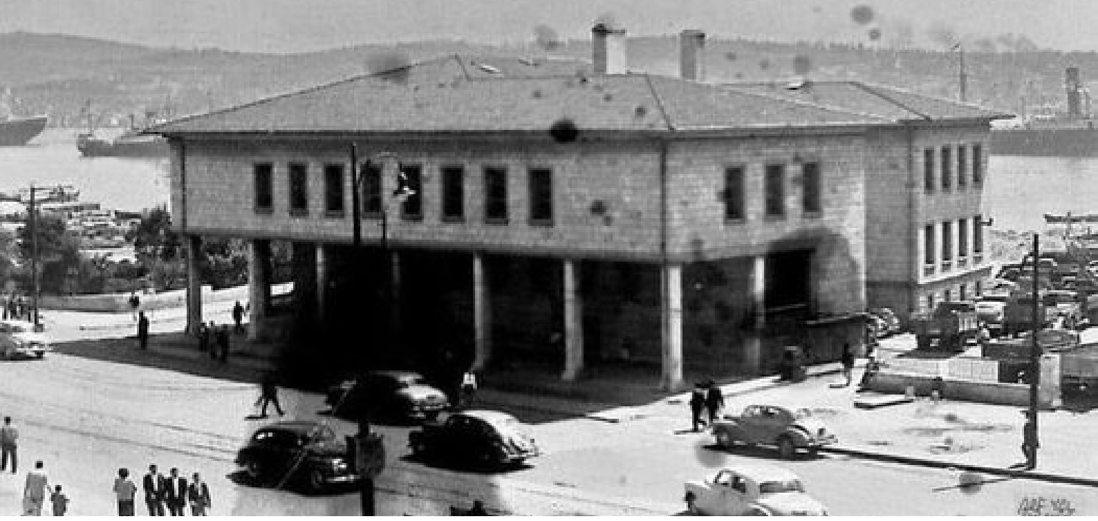
Figür.12 ve 13. Deniz Müzesi Komutanlığına ait ana envanterin 1961 senesinden itibaren sergilendiği Ana teşhir binası.

Bakanlar Kurulunun 7.3.1947 gün ve 3/5583 sayılı kararı ile Dolmabahçe Camii, Saray Garajı, Kayıkhanesi ve Hamlacılar Havuzunun mülkiyeti Deniz Müzesi yapılmak kaydıyla Milli Savunma Vekâletine verilmiş böylece Deniz Müzesi'nin Dolmabahçe Camiine taşınma süreci hızlandırılmıştır.