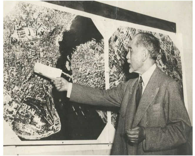
Figür.9. Henry Proşt

II. Dünya Savaşının sona ermesinden sonra 1942 yılında Milli Savunma Bakanlığı Deniz Müşavirliği koordinatörlüğünde Deniz Müzesi'nin yeniden kurulması düşüncesi uyanmış Deniz Müzesine yer bulma girişimleri tekrardan başlamıştır. Anadolu'nun çeşitli yerlerine dağıtılan müze objeleri ve arşiv evrakları İstanbul'a getirilmiştir. Anadolu'dan nakledilen envanterin Kasımpaşa'daki eski Divanhane binasının bir bölümüne taşınarak depolanması sağlanmıştır.