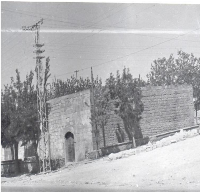
Figür.6, 7 ve 8 II. Dünya Savaşı münasebetiyle Deniz Müzesine ait eşyaların taşınma süreçleri.

derece önemli görülen koleksiyon parçaları ise İzmit'te Seymen'in Bahçecik semtindeki Amerikan okuluna, arşiv defter ve evrakları ise Bilecik Bozhöyük'e taşınmıştır. Müze koleksiyonuna ait eski gemi topları ise tersane içerisinde toprağa gömülmüştür. Yalıköşkü kayıkhanesinden getirilen tarihi kadirga, saltanat kayıkları, mermer kitabeler ve taşlar Kasımpaşa'daki tersane içinde bulunan gözlere çekilmiştir.(Özdemir,1978,8)