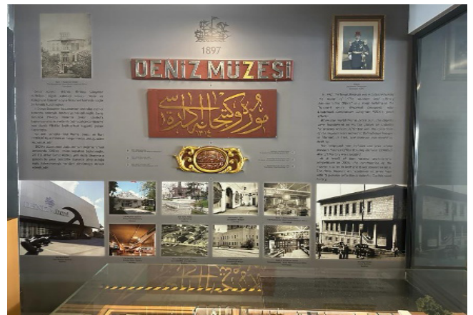
Figür.2. Deniz Müzesi Komutanlığında bulunan Deniz Müzesi ve Kütüphane İdaresi 1897 yazılı giriş tabelası.

"Bahriye Müzesinin teşkili hakkında kapsamı eski devirlerden beri Bahriyemizde mevcut olup feshedilen gemilerin isim levhaları, modelleri ve resimleri, tarihi levhalar, dereceli cetveller, levhalar ve buna ilaveten muhtelif yerlerde bulunan eski kitaplar ve seyir aletleri vesaire buldukları mahallerden alınarak eski tahsis kılınacak bir daire içerisinde toparlanmasının" önemi üzerinde durmuştur. (Nutki,2003,121)