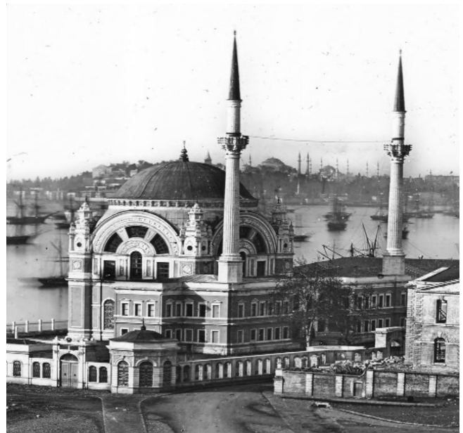
Figür.10 ve 11 Deniz Müzesi Komutanlığının 1948 tarihinden itibaren sergi alanı olarak kullandığı Dolmabahçe Camii.