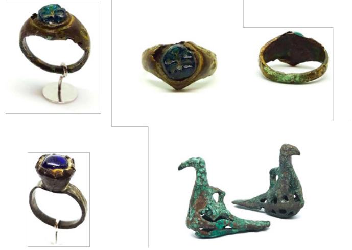
Figür 34: Koleksiyada özel muhafaza edilerek saklanılan arkeolojik kültürel eserler, FR gallery&studio, Bakü (Kaynak: Ruslan Hüseyinov Kişisel arşivi 2022).