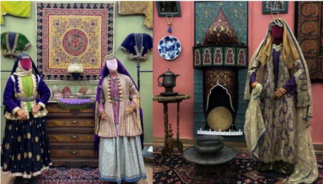
soylu erkek kıyafeti, FR gallery&studio, Bakü (Kaynak: Fuad Cebrayilov Kişisel Arşivi 2023).