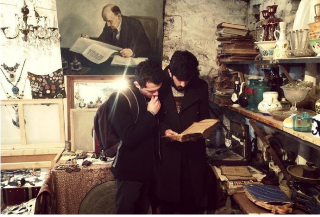
da bulunduğu bini aşkın eser bulunmaktadır. Figür 9: Antika Mağazası, Azerbaycan Şeki şehri.

lek ve etekler, cütbalaq, çaxçur, çadra ve çarşaf) yöresel farklı giysiler de yer almaktadır. Ayrıca çok sayıda iç çamaşırı, çarık, sapok, başmak (ayakkabı), başörtüsü, rübend, cutqu, Buhara papak (şapka), arakçın, Şebkūlah ve farklı aksesuarların