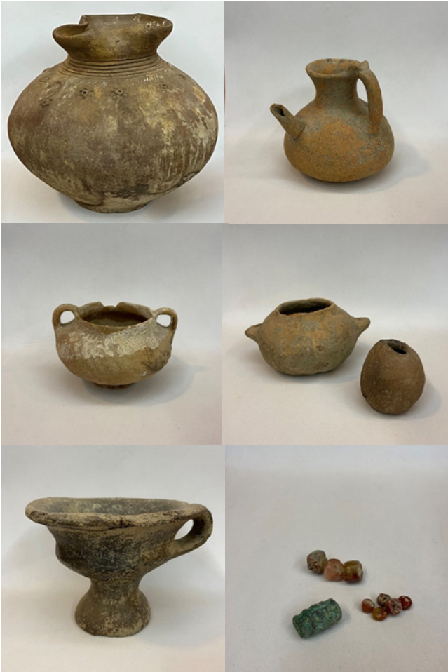
Figür 33: 19. yüzyılın sonu - 20. yüzyılın başlarına ait olan Azerbaycan'ın farklı bölgelerine ait eski fotoğraflar, FR gallery&studio, Bakü.