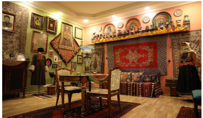
Figür 5: “FRcollection” özel koleksiyonunun bir kısmının sergilendiği galeri “FR gallery&studio”, Bakü (Kaynak: Fuad Cebrayilov Kişisel Arşiv 2021).