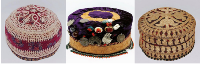
(Kaynak: Fuad Cebrayilov Kişisel Arşivi 2022). Figür 25: 19. Yüzyılın Azerbaycan milli geleneksel gümüş kadın ve erkek kemerleri, FR gallery&studio, Bakü (Kay-