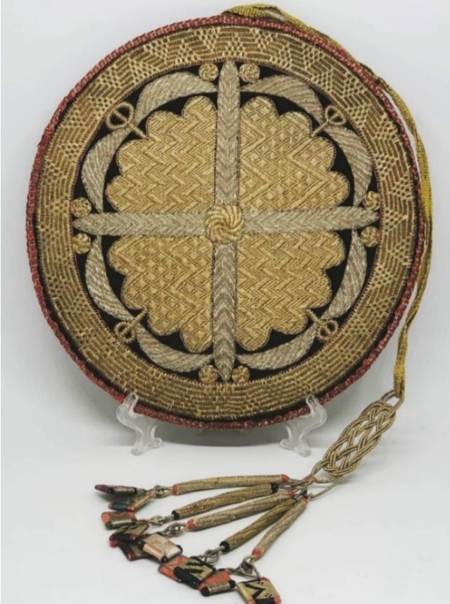
Figür 40: 18. yüzyıla ait tarak kabı, FR gallery&studio, Bakü

lanılan el işi mühür saklanmaktadır. Koleksiyona