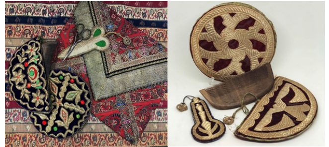
Figür 21: 19. yüzyılın Azerbaycan geleneksel Kadın ipek gömleği (yukarıdaki) ve Şeki bölgesine ait “Lebbade” adlı geleneksel kıyafeti (aşağıda sol ve sağdaki), FR gallery&stu-