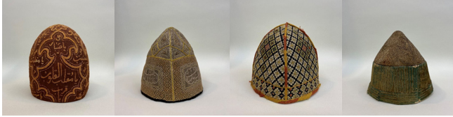
Figür 26: 19. Yüzyılın Azerbaycan geleneksel erkek baş giysileri, FR gallery&studio, Bakü