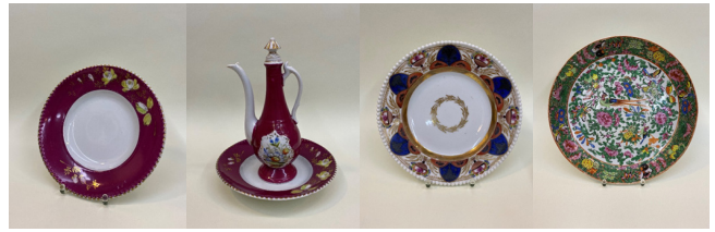
Bakü. Figür 28: 19. yüzyıl ve 20. yüzyılın başı ait olan Azerbaycan geleneksel ahşap taraklar, FR gallery&studio, Bakü.