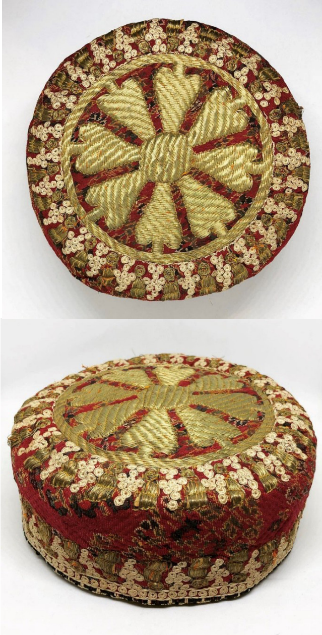
(figür 43) 18.yüzyılın başına ait olan “Herati” keleşayısının bir örneğidir.

2020 yılının Ekim ayında, Bakü şehir merkezinde tarihi mimariye sahip bir binada FRgallery&studio'nun açılışı yapılarak koleksiyonun bir kısmı sergilenerek ziyarete açılmıştır. 2003 yılından itibaren Ruslan Hüseyinov'un koleksiyon için eser toplamaya başlaması bugünkü koleksiyonu oluşmasında önemli bir rol oynamıştır. Ayrıca, 2012 yılında Ruslan Hüseyinov'un koleksiyonu ve Fuad Cebrayilov'un da çocukluğundan beri topladığı kendi koleksiyonu ile birleştirilmesi ile bugünkü “FRcollection” özel koleksiyonun oluşturulması sağlanmıştır.