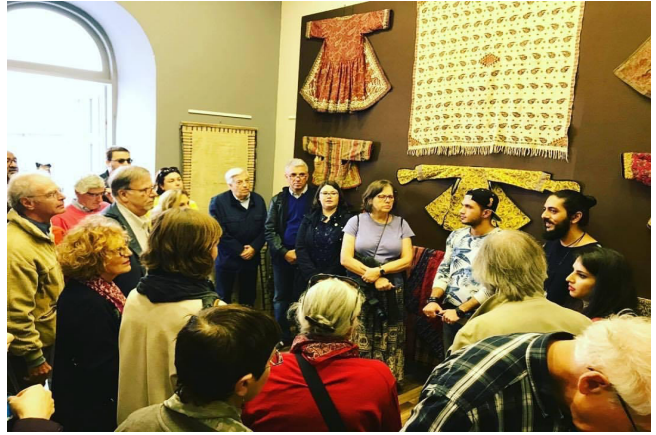
Figür 2: Azerbaycan Halısı üzere 5. Uluslararası Sempozyum” (İSAC 2017), Bakü, 17-20 Ekim 2017, Natavan Galeri, Bakü.