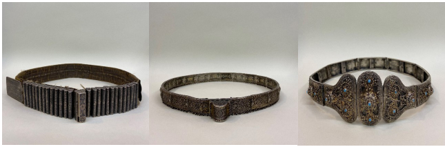
Kişisel Arşivi 2022). Figür 24: 19. yüzyılın Azerbaycan bölgesine ait geleneksel gümüş kadın başörtüsü takıları, FR gallery&studio, Bakü