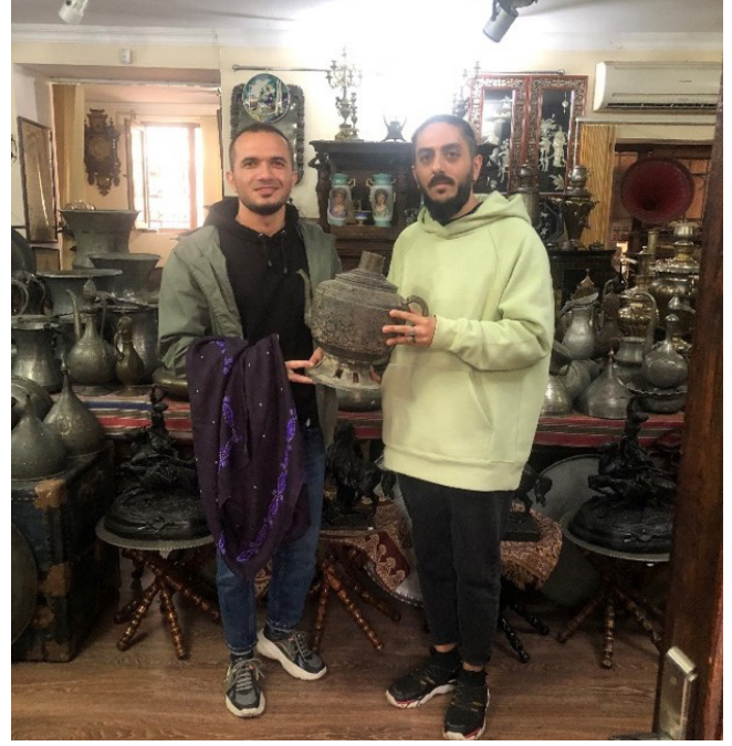
Figür 8: Semaver ve Kelağayı satın alımı, İçeri Şehir Antika Mağazası, Bakü.

Koleksiyonerler tarafından, maddi açıdan güçlü olan ailelere ait tekstil ürünlerinin çok olması, bu ürünlerin daha az kullanılması ve bu kıyafetlerin nesilden nesile korunarak aktarılması sayesinde geleneksel giysileri tanıma ve koleksiyona kazandırma fırsatı bulunmuştur. Ancak maddi olarak güçlü olmayan halkın çoğunluğuna ait tekstil ürünleri ve kıyafetlerin eski örnekleri, kullanım şartları ve saklama koşullarının yeterli olmaması gibi nedenlerle günümüze kadar korunamamış, aktarılamamıştır. Günümüze kadar ulaşılabilen eserler daha çok 18. yüzyıldan başlayarak 19. ve