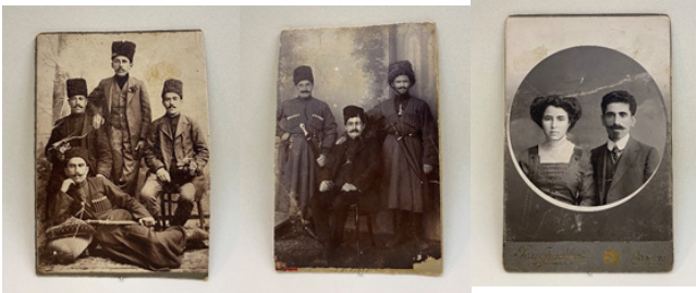
Figür 32: 17.-18.yüzyılına ait beyaz astarlı, şeffaf sırlı ve sır altı tekniği ile yapılan bitkisel ve kuş motifli seramik kaseler, FR gallery&studio, Bakü.