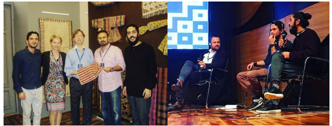
Figür 3: Antika Halı ve Kumaş uzmanları ile birlikte, Azerbaycan Halısı üzere 5. Uluslararası Sempozyum” (İSAC 2017), Bakü, 17-20 Ekim 2017, Natavan Galeri, Bakü (Kaynak: Fuad Cebrayilov Kişisel Arşivi 2017).