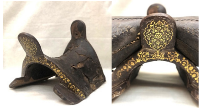
Figür 35: Koleksiyonda titizlikle korunan çeşitli metal malzemelerden oluşan arkeolojik yüzük ve bezeli eşyalar, FR gallery&studio, Bakü (Kaynak: Fuad Cebayilov Kişisel arşivi 2022).