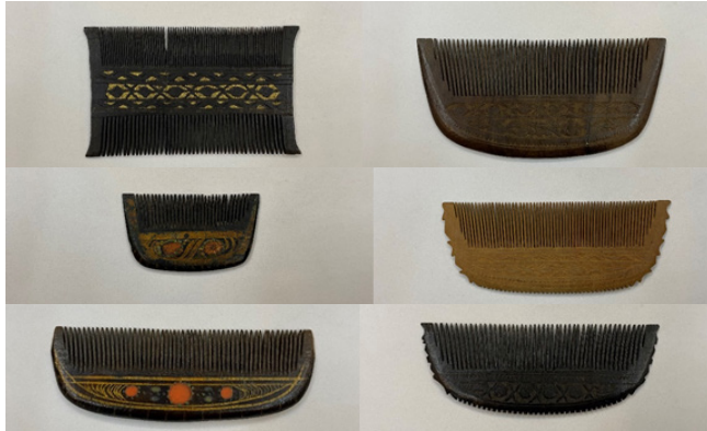
Kişisel arşivi 2022). Figür 27: 19. yüzyıl ve 20. yüzyılın başına tarihlenen dervişlere (sufilere) ait baş giysileri, FR gallery&studio,