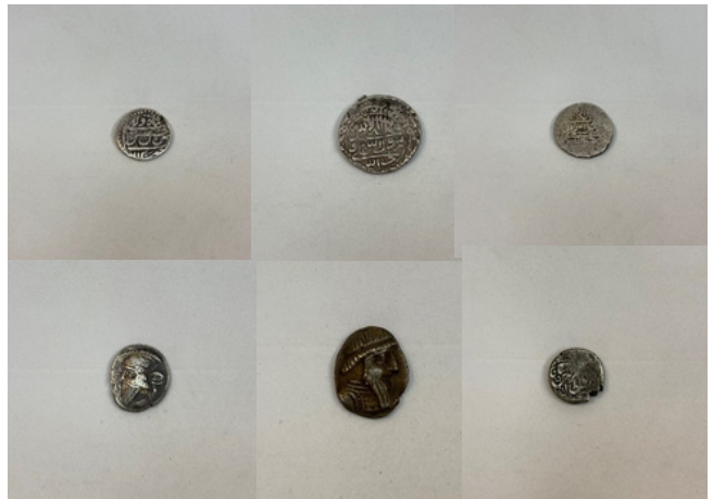
Figür 30: 19. yüzyılın Kaçar dönemine ait resimli ahşap terazi kutusu, bronz terazi ve kefeli terazi ağırlıkları, FR gallery&studio, Bakü.