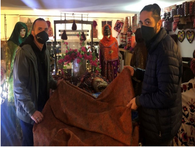
Figür 6: İran'ın Meşhed şehri Antika Mağazası.