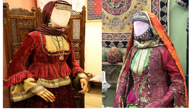
baycan İsmayılı “Lahic” ve İrevan bölgesine ait geleneksel gelin kıyafeti (sağdaki fotoğraf), FR gallery&studio Bakü.