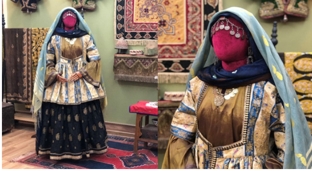
mi hakkında bilgi vermemiz gerekmektedir. Figür 17: “FRcollection”un 19. yüzyılın son çeyreğine ait Bakü soylu ailelerinden birine ait gelin kıyafeti FR gal-

eserler görseller üzerinden tanıtılacaktır. Her koleksiyonda olduğu gibi koleksiyonerin sahip olduğu kültürel varlıkların her biri kendine özgün hem tarihi ve hem de manevi özelliği olan eserlerdir ama bazı eserler uzun yıllar içinde bulunma olasılığı az olması, tarihsel önemi açısından nadirliği ve diğer özel nitelikleri nedeniyle daha fazla önem taşımaktadır. “FRcollection” koleksiyonunda da özel parçalar bulunmaktadır, koleksiyonun önemini daha iyi anlamak için bazı eserlerin tarihi öne-