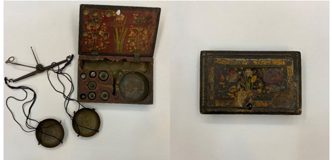
Figür 29: 19. yüzyıla ait olan yurtdışında farklı ülkelerde üretilen Azerbaycan'da yaygın kullanılan el işi seramik ev eşyaları, FR gallery&studio, Bakü.