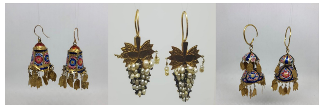
dio, Bakü (Kaynak: Fuad Cebrayilov Kişisel Arşivi 2022). Figür 22: 19. ve 20. yüzyılın başı Azerbaycan bölgesine ait geleneksel altın iplikle işlemeli Kuran kabı, Tarak kabı,