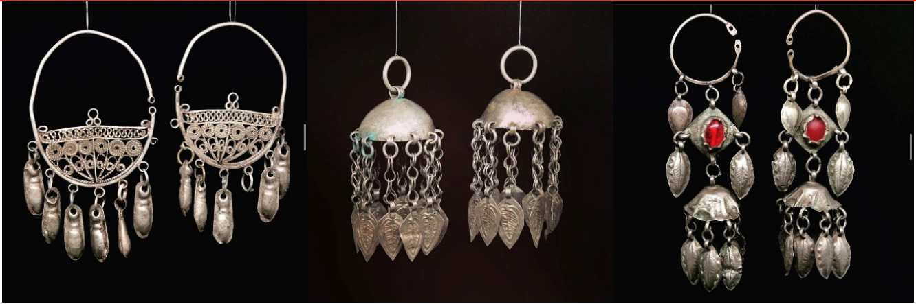
Makas kabı ve Parfüm kabı, FR gallery&studio, Bakü (Kaynak: Ruslan Hüseyinov Kişisel Arşivi 2022). Figür 23: 19. yüzyılın Azerbaycan bölgesine ait geleneksel altın takılar, FR gallery&studio, Bakü (Kaynak: Fuad Cebrayilov