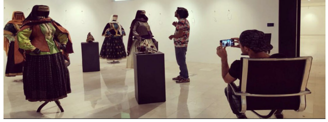
Figür 1: FRcollection özel koleksiyonu Kıyafet ve Keleğayı sergisi, Azerbaycan Milli Halı Müzesi Sergi Salonu, Bakü.