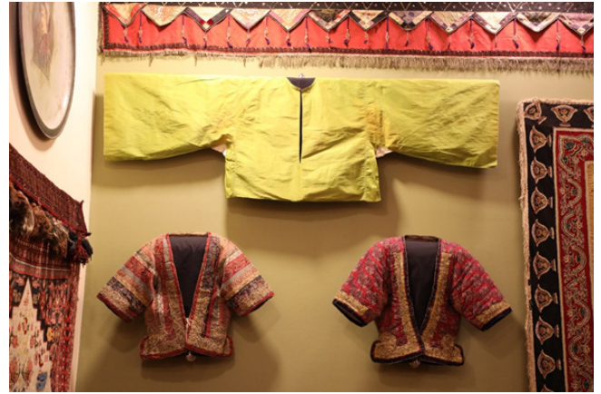
Figür 20: “FRcollection”un 19. yüzyıla ait Karabağ-Şuşa (solda) ve Bakü (sağda) hanımına ait geleneksel kıyafet, FR gallery&studio, Bakü ( Kaynak: Ruslan Hüseyinov ve Fuad Cebrayilov Kişisel Arşivi 2021).