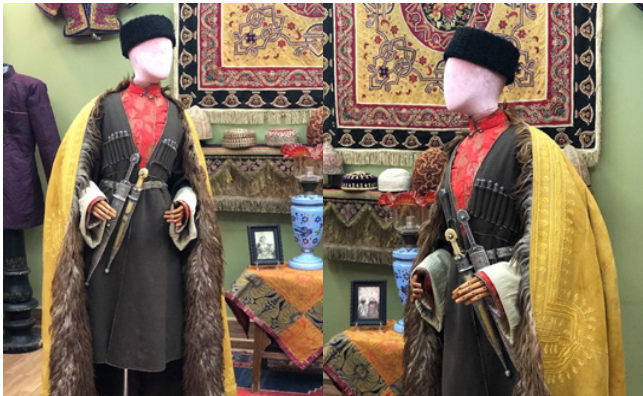
lery&studio, Bakü (Kaynak: Fuad Cebrayilov Kişisel Arşivi 2023).