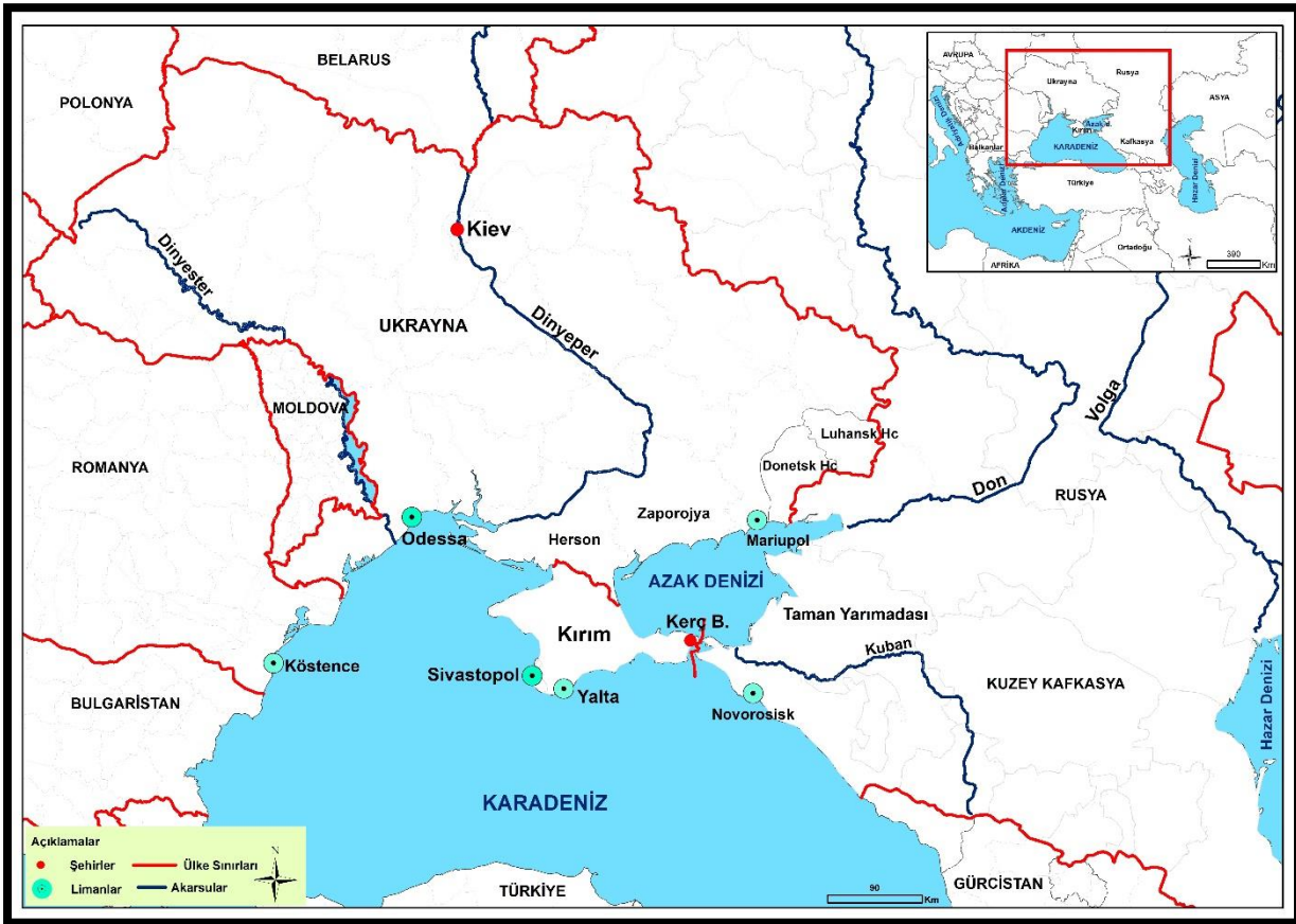
Harita 1: Azak Denizi'nin Konumu

Azak Denizi, Karadeniz Havzası'nın kuzeydoğusunda yer alan bir iç deniz olup, günümüzde Rusya ve Ukrayna arasında bulunmaktadır. Azak Denizi Karadeniz'e açılan bir ayak olduğundan bazı dilbilimcilerce Karadeniz'in ayağı olarak tanımlanmıştır (Harita 1).