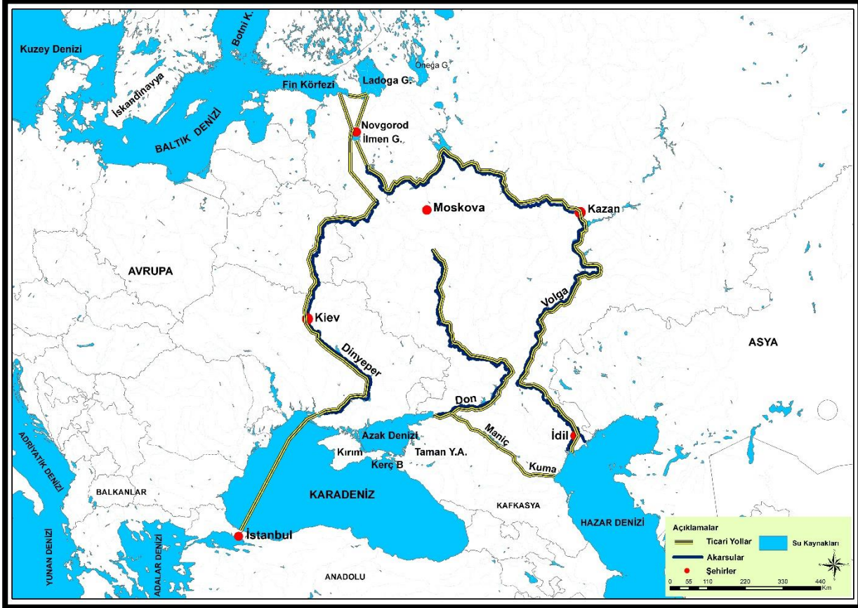
Harita 2: Avrupa Ticari Yol Haritası

Avrupa-Asya arasındaki ticari yollar akarsular ve denizler üzerinden Azak Denizi çevresinden geçmekte idi. Ruslar, Doğu Avrupa'nın ticari yollarını ele geçirmek için Azak Denizi'nin kuzeyinde İskandinav-Volga- Hazar Denizi'ne ve Fin Körfezi'nden başlayarak Dinyeper ve Karadeniz, İstanbul'a giden iki ticari hattı ele geçirmek istemiştir (Kurat, 2014:16). Araplar, güneyden kuzeye uzanan ticari yollarında Hazar Denizi'nden İdil'e, oradan da Volga Nehri vasıtası ile İdil Bulgar Devleti ile irtibat kurmuş ve Dinyeper Nehri üzerinden Kuzey Avrupa'ya uzanmışlardır (Canbek, 1978:19). (Harita 2).