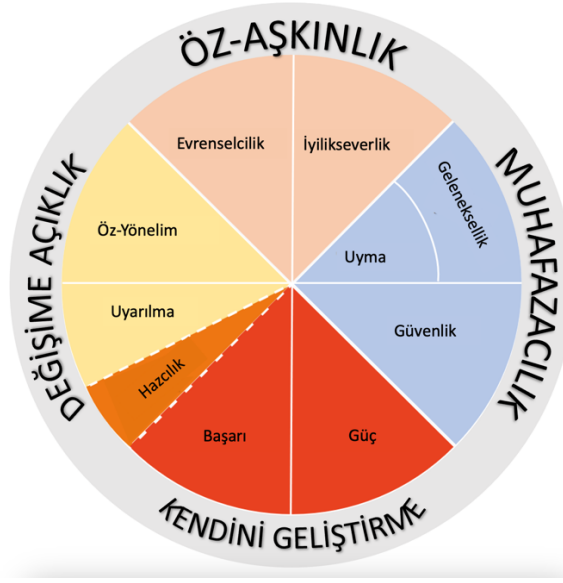
Şekil 1. Schwartz'ın İdealize Edilmiş Yarı-dairesel Modeli

Eğitim, genel olarak çocuk ve gençlere toplumsal yaşamda gereken bilgiyi, beceriyi ve anlayışı edindirme; kişiliklerini geliştirme amacıyla okul içinde ve dışında doğrudan ve dolaylı olarak yardım etme olarak tanımlanabilir. Değerler eğitimi, toplumsal açıdan “iyi, güzel, doğru” kabul edilen tutum ve davranışların yeni kuşaklara aktarılması olarak betimlenebilir (Erkılıç, 2019). Değerler eğitiminin kapsamı belirlenirken, millî, dinî, evrensel, insani ve toplumsal olarak “istendik” tutumlara odaklanılır. Ayrıca değerler eğitiminin kapsamı dönemin sosyal, ekonomik ve politik odaklarına bağlı olarak da değişebilir.