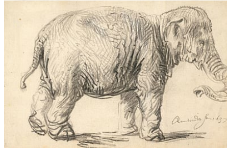
Görsel 1. Rembrandt Harmenszoon van Rijn, 1637, Fil/ An Elephant.

Bahsi geçen dönem ressamlarının eskiz niteliğindeki çizimlerinde bile iki boyut üzerindeki üçüncü boyutun var edilme uğraşısı olarak yaratılan hacim ve mekân hissi ile sahnelerin daha gerçekçi tasvir edilmiş biçimindeki evrim, net bir şekilde gözlemlenebilmektedir. Resimlerinden de bilindiği üzere ışığı yoğun ve dramatik bir biçimde kullanan Rembrandt’ın Fil isimli çiziminde, boyutu olmayan kontur durumundaki çizgilere kolayca hacim kazandırıldığı görülür (Görsel 1). Buradaki çizimi bütünleyen çizgilerin her biri kendi içinde ışık ve gölgeyi temsil ederek hacime biçim ve yön verirler.