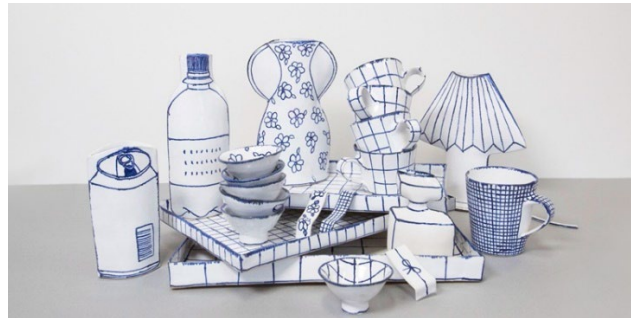
Görsel 8. Marianne Hallberg, 2023, Seto Ware Series.

Marianne Hallberg, Morling'in anlayışına benzer bir anlayışla şekillendirdiği formların üç boyutlu olmalarından faydalanarak gerçekte hacmi olmayan çizgilere üçüncü boyutlarını kazandırır (Görsel 8). Bunun sonucunda da boyutlar arası kurgusal oyunlar yaratır.