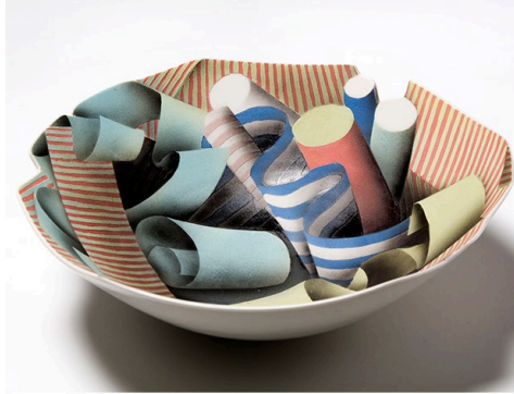
Görsel 9. Velimir Vukicevic, 2013, Bilinmiyor.

Velimir Vukicevic'in eserleri, yüzeyleri üzerinde renklerle modle edilmiş birtakım görselleri barındırır. Boyutlar arasındaki sınır neredeyse ortadan kalkacak kadar bulanıklaşmıştır. İki boyutun üç boyut ile bu denli iç içe geçmesi önceki örneklerle göre daha belirgin ve etkili yanılsamalar yaratmaktadır. Boyutların birlikte kullanılmasından kaynaklı hedeflenen yanılsama, çalışmalarında net bir şekilde gözlemlenmektedir (Görsel 9).