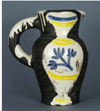
Görsel 3. Pablo Picasso, 1954, Vazolu Sürahi/ Pitcher with Vase. Masterworks Fine Art Gallery. Erişim: 15.10.2023. https://l24.im/OwPfcz

Hatta daha da ileriye giderek, bu makalenin merak konusu olan iki ve üç boyutluluğun ortaklığından doğan doğal bir şaşırtmaca örneğini yine seramik malzeme ve çizim ile sunmuştur. Düşünüldüğünde, seramik üzerine yapılan çizimlerde hacim doğal olarak iki boyutlu olmaktadır. Seramik üzerinde resim kullanımı, üç boyutlu forma iki boyutlu bir görüntü vererek biçimsel bir kompozisyon yaratır. Picasso'nun 1954 tarihli ‘pitcher’ (ibrik) adlı eserinde sanatçı, imge ve nesne ikiliğini çeşitli perspektiflerden araştırmış ve vurgulamıştır. Bu örnek, pratik ve günlük kullanım için bir metafor görevi görerek Picasso'nun çömlekçilikle ilişkili dil ve metaforlar konusundaki anlayışını sergiler (Görsel 3).