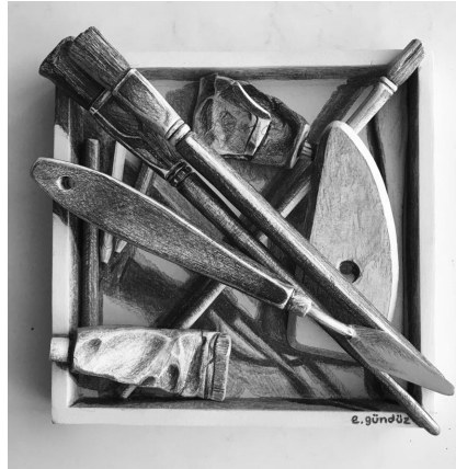
Görsel 12. (Kişisel Uygulama), 2021, Siyah&Beyaz/ Black&White. (7. Uluslararası Katılımlı Genç Seramikçiler Karo Tasarım Yarışması Uşak Üniversitesi Başarı Ödülü)

Gölgelendirmenin kendisi bir yanılsamadır. Bu bir aldatmaca ve hatta bazı hallerde boyutlar arası eğlenceli bir oyun haline gelmektedir. Potts, gölgelerin heykellerin ayrılmaz bir parçası olduğunu söylerken, ışık ve gölge birlikteliğinden doğan gölgelerin formla birleştiği noktaları, yüzey aydınlatması oyunu olarak açıklar (Potts, 1998, s. 41). Form üzerinde uygulanan gölgelerin yönlendirmesiyle, varsayılan ışık kaynakları ile oynanan oyun, boyutlar arası bir hacim oyununa dönüşür.