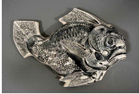
Görsel 4. Semih Kaplan, 2018, Nereus.

Seramik üzerine çizimin entegre edilmesi, sanat eserine başka bir boyut katarak sanatçıların fikirlerini benzersiz bir şekilde ifade etmelerine olanak tanır. Önemli ressamların bu girişimlerinden sonra seramik sanatçıları da değişen sanat anlayışlarıyla seramik yüzeyler üzerinde farklı ifade olanakları aramayı sürdürmüş ve seramik sanatının gelişmesine katkıda bulunmuşlardır. Dolayısıyla iki disiplinin bir araya gelerek oluşturduğu kesişim kümesinin çerçevelediği alanda hem ressamlardan hem de seramik sanatçılarından örnekler vermek mümkündür (Görsel 4).