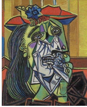
Görsel 2. Pablo Picasso, 1937, Ağlayan Kadın/ The Weeping Women. Tate. Erişim: 15.10.2023. https://l24.im/X6u7g