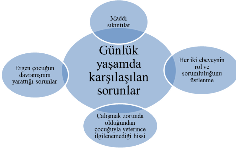
Resim 1. Tek ebeveynlerin günlük yaşamlarında karşılaştıkları Sorunlar

Çalışmaya katılanların %25'i (10 kişi) çocuğuyla herhangi bir iletişim sorunu yaşamadığını ifade etmiştir. Ergen çocuğuyla sorun yaşadığını ifade edenlerden elde edilen verilerin analizi sonucunda tek ebeveynlerin yaşadığı iletişim sorunları (Resim 2) aşağıda üç başlık altında toplanmıştır.