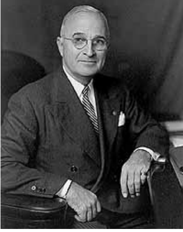
Harry S. Truman