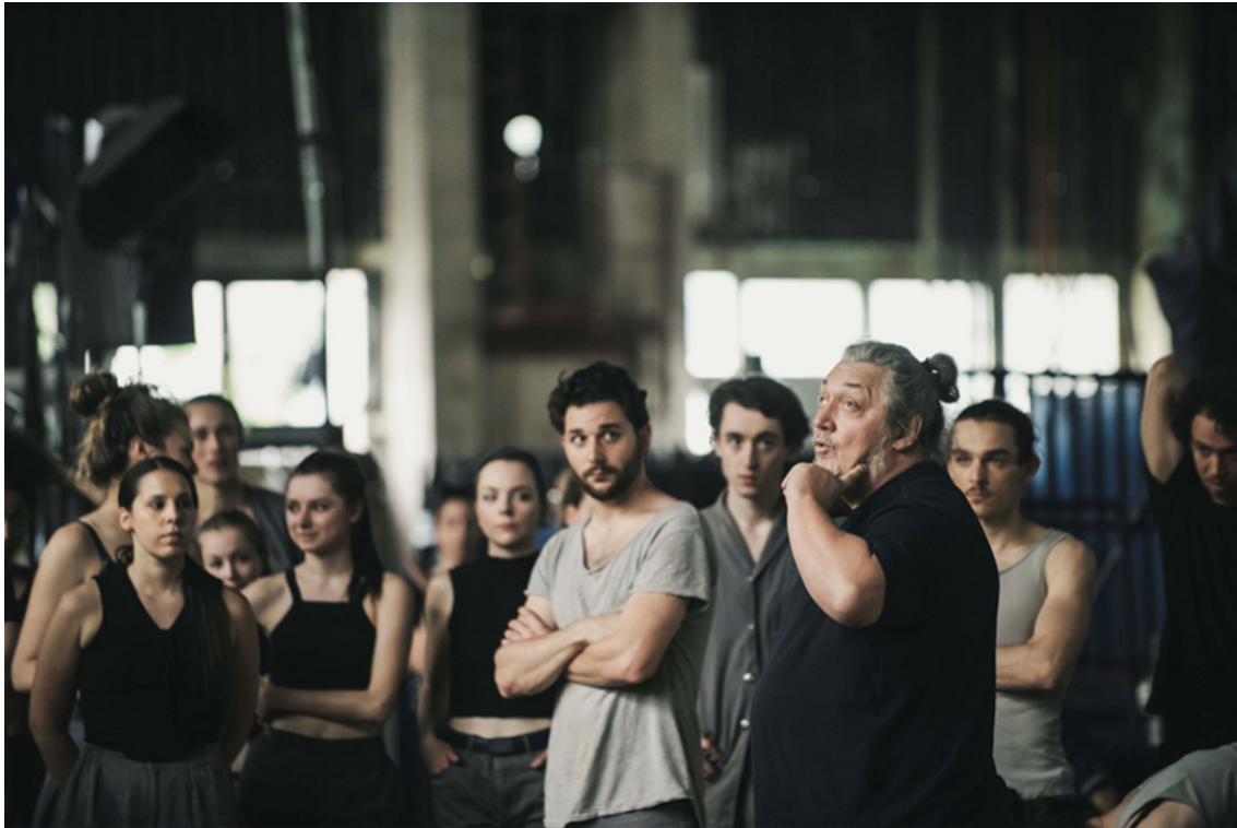
Resim 2. Attila Vidnyánszky oyunun genel provasında

adlı oyununu olimpiyatların kapanış etkinliği olarak gerçekleştirmeyi amaçlamıştır. Proje, 10. Uluslararası Tiyatro Olimpiyatının Artistik direktörü, Macar Ulusal Tiyatrosu'nun Genel Sanat Yönetmeni ve Budapeşte Tiyatro ve Film Sanatları Üniversitesi'nin Mütevelli Heyet Başkanı Attila Vidnyánszky'nin direktörlüğünde yürütülmüştür.