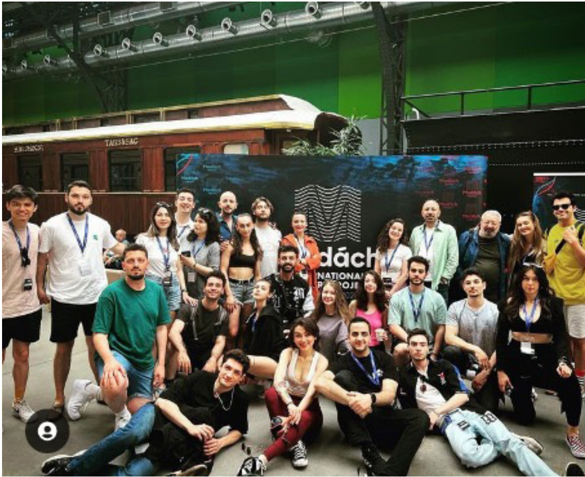
Resim 4. İstanbul Aydın Üniversitesi Güzel Sanatlar Fakültesi Drama ve Oyunculuk Bölümü Ekibi

Attila Vidnyánszky'nin hayata geçirdiği proje iki ana kısımdan oluşmaktaydı. İlk kısım, oyunun 15 epizotunun her ülkeden drama öğrencileri tarafından kendi ana dillerinde, kendi yönlerinde, hayal ettikleri manzara da canlandırıldığı bir okullar buluşması