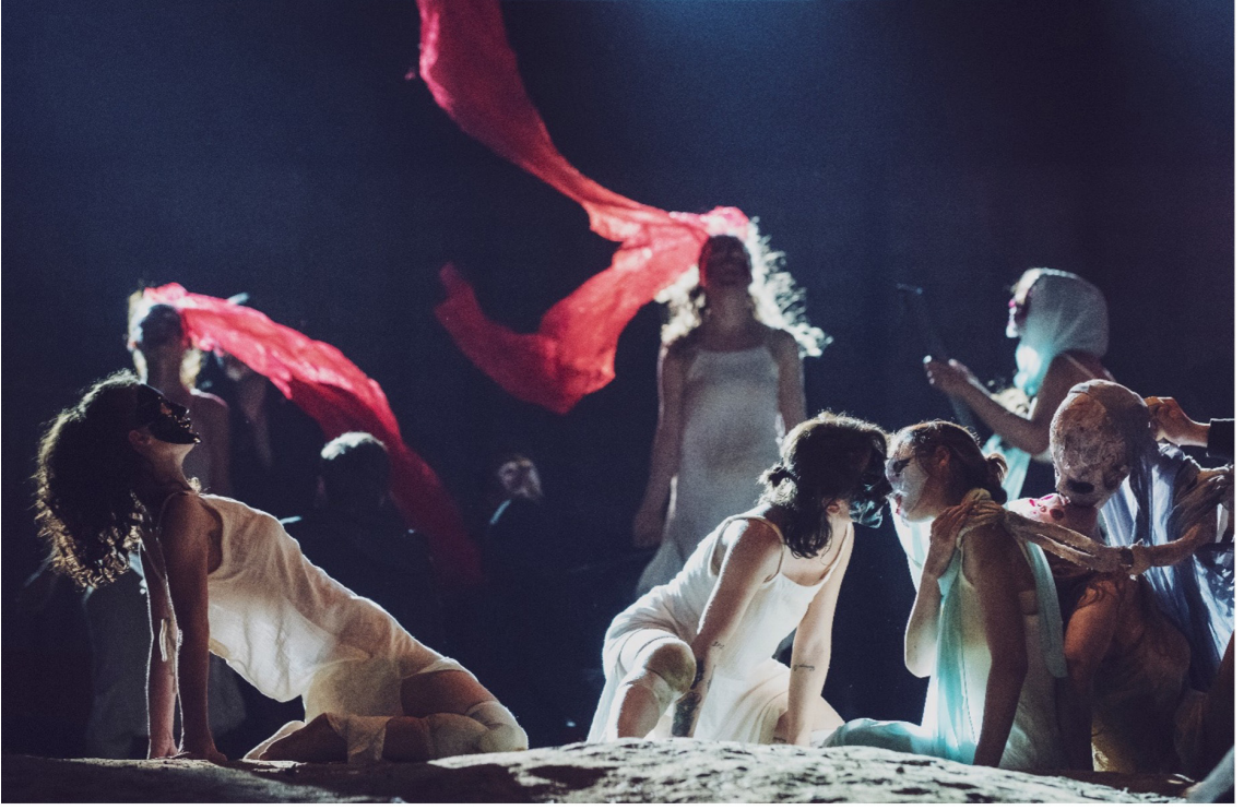
Resim 5. Konstantinopol Sahnesi

Dört kıtadan gelen genç üniversite öğrencilerinin, Macar edebiyatının başyapıtlarından biri olan İnsanlık Trajedisi'ni kendi teatral düşünce tarzlarına göre Macar seyircisine sunmak için aylarca uğraştığı projeyi, benzersiz bir kültürel misyon olarak tanımlamak hatalı olmayacaktır. Oyunun cenet epizodunu Polonya'dan davet edilen Varşova Film Okulu sahnelerken ev sahibi Macaristan, Paradiscom ve Falanster sahnelerini hayata geçirdi. Giza'daki Dramatik Sanatlar Yüksek Enstitüsü Sanat Akademisi oyunun Mısır bölümünü, Yunanistan'dan Atina Konservatuvarı Drama Okulu, oyunun Atina bölümünü ve İtalya'nın Milano kentindeki Centro Teatro Attivo, oyunun Roma epizotunu sahnelerdiler. Türkiye'yi temsilen