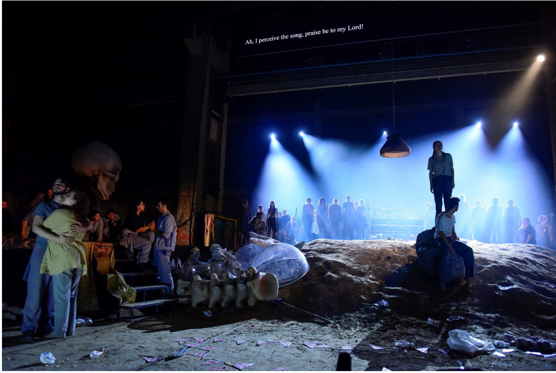
Resim 6. Oyunun finalinden

Buluşmaya davet edilen okulların kendi kültürlerinin süzgecinden geçirerek hazırladıkları çalışmalarının tek tek izlendiği ilk kısmın ardından tüm okullar projenin ikinci kısmını hazırlamak üzere Attila Vidnyánszky yönetmenliğinde iki hafta süren yoğun bir prova sürecine girdiler. Tuna nehri üzerinde bulunan Obuda adasındaki eski bir gemi fabrikasının hangarı, proje için sahneye dönüştürüldü. Yoğun prova sürecinin sonunda iki yüzü aşkın oyunculuk bölümü öğrencisinin sahne aldığı yapım 10. Tiyatro Olimpiyatlarının kapanış oyunu olarak 23 Haziran tarihinde iki ara ile toplamda yedi saat yirmi dakika süre ile seyirciyle buluştu.