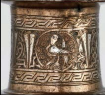
Görsel 5: The David Collection, Copenhagen i. n. “2/1963” (Pernille Klemp). (Baş ve Bekmez, 2022, s.65)

Selçuklu çini sanatının en nadide parçalarının üzerlerinde deniz kuşları, tek ve çift başlı kartal, tavus, güvercin figürlerinin yanı sıra ördek figürleri de yer almaktadır. Selçuklu çini sanatında yer edinmiş olan bu figürlerin bazıları mimari bezeme öğeleri olarak binaların cephelerinde, taş ve tahta sandukalarda, mezar taşlarında, kapı, minber ve kürsülerde, havuz, çeşme ve su fiskiyelerinde kullanılmıştır (Ersoylu, 1980, s.85).