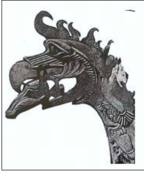
Görsel 1: Ağızda geyik başı ve boynuna ördek figürleri işlenmiş hayali yırtıcı hayvan kafası (Kılıçkan, 2004, s.54).

Artuklu dönemi bilginlerinden olan El Cezeri, Kitab-ül Hiyel adlı eserinde makine, su saatleri ve bazı kapkacaklarla ilgili deneyimlerinden bahsederken eserinin içerisinde yer alan bazı minyatürlerde ördek figürüne de rastlamaktayız. Örneğin; Cezeri, dönemin hükümdarına abdest aldırılmaya yarayacak bir mekanizmada ördek figürünü kullanmıştır. Bu minyatürde ördeğin kullanılan abdest suyunu içine yerleştirilmiş sifon yardımıyla kirli su bölümüne aktardığı anlatılmaktadır. Cezeri, ördeğin suyu içtiği fikrini yaratmak için bu olayı gerçekleştirmeyi arzu etmiştir denilebilir. Burada kullanılan ördek figürüne tavus kuşu diyenler de olmuştur (Görsel 2) (Takiyüddin, 1976, s.57).