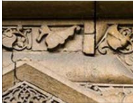
Görsel 4: Divriği Ulu Camii Cennet Kapı, Balıkçı ve Ördek Figürü