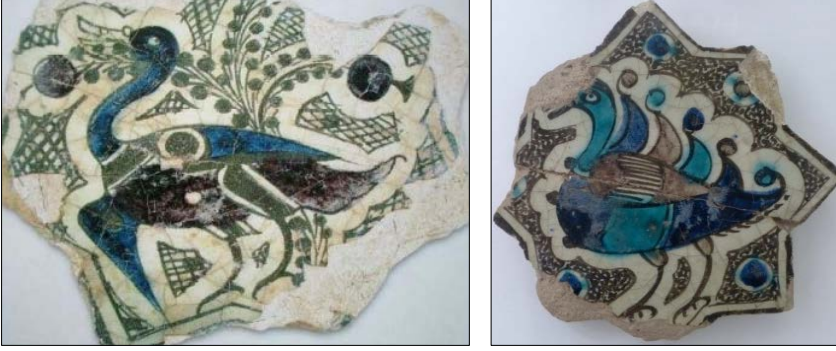
Görsel 7- 8: Beyşehir Kubad Abat Sarayı yıldız şekilli çini karolar içerisinde ördek motifleri (1236) (Barry, M.P.).

karakteri olduğunu aynı zamanda da bir av hayvanı olarak geçtiğini belirtmektedir (Arısoy, 2018, s.379) (Görsel 7-8).