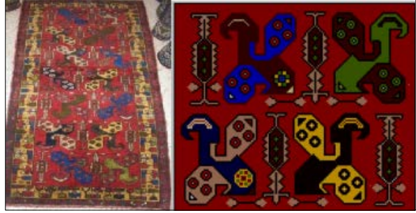
Görsel 6: Niğde Çamardı yöresi halı dokumasında görülen ördek motifi (Akpınarlı ve Gök, 2015, s.439)

Selçuklu saray mimarisinde çini karolarda av sahnelerinin başrol aktörü olarak ördek ve kuş figürlerine yer verildiği görülmektedir. (Öney, 2004, s.67). Bu figürlerin insan bedenini temsil ettiği söylenmektedir. Bilhassa beraber betimlenen nar motifi de bereketi, bolluğu temsil etmektedir. Ördek figürünün ayakları yeşil renkle, boyun ve kanatları ise kobalt renkle boyanmıştır. Arısoy, ördeklerin, göllerin en önemli aksesuarları olarak Dede Korkut efsanelerinin ana