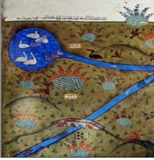
Görsel 9: Matrakçı Nasuh, ördek, kuş, tavşan ve oğlak TSMK. (Topkapı Sarayı Müzesi Kütüphanesi) B.408, y.19a figür detaylı doğa tasviri.

görülmektedir (Görsel 10). Bu figürler tamamen stilize edilmiş bir şekilde işlenmiştir. Süslemenin ortasında realist üslûba yakın başı arkaya dönük uzun kuyruklu kuş tasvirine yer verilmiştir (Boydak, 2021, s.211).