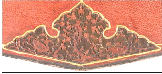
Görsel 10: Süleymaniye YEK Fatih: 3887, 906/1501, Miklep şemsesinde çeşitli kuş tasvirleri, Özkul, K. (2020, s.196).