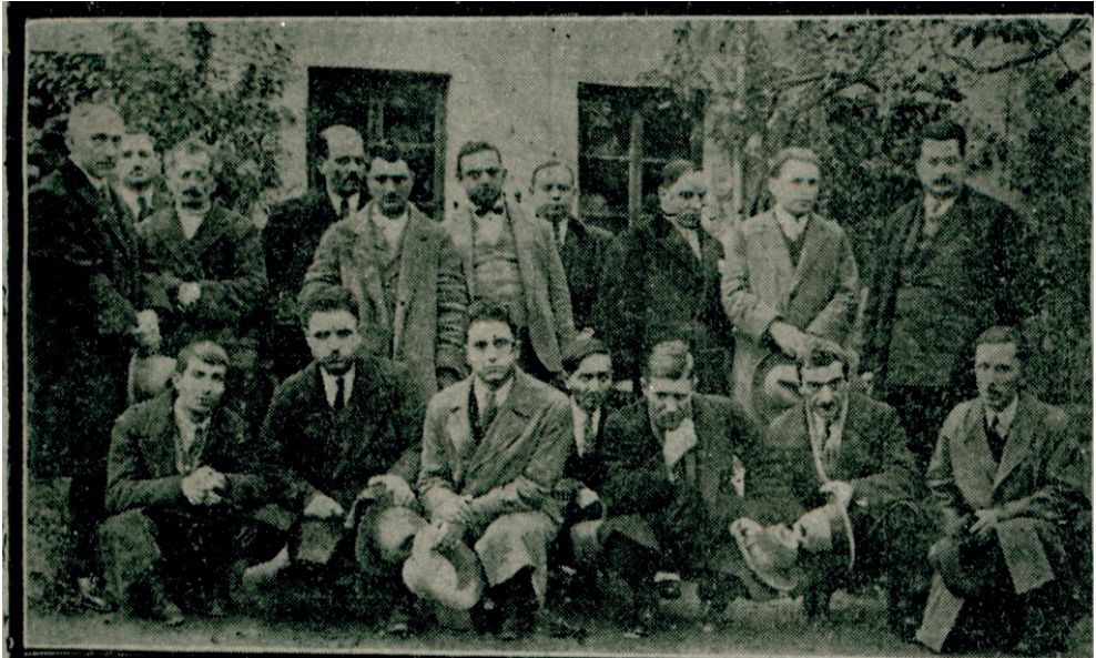
Kaynak: Cumhuriyet , Sayı: 1293, 14 Kanun-ı Evvel 1927, s. 1.