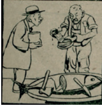
Ek 5: “Yeni Cumhuriyet Paralarını Üç Günde Kirletmeyelim” Başlıklı Karikatür

Kaynak: Cumhuriyet , Sayı: 1286, 7 Aralık 1927, s. 1.