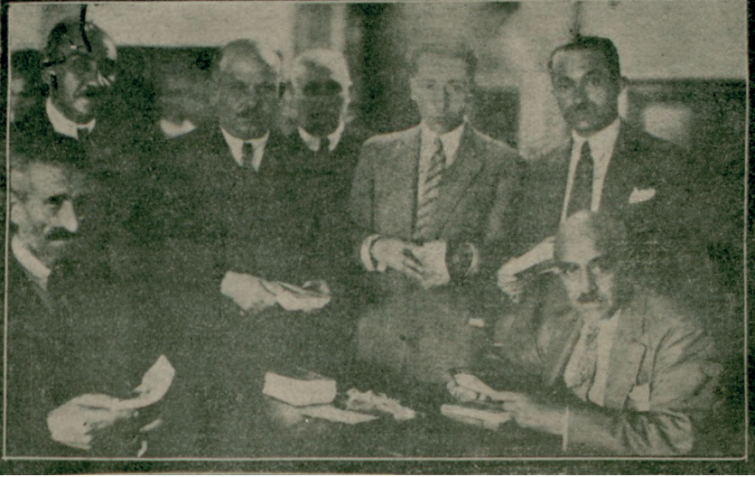
Ek 3: Evrak-ı Nakdiyenin Sayımına Memur Edilen Heyet Paraları Sayarken