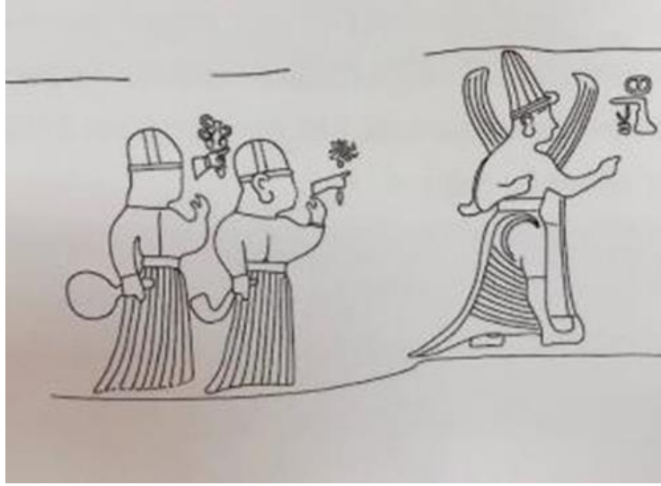
Resim 6: Šauška'nın hizmetkârları Ninatta ve Kulitta'nın alçı kopyası. (Seeher, 2011, s. 59)