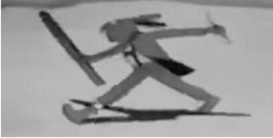
Görsel 1. Eline Sopa Alan Güçlü Tavşan, İdeolojik Propaganda Aracı Olarak İkinci Dünya Savaşı Dönemindeki Çizgi Filmlerim Göstergibilimsel Analizi (Şen, 2020).

kuvvetlerinin saldırısı sonucu tilki öldürülmüş ve çizgi filmde yer alan tavşanlar ve diğer hayvanlar topluluklarının büyük bir tehlike altından kurtarmanın sevincini yaşamışlardır.