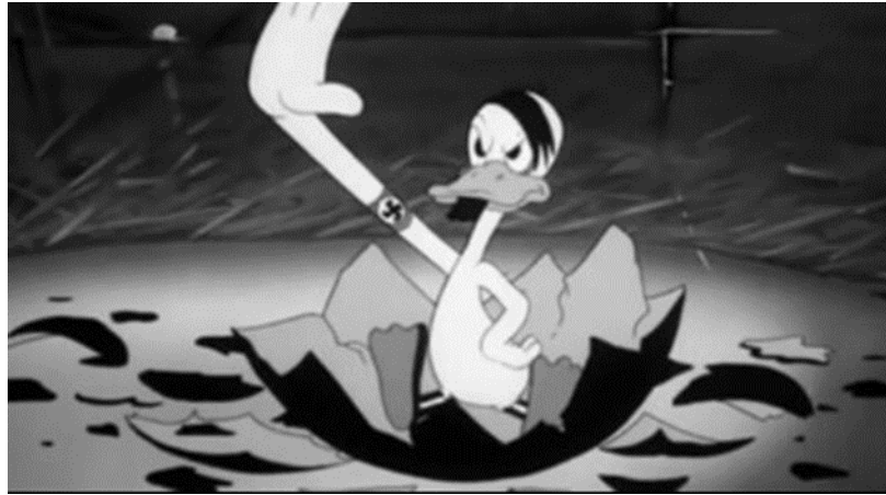
Görsel 4. Yumurtası Siyah Olan Ördek Yavrusu, (URL 3)