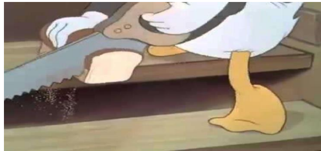
Görel 3. Kesici Alet Kullanan Donald Duck, (URL 2)

Çizgi film Walt Disney tarafından 1943 yılında İngilizce olarak 7 dakika 52 saniyeden oluşarak hazırlanmıştır (Imbd.com, 2020, Akt. Şen, 2020; 125). Çizgi filmin ana kahramanı, çizgi film dünyasının sürekli kullandığı Donald Duck karakteri olmuştur. Film, Nazi bando takımının oluşturduğu propaganda ile başlamıştır. Bir yandan propaganda gerçekleştirilirken bir yandan "Heil Hitler" sloganı atılmış ve Nazilerin "üstün insan" vurgusu yapılmıştır. Bando takımının gösteri sahnesinin ardından Donald Duck'un bulunduğu sahneler gelmiştir. Donald kahvaltısını yapmak üzere gizli bir şekilde kahvesinden az bir şey çıkartıp soğuk suya karıştırarak bir yudum almıştır. Bu arada kahve bu dönem için aranan önemli bir içecek sayılmıştır. Fakat sıcak su dahi bulunamadığından soğuk suya karıştırılarak içilmiştir. Kıtlığı temel alan bu çizgi filmde, Donald sağlıklı besin kaynaklarına herhangi bir gıdaya bile ulaşamadıklarını anlatmak için "domuz pastırması ve yumurta aroması" yazılı bir parfüm şişesinden ağzına bir fıs esans almıştır. Daha sonra kör bir testereyle kestiği bir dilim ekmeğinden bir lokma yemiştir (Resim 3). Kahvaltısını tamamladıktan sonra tüfeğin süngüsü ile Hitler'in "Kavgam" kitabı önüne konularak Donald'ın ideolojik bir düşünceye dalması sağlanmıştır (Akt. Şen, 2020; 126).