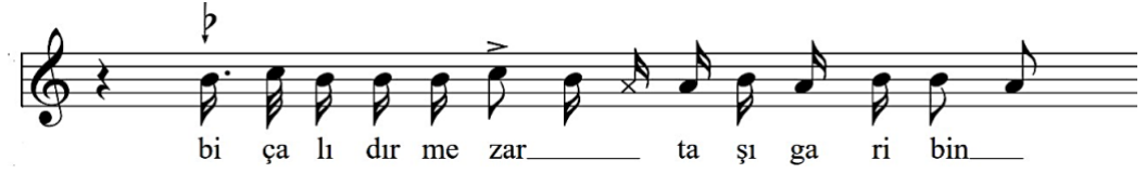
Şekil 10: "Vuruldu Arkadaş" karar perdesine yönelen ilk cümle

Şekil 9'da yer alan a) muhayyer, b) neva, c) uşak ezgi çekirdeği olarak belirtilen üç çekirdeğin birleşimi Tahir makamını duyurmaktadır. Tahir makamına örnek olarak yine aynı bölgenin kadim havalarından "Allı Turnam" türküsü örnek verilebilir. Şekil 7'de belirtilen notada görülebileceği üzere muhayyer ezgi çekirdeği tiz çargâh ve tiz segâh (ortak tanımlayıcı (T)) perdeleri kullanılmadan muhayyer perdesini ısrarla tekrarlamak suretiyle bu duyum elde edilmiş, sonrasında ise neva perdesine yönelen inici hareket sürecinde neva, eve şekil 10'da görülebilecek olan karar perdesine yönelik hareketinde uşak ezgi çekirdeklerini gözlemlemek mümkündür.