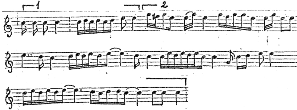
Şekil 5: Cihan Yurtçu'nun Tokat-Ordu Yöresi tipi dilsiz kaval açışı transkripsiyonu 7

Efilo havalarının yer aldığı ve yoğun olarak icra edildiği bölge Ordu'nun yüksek kesimleri ile Tokat, Sivas kesişiminden oluşan, Gümüşhane'ye kadar uzanan Kelkit 6 vadisidir. Bu bölgede yaygın geçim kaynağı özellikle hayvancılık olması sebebiyle, çoban kavalı diye tabir edilen dilsiz kaval bölgede yaygındır. Tokat bölgesinde 1940-1980 yılları arasında yapımcılığı ve icracılığı yaygınlık kazanan ancak bölgede 1980'li yıllardan itibaren yaygınlığı giderek azalmış olan horlatmalı dilli kaval, bir kaval çeşidi olup kendine özgü üflemeli bir çalgıdır. (Aydın, Özkeleş 2021: 1332) Efilo havalarının duyum özelliklerinin hemen hemen tümünü bölgedeki kaval icrasında duymak mümkündür. Etkileşimin vokal icra kaynaklı olduğu, bölgede yer alan atma türkü denilen özellikle kadınlar tarafından yakılan ağıtlarda gözlemlenebilir. Bu bölgedeki Efilo havaları olarak literatüre giren ezgilerin çalgı vokal etkileşiminde kaval-vokal etkileşimini Teke yöresindeki sipsi, vokal etkileşimine benzetmek mümkün olabilir. Dolayısıyla dilsiz kavalın vokal icradan etkilenerek bu stili dilsiz kaval literatürüne aktardığı ileri sürülebilir. Çünkü farklı yörelerde kaval farklı stillerde de icra edilmektedir. Bu bölgedeki özgün vokal icrada vibrato ve glisando hatta bazen kavaldaki hortlatma tekniğini andıran vokal ataklarını gözlemlemek mümkündür.