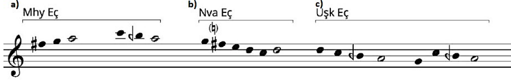
Şekil 9: Tahir Makamını Oluşturan Ezgi Çekirdekleri (Bayraktarkatal, Güray 2021:1020)

Şekil 9'da yer alan a) muhayyer, b) neva, c) uşak ezgi çekirdeği olarak belirtilen üç çekirdeğin birleşimi Tahir makamını duyurmaktadır. Tahir makamına örnek olarak yine aynı bölgenin kadim havalarından "Allı Turnam" türküsü örnek verilebilir. Şekil 7'de belirtilen notada görülebileceği üzere muhayyer ezgi çekirdeği tiz çargâh ve tiz segâh (ortak tanımlayıcı (T)) perdeleri kullanılmadan muhayyer perdesini ısrarla tekrarlamak suretiyle bu duyum elde edilmiş, sonrasında ise neva perdesine yönelen inici hareket sürecinde neva, eve şekil 10'da görülebilecek olan karar perdesine yönelik hareketinde uşak ezgi çekirdeklerini gözlemlemek mümkündür.