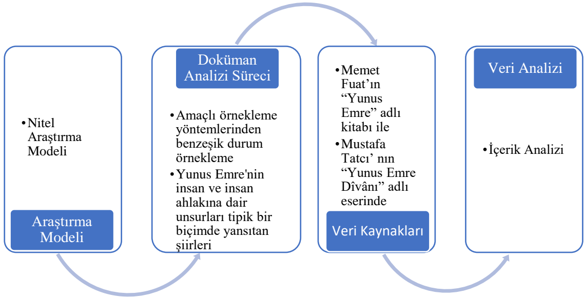
Şekil 1. Araştırma sürecinin şematik olarak gösterimi