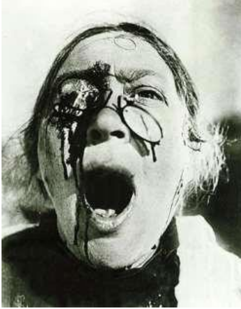
Resim 1. Einstein'ın Portemken zırhlısı (1925) katli "

bu fotoğrafları kendi resimlerinin imgelerine dönüştürmüştür. Einstein'ın Portemken zırhlısı adlı filmde yer alan hemşirenin çığlığını gösteren fotoğraf (Resim 1) ve Nicolas Poussin'nin "Masumların katli" adlı resimdeki korkudan çığlık atan kadın figüründen etkilendiğini söylemiştir (Resim 2).