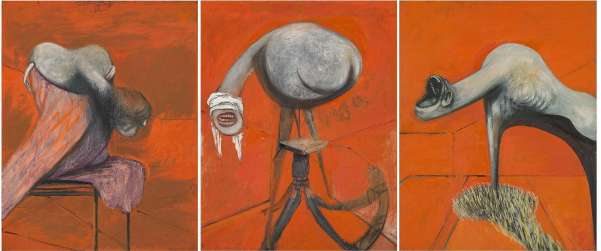
Resim 4. Three Studies for Figures at the Base of a Crucifixion 1944

Savaşın son yıllarında yaptığı bu üçlemesinde Bacon, George Bataille nin yazılarından etkilenmiştir. Bataille yukarıdaki yazısında söylediği gibi, çoğu durumlarda insan yaşamı hayvani bir şekilde ağızda yoğunlaştırılmıştır. Bacon'ın resimlerinde görünen imajları Bataille'nin yazılarıyla paralellik gösterir. "Önce bir figürün özellikleri arasında sadece ağzın varlığı, ikinci olarak Bataille'nin örnek olarak verdiği uzun boynun garip hayvansal uzanımı, üçüncü olarak da insan ve hayvanın paylaştığı özellikler üzerine kurulmuş olması" (Ades, Forge. 1985).