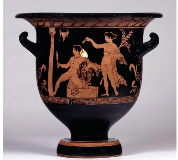
Resim 6. The Eumenides (Yunan Vazo Resimleri)