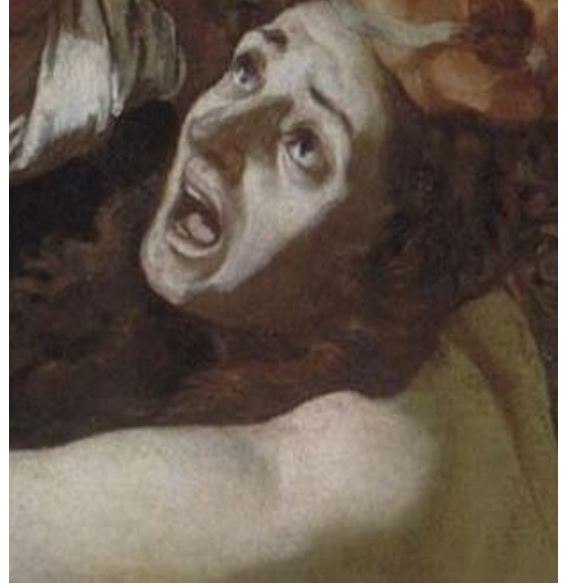
Resim 2. Nicolas Poussin "Masumların katli "

Bu fotoğraflar aslında Bacon için yaşadığı dönemin vahşetini yansıtan kaynaklardı. İnsanın doğasında var olan şiddetin yıkıcılığın ve acımasızlığın kanıtlarıdır. Bacon bunları insanın içindeki şiddeti yansıtan kanıtlar olarak görmez. Bacon şöyle demektedir "Belki de her zaman şiddet biçimleriyle yaşamaya alışkın olduğumu söyleyebilirim; bu, kişiyi etkileyebilir ya da etkilemeyebilir, ama muhtemelen öyle olduğunu düşünüyorum. Ama hayatımdaki bu şiddet, bence resimlerdeki şiddetten farklı. Boyanın şiddetinden bahsederken savaşın şiddetiyle hiçbir alakası yok....." Bir çığlıkla doğarız; bir çığlıkla hayata geliriz ve belki aşk, yaşama korkusu ile ölüm korkusu arasında bir cebinlik. " (Sylvester, 1999). Bacon bunları söylerken içinde yaşadığı toplumun acımasızlığından yaşadığı şiddetin yansımalarını da ifade ediyordu. Aslında Bacon'ın resimlerinde acı çeken kişi yalnızca kendisi değildir. O resimlerinde bekli de kendi üzerinden toplumdaki şiddeti acımasızlığı anlatmak istiyordu.