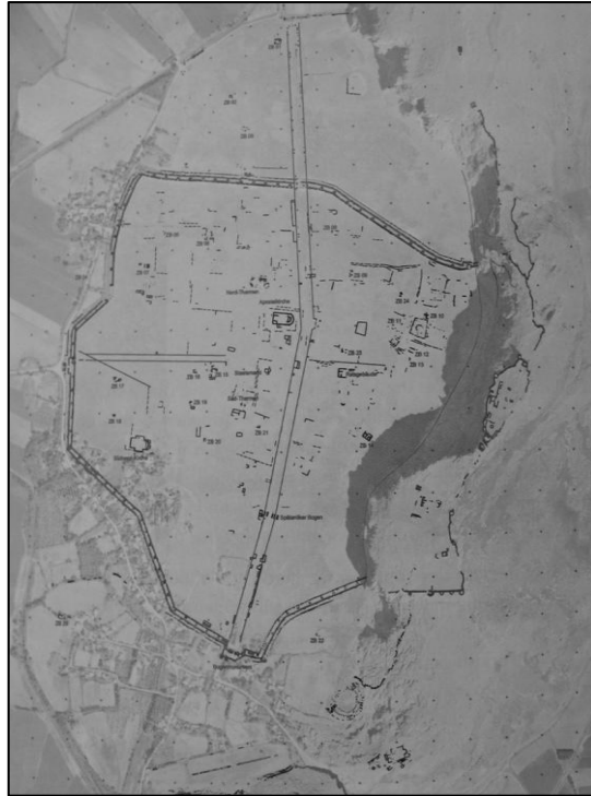
Şekil 2: Anazarbos kent planı (De Giorgi, 2011, s.126, fig. 3)