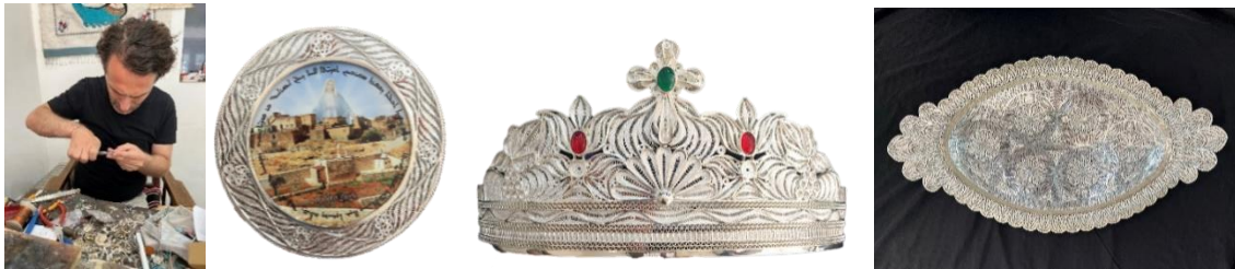
Görsel 139. Engin Gürkan çalışırken, Görsel 140. Fotoğraf çerçevesi, Görsel 141. Kadın tacı, Görsel 142. Tepsi

Engin Gürkan ; 1980 yılında Midyat'ta doğmuştur. Usta, 1996 senesinde Yakup Tok adlı bir ustanın yanında gümüş telkâri sanatına başlamıştır. 1996 yılından 2018'e kadar çeşitli yerlerde bu alanda kurslar veren usta, 2018 yılında "Engin Design" adlı bir atölye kurarak burada kişiyeye özel tasarımları ürüne dönüştürmektedir. Engin Gürkan, Artuklu ilçesinde gümüş telkâri sanatı ile uğraşan Aday Gürkan'ın abisidir. Usta, aynı zamanda bu atölyede yaptığı çeşitli türdeki ürünlerin satışlarını da gerçekleştirmektedir (Sözlü Görüşme, 15.06. 2023, Görsel 139-142).