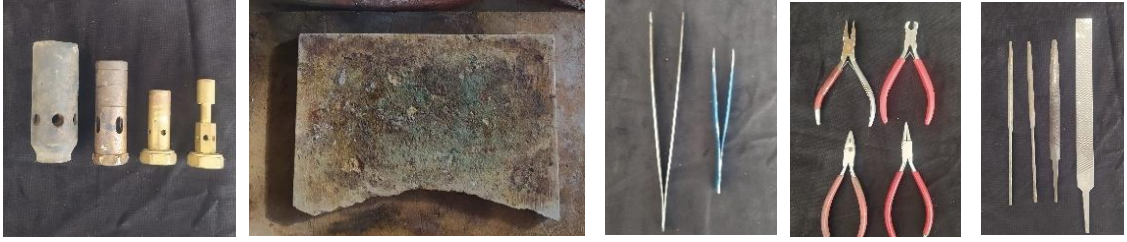
Görsel 6. Şalimo başlıkları, Görsel 7. Amyant, Görsel 8. Çiftler, Görsel 9. Penseler, Görsel 10. Eğeler (Artuklu Halk Eğitim Merkezi Telkâri Atölyesi)