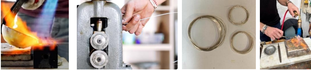
Görsel 26. Eritilen gümüşün şideye dökülmesi, Görsel 27. Haddeden geçirilen gümüşün inceltilmesi, Görsel 28. Haddeden geçirilmiş çubuğun tel hali, Görsel 29. Tel haline getirilen gümüşün tavlanması (Aday Gürkan Telkâri Atölyesi)

Telkârden bir ürün yapılırken ilk olarak iskelet ve dolgu telleri hazırlanmaktadır. İstanbul'dan hammadde olarak gümüşü aldıklarını belirten Aday Gürkan, yapılacak ürün için 1000 gr gümüşe 25 gr bakır ilave ettikleri zaman 975 ayar, 50 gr bakır ilave olduğunda ise 950 ayar gümüş elde ettiklerini söylemiştir (Kaynak Kişi, Aday Gürkan, Sözlü Görüşme, 02.11. 2023, Görsel 26-29). Görüşülen ustaların büyük bir bölümü üretimde gümüşü 950 ayarda kullanmaktadır. Ele alınan tokenın yapımında iskelet teli 90 mikron, iç dolgu yani işleme teli ise 25 mikrondur. Midyatlı ustalar telin haddelerden geçirilip 22 mikrona kadar inceltilebileceğini söylemektedirler.