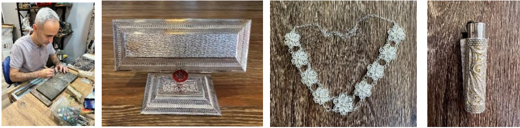
Görsel 135. Adnan Dilmeç çalışırken, Görsel 136. Masaüstü isimlik, Görsel 137. Kolye, Görsel 138. Çakmak kılıfı

Adnan Dilmeç ; 1979 doğumludur. Kendisi gümüş telkâri sanatını 13 yaşlarında babası Aziz Dilmeç'ten öğrenmiştir. Adnan Dilmeç, 1996-2002 yılları arasında altın işleme ile de uğraşmıştır. Şu an "Midyat Bazaar" adlı mağaza / atölyesinde gümüş telkâri üzerine üretim yapan usta, bu atölyenin 1980'den bu yana aktif olarak üretim yaptığını dile getirmektedir. Gümüş telkâri alanında geleneksel üretim yanında döküm işleriyle de uğraşmaktadır. Adnan Dilmeç günümüzde aynı zamanda Midyat Aile Destek Merkezi'nde usta öğreticilik yaparak yeni ustalar yetiştirmektedir (Sözlü Görüşme, 20.06. 2023, Görsel, 135-138).