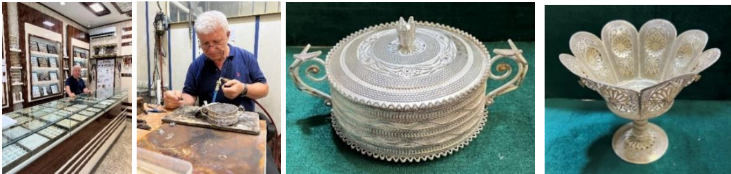
Görsel 115. Ergin Kuyumculuk Mağaza / Atölye, Görsel 116. Nuri Ergin çalışırken. Görsel 117. Şekerlik, Görsel 118. Şekerlik

Nuri Ergin ; 1976 yılında Midyatta doğmuştur. Gümüş telkâri sanatını diğer ustalar gibi 7-8 yaşlarında babası İsa Ergin'in yanında başlamıştır. Zaman içerisinde ustalaşarak tek başına üretim yapmaya başlayan Nuri Usta, yaklaşık olarak 40 senedir aktif olan Ergin Kuyumculuk adlı bir mağaza-atölyede gümüş telkâri alanında ürün yapmaktadır ve bunların satışlarını gerçekleştirmektedir (Sözlü Görüşme, 10.06. 2023, Görsel, 115-118).