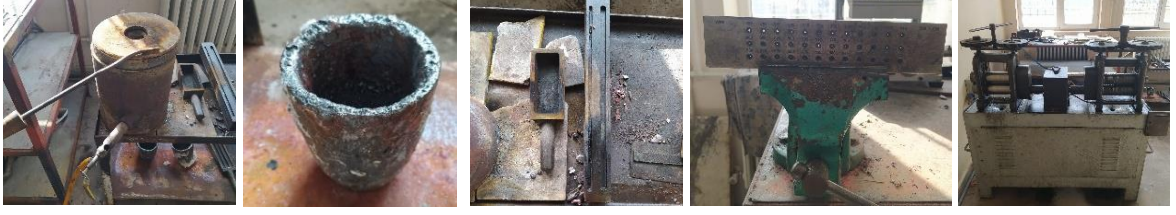
Görsel 1. Eritme ocağı, Görsel 2. Eritme potası, Görsel 3. Astar dökme kalıbı, Görsel 4. Hadde, Görsel 5. Silindir makinesi (Artuklu Halk Eğitim Merkezi Telkâri Atölyesi)

tel fırça, kumlama fırçası, haştek takımı, yüzük ölçü halkası gibi araçlar üretim yapılırken kullanılmaktadır (Görsel, 1-25). (Kaynak Kişi, Aday Gürkan, Sözlü Görüşme, 02.11. 2023).