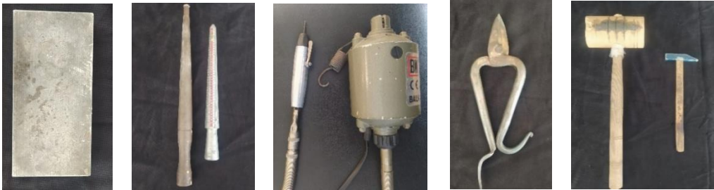
Görsel 16. Örs, Görsel 17. Demir ve yüzük malafası, Görsel 18. Freze ve başlığı, Görsel 19. Antep makas, Görsel 20. Çekiç ve tokmak (Artuklu Halk Eğitim Merkezi Telkâri Atölyesi)