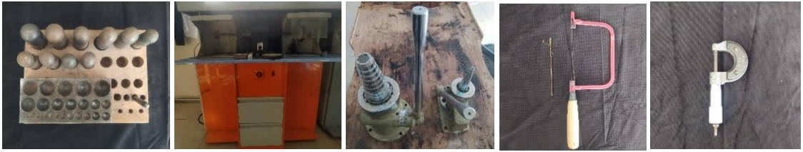
Görsel 11., Haştek takımı, Görsel 12. Cila makinesi, Görsel 13. Bilezik ve yüzük malafaları, Görsel 14. Kıl testereler, Görsel 15. Mikrometre (Artuklu Halk Eğitim Merkezi Telkâri Atölyesi)