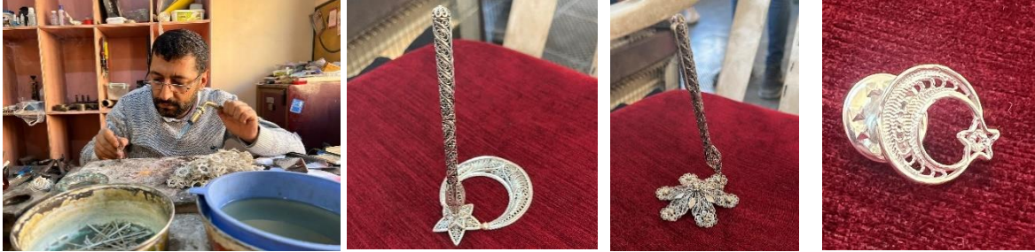
Görsel 69. Nusreddin Budak çalışırken, Görsel 70. Ay Yıldız kaideli kalemlik, Görsel 71. Yıldız kaideli kalemlik, Görsel 72. Ay Yıldız broş

Nusreddin Budak ; 1983 yılında Artuklu'da dünyaya gelmiştir. Kendisi bu sanata 10 yaşlarında Suphi Hindiye'li ve Yılmaz Küçükbaşlan adlı ustaların yanında başlamıştır. Zaman içerisinde ustalaşarak farklı işlevlerde kullanılmak suretiyle ürünler yapmaya başlayan usta, günümüzde Tuana adlı atölyesinde sipariş üzerine çalışmaktadır. Bu alanda yaklaşık olarak 7-8 usta yetiştirdiğini söyleyen Nusreddin Usta, geleneksel yöntemlerle gümüş telkâri ürün yapımının yanında dökümden de eser üretimleri yapmaktadır (Sözlü Görüşme, 17.02. 2023, Görsel 69-72).