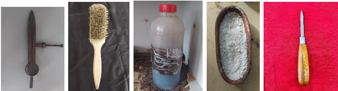
Görsel 21. Pergel, Görsel 22. Tel fırça, Görsel 23. Siyanür, Görsel 24. Boraks. Görsel 25. Kalem (Maskal) (Artuklu Halk Eğitim Merkezi Telkâri Atölyesi)