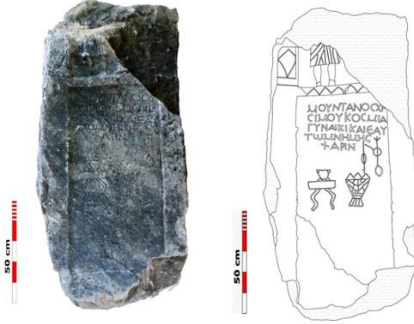
Şekil 7. Çeşmelisebil'den mezar steli (Abay, 2022: 456-457, 464; Şekil 3)

ve sabanı temizlemek için düz bir kazıyıcıya da rastlanmaktadır (Wealkens, 1977: 283). Bunların dışında ya bir arada ya da ayrı ayrı tasvir edilmiş olan boyunduruk, pulluk ya da sabana çok sayıda mezar stelinde rastlanmaktadır (Calder, 1928: 156 No. 293; Calder, 1956: 7 No. 33, 60 No. 271, 92 No. 406, 95 No. 420, 104-108 No. 480, 495, 498, 505, 110 No. 520).