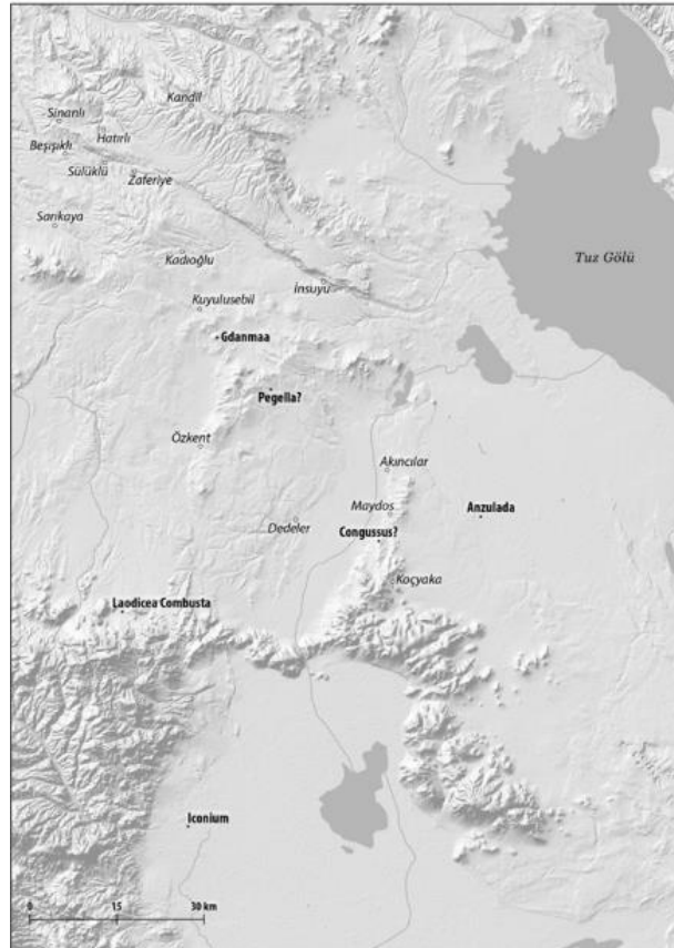
Şekil 3 . Doğu Axylon Bölgesi Yerleşimleri (Breytenbach – Zimmerman, 2018: 339; Şekil 11)