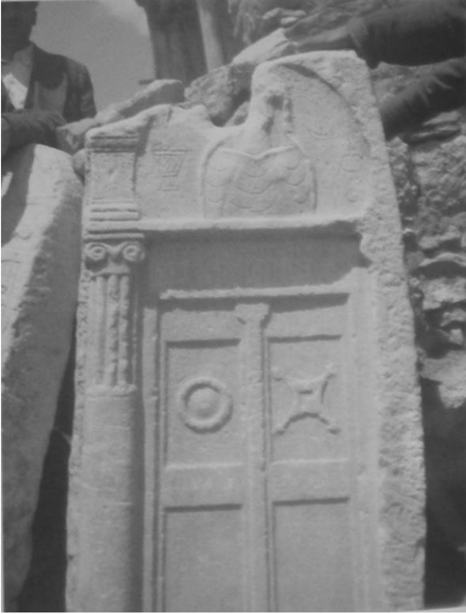
Foto 2. Çeşmelisebil'den kapı betimli, üzerinde çiftçiliğe dair tasvirlerin yer aldığı mezar steli (Thonemann, 2013: 194;Foto 205).

Öte yandan bölgedeki inanç yapısıyla zirai faaliyetler arasında da bir ilişkinin varlığı ve çiftçiliğin inanç yapısını etkileyen temel unsurlardan birisi olduğu da anlaşılmaktadır. Mezar stelleri üzerindeki tasvirlerden ve yazıtlardan bölgede Zeus Bronton'un yaygın tapınım gördüğü kanıtlanmaktadır. Çünkü söz konusu tanrının çiftçiliğin yaygın olduğu, temel geçim kaynakları ziraat olan toplumlarda daha çok tapının gördüğü bilinmektedir (Akyürek Şahin, 2001: 167; Chiai, 2020: 261-264). Nitekim bölgede bu tanrının bucranium , boyunduruk, çelenk ve buğday demetiyle birlikte tasvir edildiğini gösteren mezar stelleri belgelenmiştir (Ramsay, 1918: 182 No. 24; Robert, 1955: 108 Lev. XLIV; Şahin, 2001: 18, 39). Kadınhanı yakınlarındaki Meydanlı'dan bir mezar stelinde Zeus büstü, üzüm salkımıyla birlikte görülmektedir (Ramsay, 1918: 135 No. 2 dn. 11). Aynı şekilde yine bu çevrede bulunan Şarören'den ele geçmiş mezar stelinde ise Zeus büstüyle beraber buğday başağı, mısır koçanı ve üzüm salkımı tasvir edilmiştir (Calder, 1928: 4 No. 5).