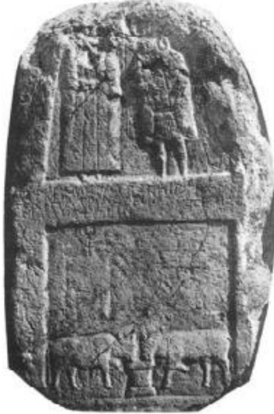
Foto 5. Vetissos'tan bir kaptan su içen iki öküz tasvirine yer verilen mezar steli (Calder, 1956: 106 No. 495)

Gerek ikliminin uygun olmasından ve gerekse bugün de büyükbaş hayvan yetiştiriciliğinin yaygınlığından hareketle Antik Dönemde de Axylon Bölgesi'nde sığır yetiştirildiği sonucuna ulaşılabilir. Nitekim bölge sakinlerinin en eski çağlardan yakın zaman kadar odun yerine tezek yakıyor olmaları, bu bağlamda değerlendirilmelidir. Öte yandan bölgedeki mezar taşları üzerinde sıkça bucranium tasvirlerine rastlanması (Calder, 1928: 156 No. 293; Calder, 1956: 52, 54, 56, 61, 76, 80-81, 103; No. 244, 253, 259, 276c, 311, 335-336, 476) ve daha önce söz edilen çift sürme sahnelerindeki öküzlerin dışında Vetissos'taki Kerpiçli'de bulunan bir mezar taşı üzerinde, bir kaptan su içen iki öküz tasviri de sığır yetiştirildiğinin kanıtı olarak gösterilebilir (Calder, 1956: 94 No. 417) [Foto 5]. Ancak koyunların aksine sığır yetiştirmede öncelik bu hayvanların gücünden faydalanmak olup et ikinci planda gelmekteydi (Wealkens, 1977: 284). Ayrıca Strabon, bölgede yabani eşeklerin varlığında söz etmektedir (Strabon, XII. 6.1). Bu durumda muhtemelen taşımacılıkta kullanılan bir diğer hayvan ise eşek olmalıydı (Kaya, 2011: 293).