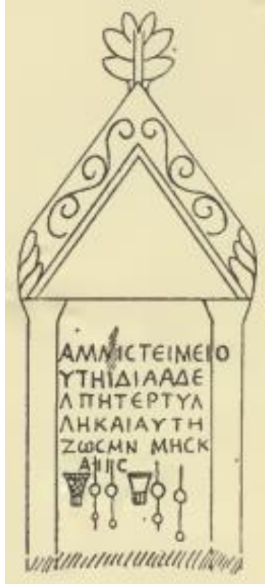
Şekil 5: Sarayönü'nden mezar steli (Ramsay, 1906: 69; Şekil 37).