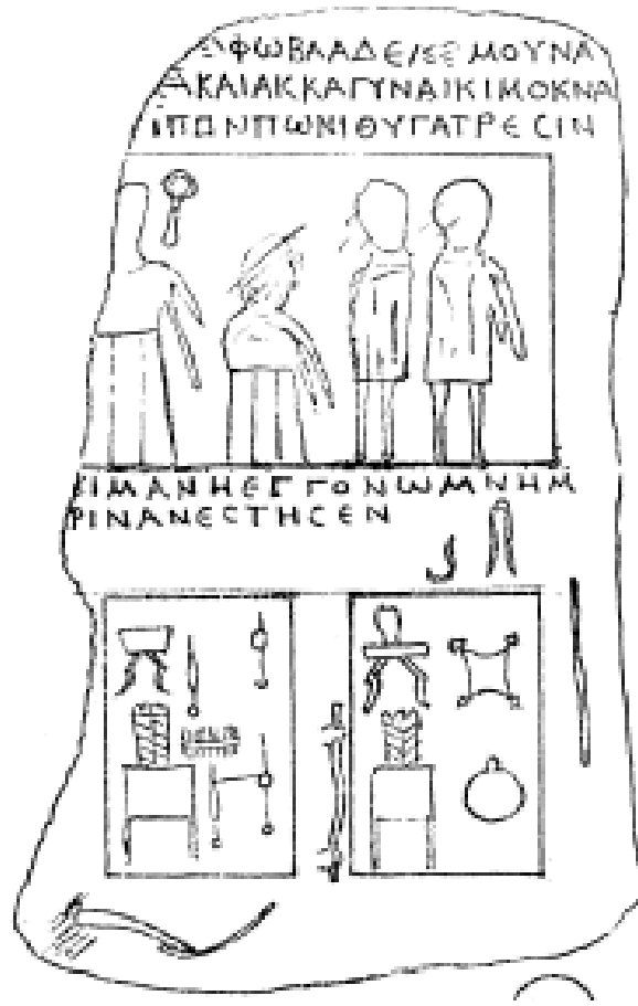
Şekil 4. Kötüşak'tan günlük hayatla ilgili çok sayıda eşyanın tasvir edildiği mezar steli (Calder, 1956: 104; Şekil 481).

mezarlarda kullanılmıştır(Duman, 2019: 38) 12 . Bununla birlikte Vetissos sınırları içerisindeki Bögrüdelik yerleşiminden bir mezar stelinde olduğu gibi az da olsa kadınlara ait mezarlarda da kağıt rulosuna rastlanmaktadır (Calder, 1956: 110 No. 518). Daha önce de belirtildiği gibi Axylon Bölgesi'nde kentler olmayıp köy yerleşimleri vardı. Böyle bir durumdan bölge insanlarının tamamen eğitimsiz insanlar olduğu sonucu çıkarılmamalıdır. Zira Zıvarık, Çeşmelisebil, Koçaş, Zengen başta olmak üzere Axylon Bölgesi köylerinden çok sayıda şairin ve mezar şiirinin varlığı tespit edilmiştir (Thonemann, 2014; Breytenbach ve Zimmermann 2018: 324). Bununla birlikte okur yazarlık simgesi olan sembollerin ekseriyetle erkek mezarlarında bulunması, erkeklerde kadınlara oranla okur yazarlık oranının daha yüksek olduğunu kanıtlamaktadır. Bölgedeki erkeklere ait mezar taşlarında aynı zamanda onların mesleklerini de gösteren araç gereçler olarak balta, çekiç, kerpeten, bıçak, keski, kazma, kürek, orak sembolleri de sıklıkla görülmektedir 13 . Ayaklık, tabure, masa, vazo, mangal, sürahi, çömlek, amphora, tava ve tencere gibi ev eşyalarına ise hem erkek hem de kadın mezarlarında rastlanılmaktadır 14 .