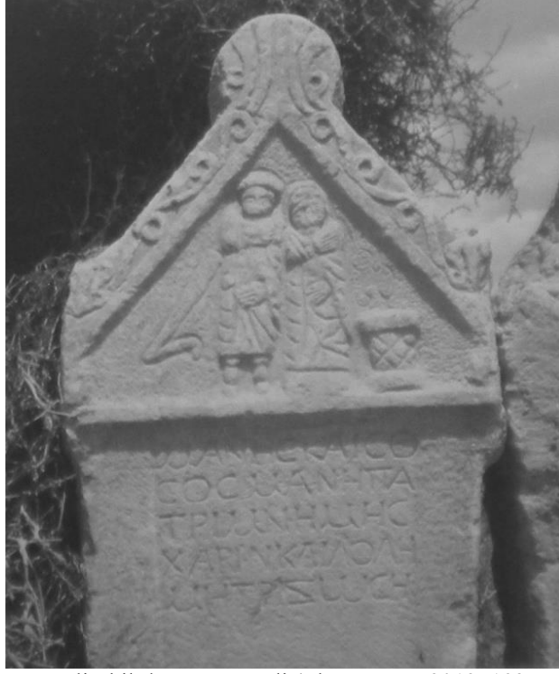
Foto 3. Çeşmelisebil'den mezar steli (Thonemann, 2013: 193; Foto 204).

Bölge mezar stelleri üzerinde yer alan alet ve eşyalar, Axylon'da tahıl ekimi ve hayvancılığın bir arada yapıldığını göstermektedir (Trombley, 1995: 102). Bölge eski çağlarda sığır yetiştiriciliği ve diğer tarımsal faaliyetler için yeterli bitki örtüsüne sahipti. Bugün olduğu gibi ovalık alanlar tahıl ekimi ve hayvan otlatmak için kullanılırken, nispeten dağlık sahalar ise bağcılığın yapıldığı yerlerdi. Ekonomik durumun tarım ve hayvancılığa dayanması durumu, tahılın eyaleti ayakta tuttuğu yünün ise ona zenginlik getirdiği şekilde özetlenmektedir (Mitchell, 1993: 146, 148).