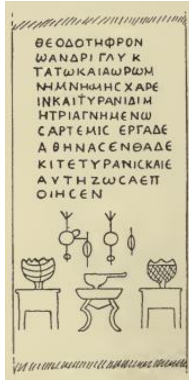
Şekil 6. Sinanlı'dan günlük eşyaların betimlendiği mezar steli (Ramsay, 1906: 70; Şekil 38).