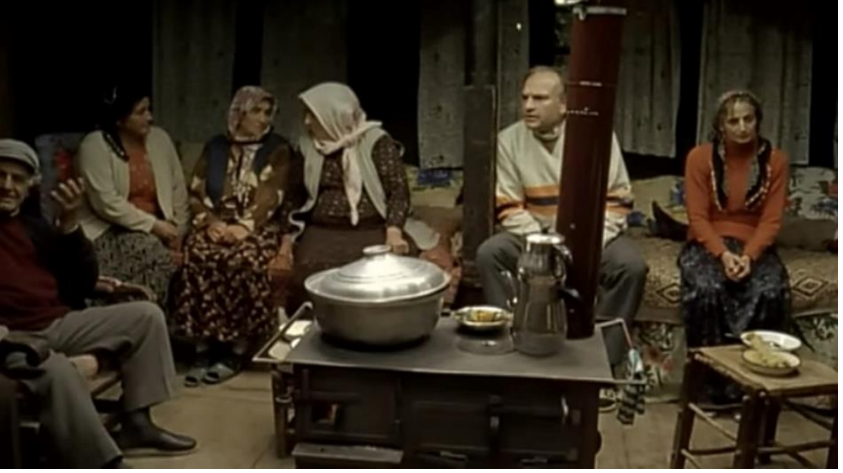
5. Karadeniz'in geleneksel evlerinde sosyal hayattan bir kare.