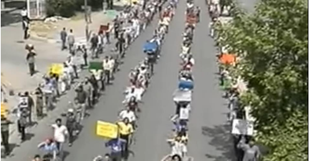
2. 1990'lı yıllarından öğrenci hareketlerini gösteren arşiv kayıtlarından bir görüntü.