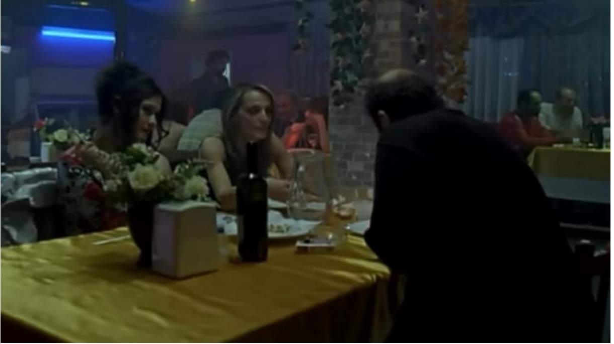
10. Gürcistan göç etmek zorunda kalan kadınların pavyonlarda çalışmalarını yansıtan bir kare.