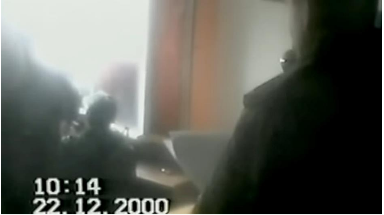
1. Hayata Dönüş Operasyonu'na ilişkin filmin ilk sahnelerinde yer alan Arşiv kaydından bir görüntü