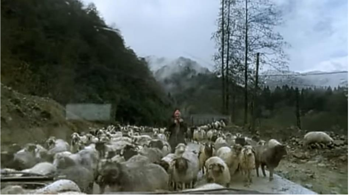
9. Karadeniz Bölgesindeki bir diğer geçim kaynağı olarak hayvancılık.