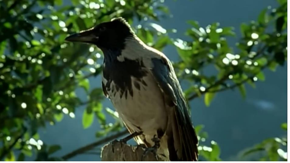
11. Filmde bir ölüm imgesi olarak kullanılan bölgede yaşayan Alakarga.