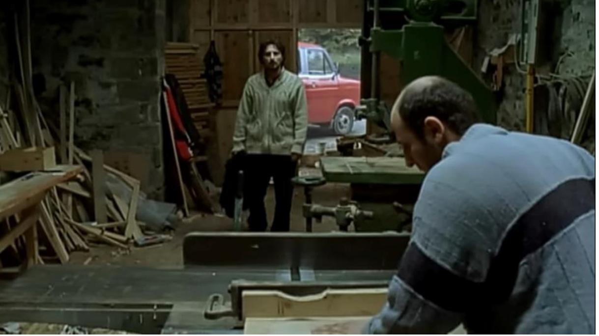
8. Karadeniz Bölgesinde geçim kaynaklarından bir örnek olarak marangozluk mesleği.