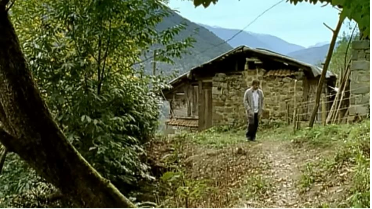
6. Geleneksel Karadeniz evinin yapısal özelliklerinin rahatlıkla gözlenebildiği bir kare.