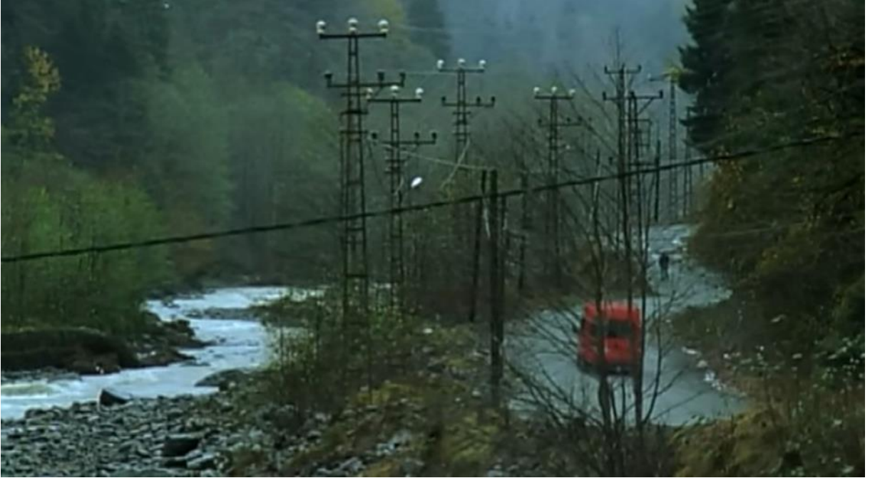
4. Filmde sıklıkla gördüğümüz Karadeniz'in fiziki ve iklim özelliklerini yansıtan bir görüntü.