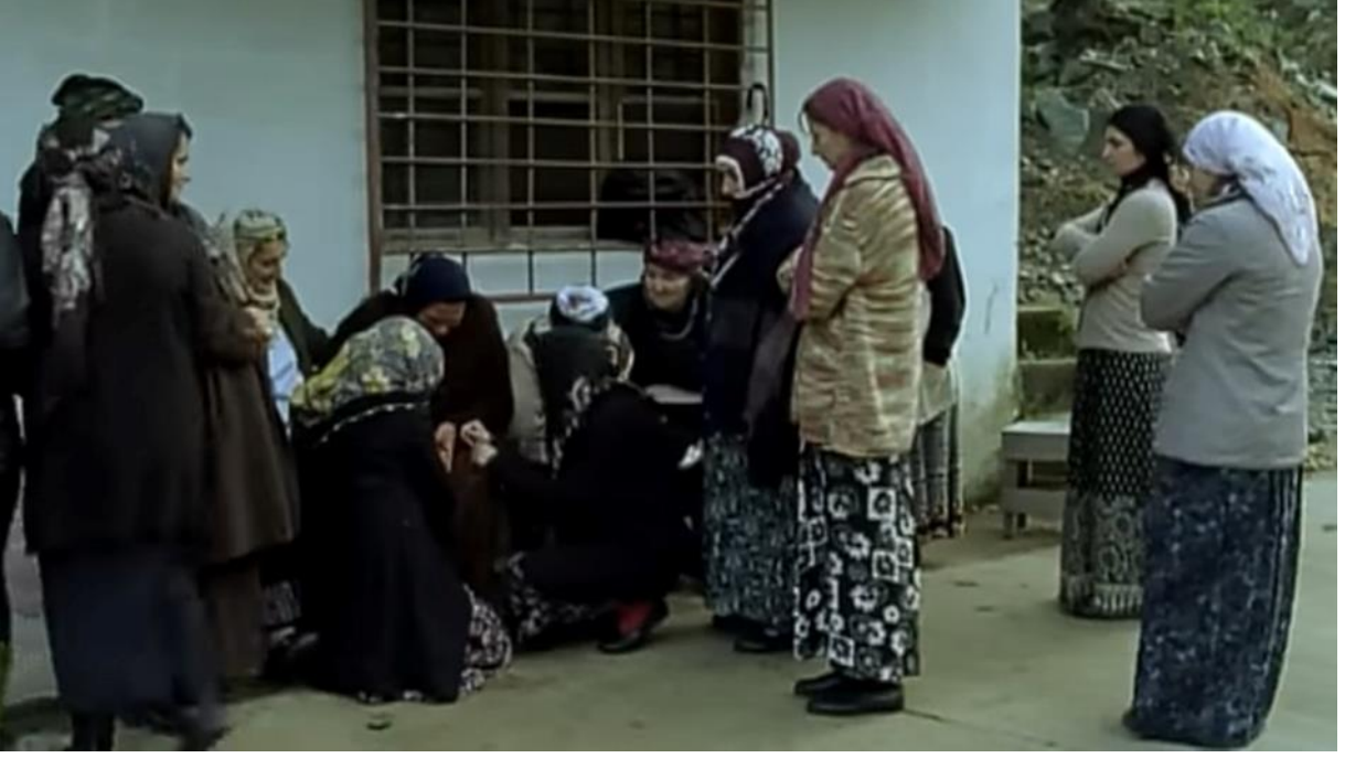
7. Karadeniz Bölgesi'nde cenaze geleneklerinin bir parçası olan kadınların ağıt yakma sahnesi.