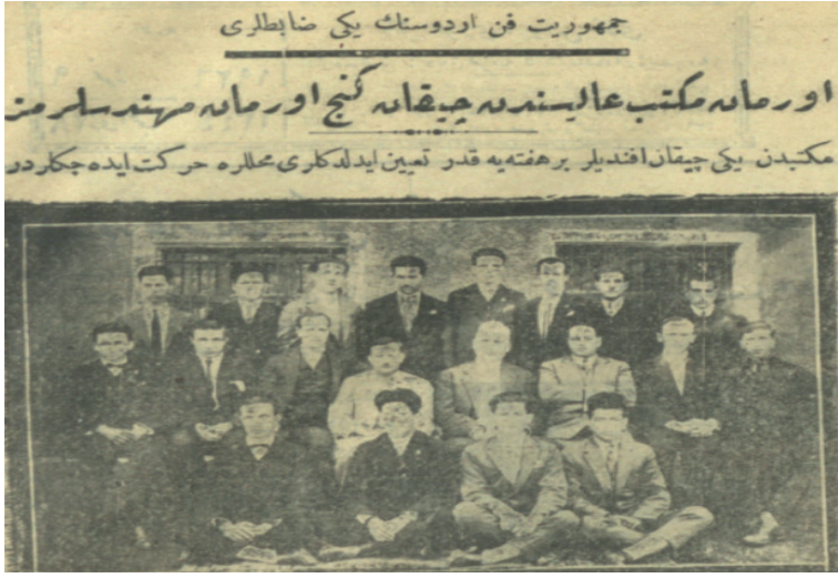
Resim 7. Cumhuriyet Fen Ordusunun Yeni Zabıtları, Orman Mekteb-i Âlisi'nden Çıkan Genç Orman Mühendislerimiz ("Cumhuriyet Fen Ordusunun Yeni Zabıtları", Cumhuriyet , 9 Temmuz 1926, No: 777, 2.)

1925 yılında Tarım Bakanlığı tarafından Türkiye'de teknik danışman olarak Fransız orman mühendisi Paul Joseph Saby 89 istihdam edilmiştir. Saby, Belgrad Ormanı hakkında oldukça detaylı raporlar hazırlayarak bölgede yapılacak işler hakkında da önemli önerilerde bulunmuştur. 90 Saby, özellikle 28 Ekim 1925, 3 Mart 1926 ve 15, 16 Haziran 1926'da hazırladığı raporlarında Orman Mekteb-i Âlisine yönelik birçok değerlendirme ve eleştiride bulunmuştur. O'na göre Orman Mekteb-i Âlisinde acilen ıslahat gerçekleştirilmeliydi. Saby'nin raporlarında Orman Mekteb-i Âlisine yönelik üzerinde önemle durduğu noktalar şu şekilde ifade edilebilir: 91