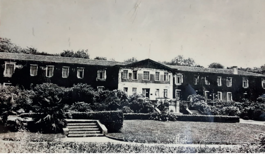
Resim 1. Eski Süvari Kışlasından Dönüştürülen Bahçeköy Orman Mekteb-i Âlisi Binası

Mektep eğitim-öğretim faaliyetlerine başlamasına rağmen tadilat işleri Şubat 1912'ye kadar devam etmiştir. Binaya yapılan tadilat ve genişletme işlemleri oldukça kapsamlı olduğundan 300.000 kuruşluk ödenek yeterli gelmemiştir. Orman ve Ma'âdin ve Ziraat Nâzırı Mavrokardato Paşa zaman zaman tadilatı teftiş etmek amacıyla bölgeye gitmiştir. 25 Tadilat sürerken Orman Mekteb-i Âlisi eğitime Kumkapı'da zor koşullar altında devam etmiştir. Dağavaryan Efendi konuyla ilgili "Bizim Kumkapı'da mektep gibi bir şey açmışınız" ifadesiyle mektebin hem eğitim kadrosu hem de bulunduğu şartların yetersizliğine dikkat çekmiştir. 26