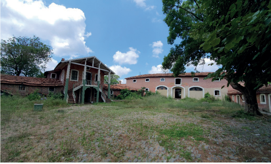
Resim 3. Abraham Paşa Çiftliği

Dahiliye Nezareti mektebin tekrar kendi binasına dönebilmesi için Hariciye Nezareti ile yazışmalar yürütmüştür. Zaten kısa süre içerisinde Rumların mektep binasında kalmak gibi niyetlerinin olmadığını birçoğunun mektepte ikamet etmedikleri, sadece işgal etmek amacıyla hareket ettikleri anlaşılmıştır. 69