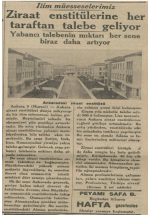
Resim 11. (Akşam, 7 Teşrinisani 1934, No 5767, 1.)

Ankara Yüksek Ziraat Enstitüsüne bağlanan Orman Fakültesinde eğitim süresi 4 yıla çıkarılarak mektebe kabul ve kayıt şartlarında da bazı düzenlemeler yapılmıştır. Mektep eğitiminin 2 senesi İstanbul'daki binasında 2 senesinin ise Ankara Yüksek Ziraat Enstitüsünde yapılması kararlaştırılmıştır. Ayrıca fakülte için Almanya'dan yabancı profesörler getirileceği ifade edilmiştir. Yüksek Orman Mektebine bağlı olan Orman Ameliyat Mektebi de lağvedilerek Orta Orman Mektebi açılmıştır. 129 Böylelikle 1909 yılında müstakil bir mektep olarak kurulan Orman Mektebi-âlisi (Yüksek Orman Mektebi) 1934 yılına kadar 152 mezun verdikten sonra lağvedilmiştir. 130