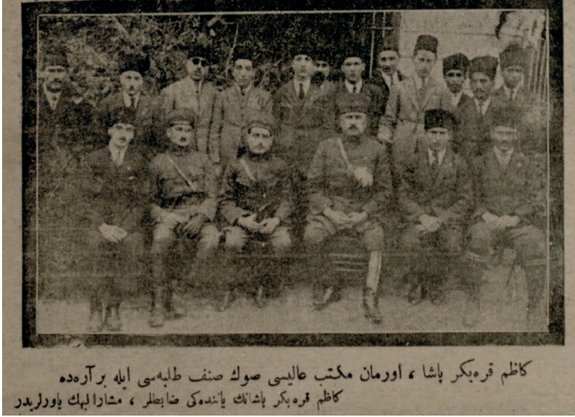
Resim 5. Kazım Karabekir Paşa, Orman Mekteb-i Âlisi Son Sınıf Talebesi İle Bir Arada, Kazım Karabekir Paşa'nın Yanındaki Zabıtlar, Müşarünileyhin Yaverleridir ("Kazım Karabekir Paşa Orman Mekteb-i Âlisinde", Tevhid-i Efkâr , 16 Teşrinisani 1339 (16 Kasım 1923), No: 860-3888, 2.)

Orman Mekteb-i Âlisi'nin Ayas Ağa Çiftliğine nakledilmesi düşünülmüşse de o tarihlerde henüz Halife olan Abdülmecid Efendi çiftliğin babası (Sultan Abdülaziz) tarafından inşa edildiğini ve burada ikamet etmeyi düşündüğünü ifade ettiğinden bir sonuç elde edilememiştir. 84 Halifeliğin kaldırılmasının ardından 19 Mayıs 1924'de konu tekrar gündeme geldiyse de Zincirlikuyu'daki köşkerin Dârüleytâm'a tahsis edildiği ayrıca Ayas Ağa Çiftliğinin de mektebe elverişli olmadığına yönelik bir kararname çıkarılmıştır. 85 Bu nedenle bir süre sonra mektep eskiden olduğu Bahçeköy'deki binasına taşınmıştır.