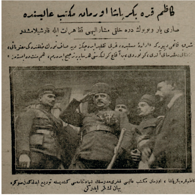
Resim 4. Kazım Karabekir Paşa, Orman Mekteb-i Âlisi Fahri Müderrislik Şahadetnamesi Kendisine Tevdi Edildikten Sonra Beyan-ı Teşekkür Ederken. (“Kazım Karabekir Paşa Orman Mekteb-i Âlisi’nde”, Tevhid-i Efkâr , 16 Teşrinisani 1339 (16 Kasım 1923), No: 860-3888, 2.)