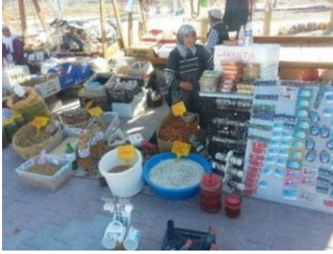
Fig. 3. Yöresel ürün satan kadınlar

Abam köy ürünlerini satıyoruz. Cevizimiz, fasulyemiz, iğdemiz, nar ekşimiz, erik sirkesi, havuç sirkesi, badem, ceviz, incir. Bak bir yanda sarımsağımız var. Mısırmız, nohutumuz, eriğımız var. Yok yok yani, hepsi var. Hep köy ürünü bunlar. Daha salçalarımız var, elle örülmüş şeylerimiz var. Ceviz ezemelerimiz, incirlerimiz var. İthal hiçbir şeyimiz yok, hep yerli. ...Marmelat da satıyorum, dolu, 50-100 kadar var evimde. Kirazım, vişnem, kayısı kompostolarım dolu evde. Reçellerim var, incir reçelim var, erik reçelim var. ...Üç senedir buradayız. Kaymakamlık Valilik açtı burayı (pazar satış yerini). Memnunuz (buradan). Allah da razı olsun onlardan... (K1).