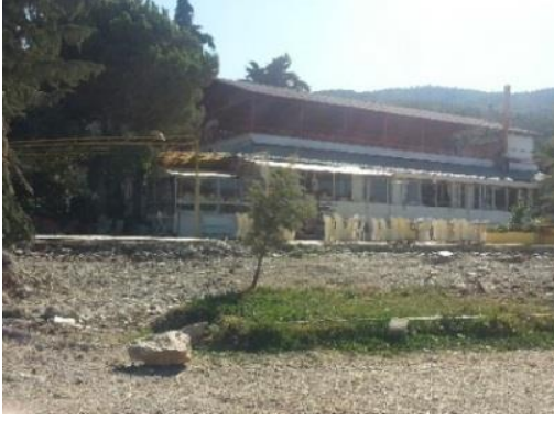
Fig. 9. Göl kenarında Belediye işletmesi