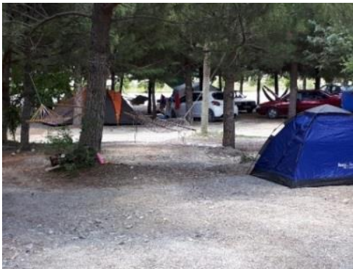
Fig. 11. Göl kenarındaki kamp alanları

Şu an yavaşladı. Ama yazın inanılmaz kalabalık. İşlerimiz şu an çok iyi değil. Günübürlükçiler geliyor çünkü. Pek fazla kalan olmuyor. Çünkü yatak yok, kalacak yer yok. ...Salda gölünün çevre köylere ekonomik anlamda şu an bir katkısı yok. Günübürlük gelip gidiyorlar. Çünkü haklılar vatandaşlar. Şu an ben gelsem ben de kalmam burda. Sosyal faaliyet geçirebileceğim bir yer yok (K9).