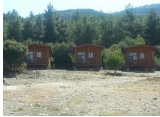
Fig. 14. Göl kenarındaki bungalov evler (Ceylan)

Salda Köyü içerisinde apart ve pansiyon tarzı işletmeler bulunmaktadır. Köyde yaklaşık 200 yatak kapasitesine ulaşan bu işletmelerin bir kısmının, ÖÇK Bölgesi içerisinde kalmasından dolayı, henüz işletme ruhsatı alamadığı görülmektedir: