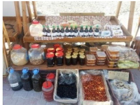
Fig. 6. Satılan yöresel turistik ürünler