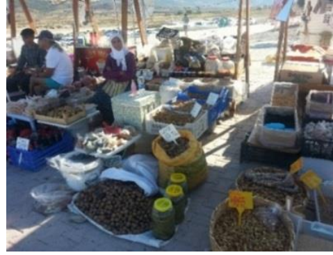
Fig. 4. Yöresel ürün satan yerel halk

Salda Köyü'nden göl kenarında oluşturulan pazar alanına gelen yaklaşık 25 kişinin olduğu, ancak pazar alanının dar olması nedeniyle hafta sonlarında kendi ürününü satacak yer bulamayan kişilerin olduğu belirlenmiştir: