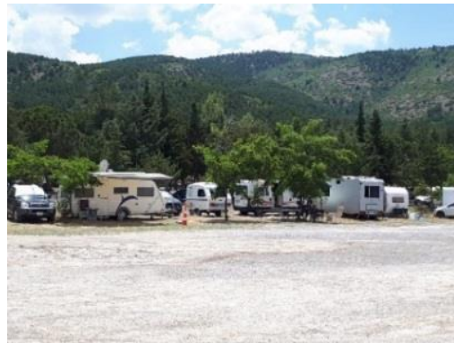
Fig. 12. Göl kenarındaki karavan alanları (Ceylan)