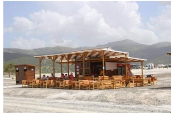
Fig. 8. Kaymakamlık tarafından işletilen işletmeler

Önceki yıllarda konteynır ve çadırlardan çay ve gözleme gibi yiyecek ve içecekler ziyaretçilerin yanına kadar götürülüp servis edildiği, ancak Kaymakamlık işletmelerinin self-servis olarak hizmet vermesinden dolayı ziyaretçilerde memnuniyetsizlik olduğu belirtilmektedir: