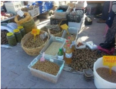
Fig. 5. Satılan yöresel turistik ürünler

...Biz burada yan yanayız. Dip dibe böyle insanlar. Sığmıyor. Ön taraflara koymasak ürünüümüzü tezgâh almıyor. Orda kavgalar da oluyor, tartışmalar da oluyor. Bir karış yer için adam tartışıyor. Çünkü yer yok, alan dar. Köyden gelecek olan pazarcı daha çok. Hafta sonları buraya o kadar pazarcı geliyor ki sıkış sıkış ya insanlar. Pazar yerinin büyümesi lazım en başta. ...Köyden gelen talep çok, gelmek isteyen köylü çok. 26 tane pazarcı esnaf var şu an burada. Hafta sonu burada 35 kişi olur en az. Sığmıyor (K2).