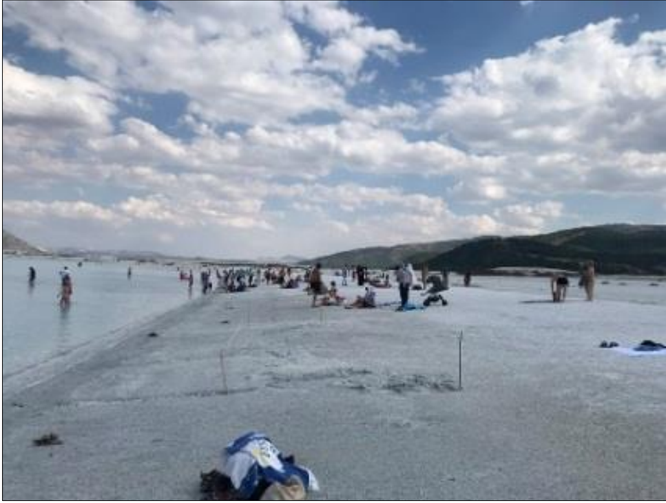
Fig. 2. Salda Gölüne gelen ziyaretçilerden bir görsel