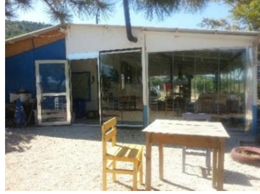
Fig. 10. Göl kenarında şahıs işletmesi (Ceylan)