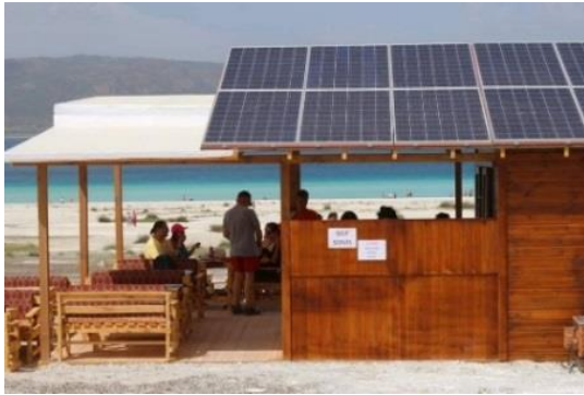
Fig. 7. Kaymakamlık tarafından işletilen işletmeler

...Köylü Salda'ya gelen ziyaretçilerden memnun. Geçen yıl 20-30 tane köyün (konteynır) işletmeleri vardı. Kaymakamlık Valilik bunları yıktırdı, jandarma zoruyla kaldırttırdı. Kaymakamlık kendisi yaptırdı. Bu şekilde (ahşaptan) daha hoş olduğunu söylediler. Bize böyle bi Pazar yeri yaptılar. Ama bizim gözleme ve çaydan kazandığımız daha yüksekti. Restorandan kazancımız daha yüksekti (K2).