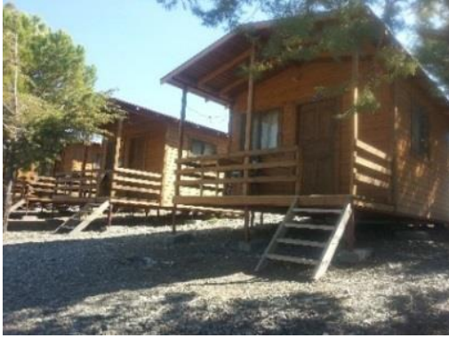
Fig. 13. Göl kenarındaki bungalov evler

Salda Gölü kenarında bazı yerli ve yabancı ziyaretçilerin kendi karavan ve çadırlarında konakladıkları ve rekreasyonel amaçlı göl alanından yararlandıkları görülmektedir (Fig. 11, 12). Salda Gölü Belediye Halk Plajı kenarında yer alan yaklaşık 15 bungalov (ahşap) ev ile gelen ziyaretçilere konaklama hizmeti sunulmaktadır. Bu evlerin içerisinde çift ve tek kişilik yatak ve duşakabinler bulunmakta olup, gecelik 100 Türk Lirası karşılığında Yeşilova Belediyesi tarafından konaklama hizmeti sunulmaktadır (Fig. 13-14).