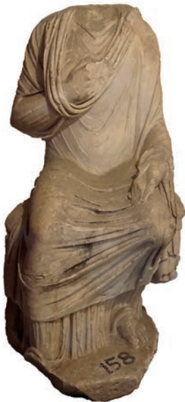
Figür 9: a: Tire-Mehmetler heykeli cepheden görünüm / View of the Tire-Mehmetler statue from the front. b: Mehmetler heykeli ile tipolojik olarak benzer stel örneği / An example of a stele typologically similar to the Mehmetler statue (Pfuhl ve Möbius, 1977, Tafelbad I no. 884).

Asya Eyaleti'nin başkenti Ephesos, standartları yüksek ailelerin ihtiyaç duyduğu çeşitli eğitimcilerin kolay bulunabileceği bir yerdir. Mülk sahibi efendiler, konutlarında istihdam ettikleri eğitimciler ile çocuklarının geleceğini hazırlamış, olasılıkla kadınlarda eve sıkça uğrayan eğitimcilerden istifade etmiştir (Hemelrijk, 1999, s. 33-34).