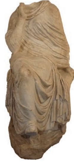
Figür 1. Tire-Işıklı Heykeli Ön Cepheden Görünüm/ Front View of the Tire-Işıklı Statue.

Bireylere şans ve toplumsal huzur, bereketi getiren, kentleri koruyan bir tanrıça kimliği Tykhe'nin antik dünyada oldukça popüler olmasını sağlamıştır (Okan, 2016, s. 11). Tanrıçaya atfedilen özelliklerinden dolayı Geç Antik Dönem'de Roma dünyasının önemli ölçüde hıristiyanlaşmış olmasına rağmen, betimlemeleri materyallerde veya mimari bezemelerde yer almaya devam eder (Dohr,1960, s. 17-39; Kondoleon, 2000, katalog no. 1,2,3,4; Matheson, 1994, s. 19, 26). İmparatorluk genelindeki önemli kent ve bu kentlere ulaşan yol ağlarını gösteren Tabula Peutingeriana'da hala en büyük kentler Tykhe figürleri ile kişileştirilmektedir (Salway, 2005, s. 12-131). Figürün uzun soluklu yaşaması ne kadar çok sevildiğini gösterir.