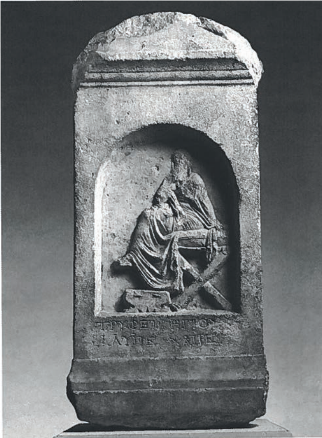
Figür 2. Trypthe'nin Mezar Steli/ Grave Relief of Trypthe (Condolon, 2001, s. 139, fig.).