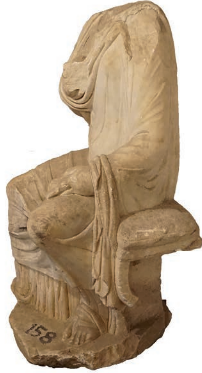
Figür 11a. Ephesos, Scolastika heykeli / Ephesus, Sculpture of Scolastika.