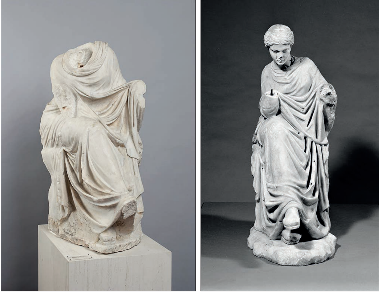
Figür 5. Antakya Tykhesi Roma Dönemi Heykelleri / Tyche of Antioch Roman Era Statues a: Vatikan Müzesi ( https://upload.wikimedia.org/wikipedia/commons/b/b8/Tyche_Antioch_Vatican_Inv2672.jpg ), b: Budapeşte Güzel Sanatlar Müzesi ( https://www.mfab.hu/artworks/5613/ ), c: Metropolitan Müzesi ( https://www.metmuseum.org/art/collection/search/248790 ).