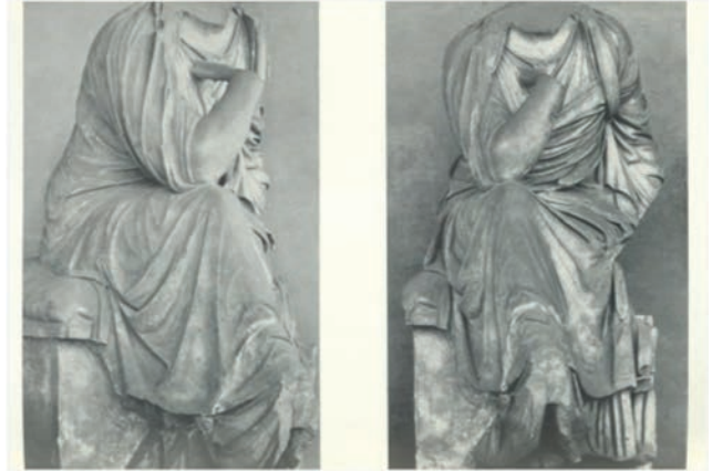
Figür 8. Roma, Oturan Kadın Heykeli / Rome, Seated Woman Statue (Dohrn, 1960, tafel 42, 1-2).

Işıklı heykeli konteksti hakkında bilgi sahibiz değiliz. Müze kayıtlarında buluntu yeri hakkında detaylı bir bilgi bulunmamaktadır. Yazılı bir belge eksikliğinden dolayı heykelin mezar heykeli olduğu düşüncesi öneride kalmaktadır. Ancak Antakya Tykhe heykelinin yapılmasından kısa süre sonra, İÖ 2. yüzyılda kadınları temsil eden mezar stellerini motif olarak etkilediği açıktır. Ayrıca Roma Ulusal Müzesi koleksiyonunda yer alan bir bağımsız mezar heykeli Tykhe tipini temel alarak yontulmuştur (Dohrn, 1960, s. 45). Erken İmparatorluk Dönemi'ne tarihlenen Roma örneğinde minderli bir taburede oturan kadın, bacak bacak üstüne atar vaziyettedir. Sağ kolu üstte olan bacak ile dirsek temasında olup, bacadan destek almaktadır. Yukarı hareket eden sol kol muhtemelen başı çene altında desteklemiştir. Sol el kırık olsa da yana doğru açıldığı izlenimi vermektedir. Kadın figürü duruş ve elbise detayları ile Tykhe tipini model aldığı açıktır. Mezar heykeli olduğu kesin olarak bilinen Roma örneğinden yola çıkarak, Tykhe tipinin soylu kadınları temsil eden mezar tasvirlerinde tercih edildiğini düşünmek mümkündür. Işıklı örneğinin de bu bağlamda soylu bir kadın mezarına dikilen heykel olması muhtemeldir.