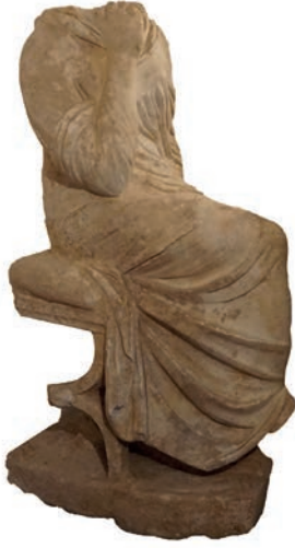
Figür 7. Işıklı heykeli sol yönden görünüm / View of the Işıklı statue from the left.