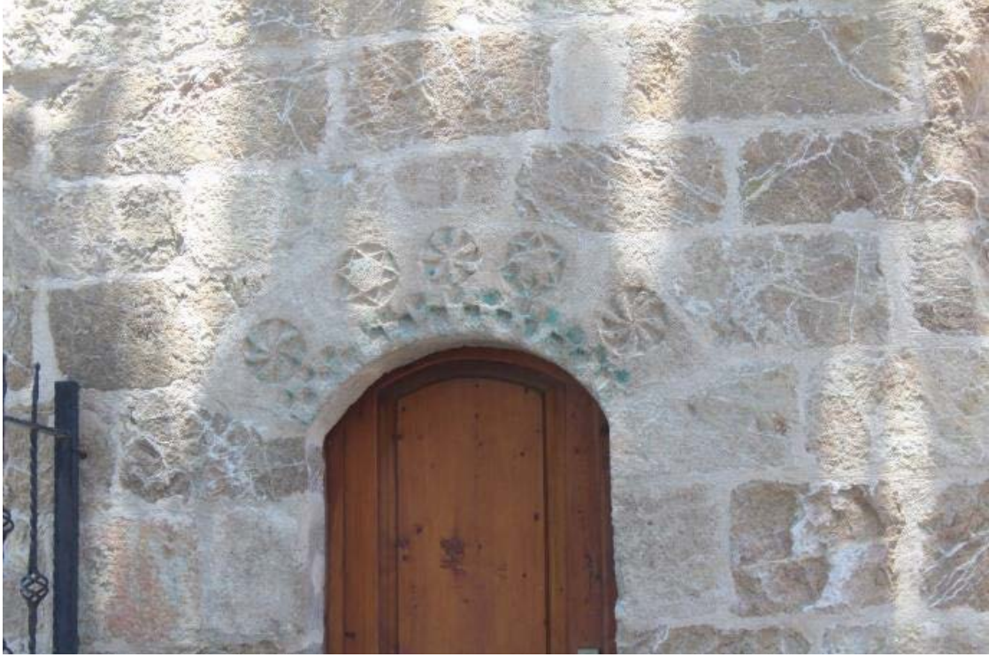
Fotoğraf 21: Kahramanmaraş Çukuroba Camii minare kapı kemerindeki süsleme

Türk inancı ile bağlantılıdır. Türk mitolojisinde bir çift gök ejderi tarafından çevrildiğine inanılan gök kubbe, gök çarkı olarak adlandırılmıştır. İslamiyet'in kabulü ile Türkler bu inancı dairesel bir çember ve merkezden kenara doğru rüzgâr gülü gibi aynı yöne dönük çizgilerden oluşan bir motif olarak sanat eserlerine işlemiştir. Motifin dünyanın dönüşünü, düzenini, yaşamın devridaimini, Tanrı'ya ulaşma ve iki dünya arasındaki geçişi ifade ettiğine inanılmaktadır. 31 Çoğunlukla mezar taşlarında uygulanan bu motif, 32 Türk-İslam devri cami, mescit, türbe ve kervansaray gibi mimari yapıların kubbelerinde bir bezeme unsuru şeklinde de karşımıza çıkmaktadır. 33 Şeyh Müslim Camii giriş kapı kemerindeki çarkıfelek motifleri de Türk-İslam inanç sistemiyle bağlantılı olarak Allah'a ulaşmanın bir ifadesi şeklinde işlenmiş olmalıdır.