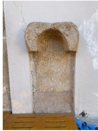
Fotoğraf 18: Harim giriş kapısının batısındaki mihrap nişi

6 Şubat 2023 tarihli depremde cami duvar sıvalarında yer yer çatlaklar meydana gelmiş, ancak yapı sağlam olarak günümüze ulaşmıştır. Yapıdan bağımsız konumdaki minarenin ise gövde ve üst bölümü yıkılmış, yalnızca kaidesi ayakta kalmıştır (Fotoğraf 20).