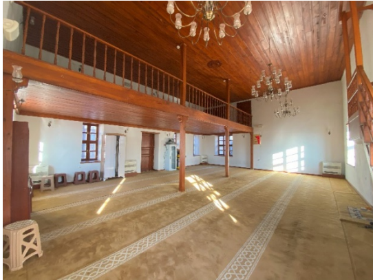
Fotoğraf 13: Harim bölümüne eklenen kadınlar mahfili (Özkan, 2023)

2018 yılında Vakıflar Genel Müdürlüğü tarafından yapının restorasyonu tamamlanmıştır. Restorasyon çalışması sonrasında harim girişinin iki yanındaki sekiler kaldırılmıştır. Bu bölüme, ahşap dikmeler üzerine yükselen bir kadınlar mahfili eklenmiştir (Fotoğraf 13). Harim doğu duvarının üst bölümüne bir kapı açılmış ve bir merdiven eklenerek dışarıyla bu bölümün bağlantısı sağlanmıştır (Fotoğraf 14).