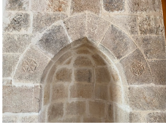
Fotoğraf 15: Cami mihrap duvarı (Özkan, 2023) Fotoğraf 16: Mihrap kemer detayı (Özkan, 2023)

Cami giriş bölümünde yapılan düzenlemelerde, giriş kapısının batısında yer alan etrafi açık seki şeklindeki bölüm kaldırılmıştır (Fotoğraf 17). Burada bulunan yarım daire kesitli nişin derinliği (mihrap) duvar sıvasının temizlenmesi ile ortaya çıkarılmıştır (Fotoğraf 18). Ayrıca, harim giriş kapı kemerindeki süslemeler temizlenerek motifler anlaşılır duruma gelmiştir (Fotoğraf 19). Kapı kemerini oluşturan taşlar yeni bir düzenlemeyle ele alınarak daha düzgün bir form elde edilmiştir. Caminin duvarlarına raspa yapılmış çatı, zemin, tavan ve pencere ahşapları yenilenmiştir. Harim giriş kapısı da ahşap malzeme ile değiştirilmiştir.