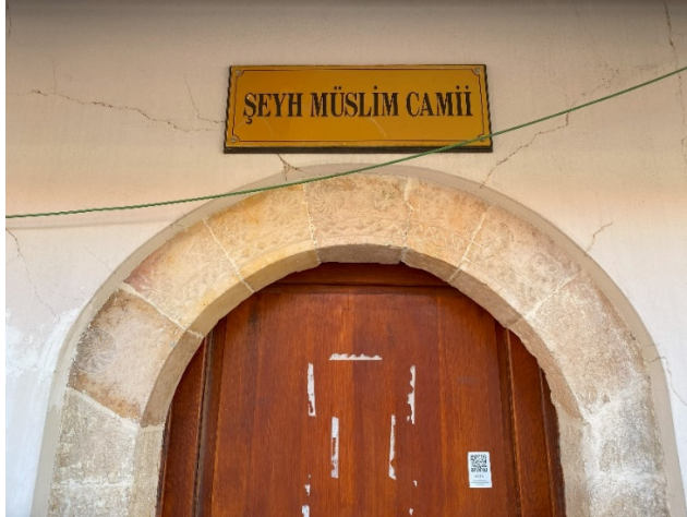
Fotoğraf 19: Harim giriş kapı kemerindeki süslemeler (Özkan, 2023)