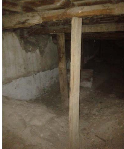
Fotoğraf 7: Harim zemini altındaki mekânda tespit edilen sıva izleri (Pınar, 2014)

Caminin kuzeydoğu köşesinde yapıdan bağımsız minareye yer verilmiştir. Kare bir kaide üzerinde tek şerefeli kısa petek, külah ve âlem bölümleri olan minare 1960 yılında yapılmıştır (Fotoğraf 8). Minareye giriş kaidenin kuzey cephesinde, cami avlusuna açılan küçük bir kapıdan