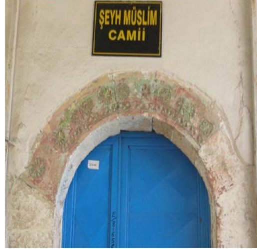
Fotoğraf 12: Harim giriş kapısı kemer alınlığındaki taş bezeme (Pınar, 2014)