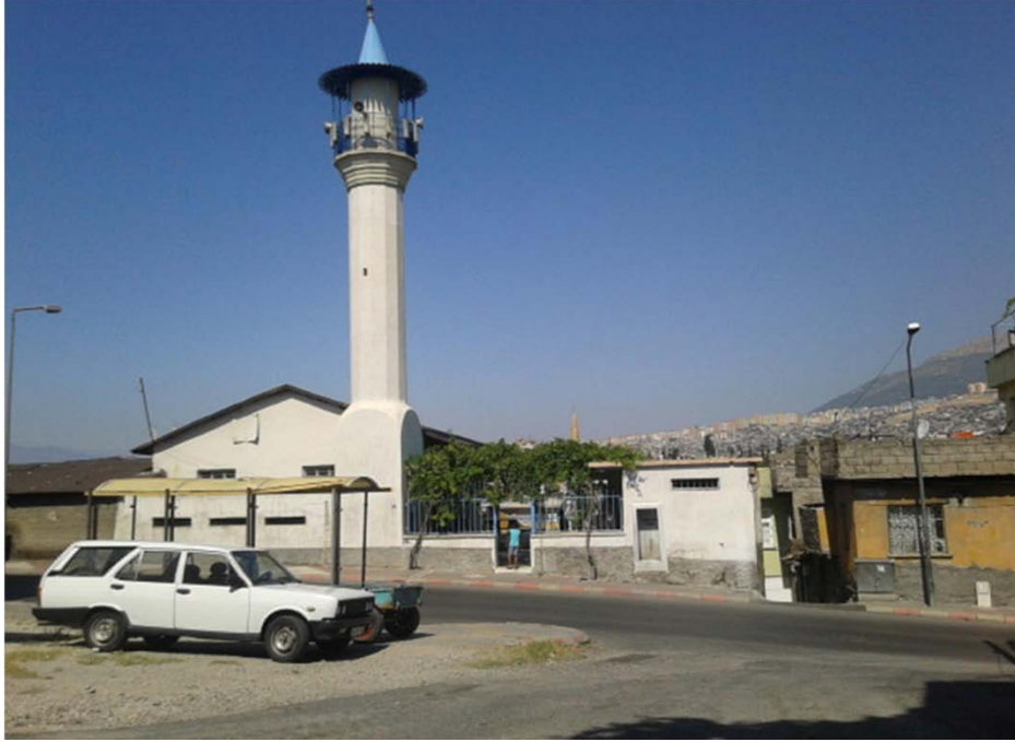
Fotoğraf 1: Şeyh Müslim Camii Avlu (Doğu Cephe) Giriş Kapısı (Pınar, 2014)

Meyilli bir arazi üzerinde konumlanan cami, enine dikdörtgen planlı olup ahşap tavanlı camiler gurubuna girmektedir (Çizim 1). Caminin kuzeyinde yer alan avluya, doğu duvarında Benli Ali Caddesi'ne açılan kapıdan girilir. Harim girişi ise cami kuzey cephesinde mihrap ekseninde olup basık kemerlidir (Fotoğraf 2). Harim giriş kapısının hemen sağında yerden yaklaşık 60 cm yükseklikte etrafı açık bir alan bulunmaktadır. Bu alanda, cami kuzey duvarına bitişik olan yarım daire kesitli bir çıkıntı bulunmaktadır. Buranın bir son cemaat yeri olarak kullanıldığı düşünüldüğünde bu çıkıntının mihrap işlevi gördüğü düşünülebilir (Fotoğraf 3).