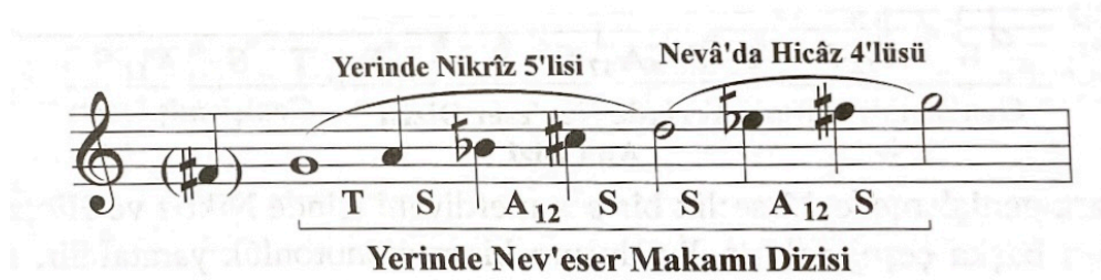
Görsel 1. Nev' eser Makamı Dizisi (Özkan, 2006, s.417)

İçinde birden fazla basit makam dizisi olan, bileşik makamlar arasında yer alan Nev' eser makamı ile ilgili Yılmaz, şu bilgileri vermektedir: “Durağı rast perdesidir. Seyri inicidir. Donanımı, si ve mi bakiye bemol, fa ve do bakiye diyezdür. Dizisi, rast perdesi üzerinde nikriz beşlisi ve neva perdesinde hicaz dörtlüsünden meydana gelir” (Yılmaz, 1984, s.156).