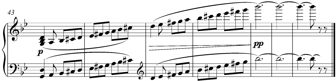
Görsel 6. Op. 50, No.9, Orientale Piyano Eşliğinde Son Ölçüler (43-49. Ölçüler)

sonra tekrar gelmekte ve 22. ölçünün sonuna kadar devam etmektedir. Eser, bu yapı içerisinde küçük çaplı ritmik ve ezgisel değişikliklerle sürmekte ve crescendo yaparak pianissimo nüansında, piyano partisinde uzun bir si bemol pedal sesi üzerinde sona ermektedir. Eserin aynı şekilde Nev' eser makamı dizisi içerisindeki bitişi, görsel 6'daki piyano eşlik partisinde daha açık bir şekilde görülmektedir.