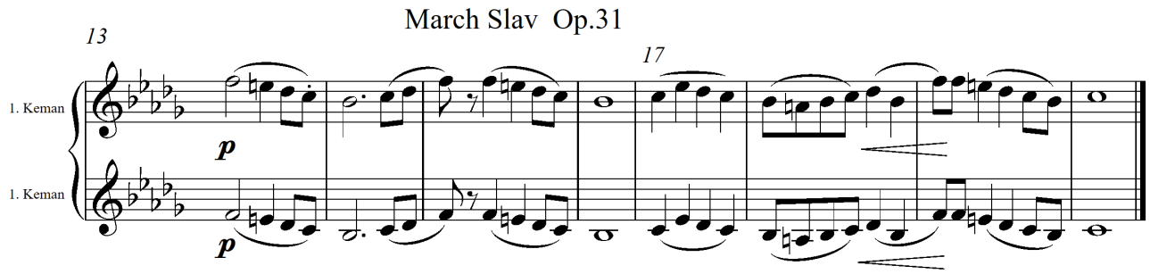
Görsel 8. Tchaikovsky Op.31 Slav Marşı'nın Moderato Temposunda Cenaze Marşı Tarzındaki İlk Bölümü (13-20. Ölçüler)

Bu melodinin karşılaştırmasının daha iyi yapılabilmesi için tema, yerinde Nev' eser makamı dizisinde, sol ekseninde tek parti olarak yazılmış ve görsel 9'da verilmiştir.