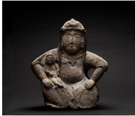
Görsel 9. Selçuklu Dönemine Ait Umay Ana Tanrıça İdol Örneği

Sanatçının "Umay Hatun I" isimli gravür baskının orta merkezinde iri ve dolgun vücutlu bir kadın figürü kollarını yukarı doğru açar şekilde betimlenmiştir. Ayrıca kolları üzerinde renkli kuş figürleri de bulunmaktadır. Sanatçı Potapov'un bahsettiği şekilde koruyucu bir melek gibi tasvir etmiştir. Bu melek Batı sanat tarihinde gördüğümüz meleklerle benzememektedir. Daha çok Selçuklu dönemine ait Umay ana tanrıça idollerini (Görsel 9) anımsatmaktadır. Bu idollerde kadın bedeni idealize edilmeden verilmiştir. "Çoğunlukla oturan iri memeli, iri kalçalı, kocaman karınlı ana tanrıça idolleri ya da onlardan da önce çok da soyutlanmış kült figürleri, müzelerimizin ve Batılı müzelerin dünyanın düş gördüğü Çağ'a ait kanıtlardır." (Turan, 2014 ).