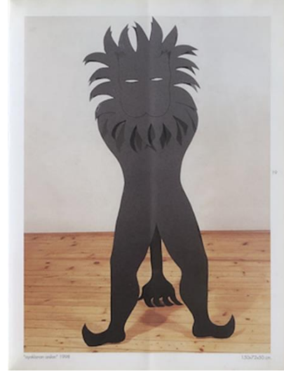
Görsel 6. (Sağ). Karaname Sergi Kataloğundan Görsel. Kaynak URL: 5

Eserlerinin ilham kaynağı Türk mitolojisi olsa da sanatçı konuyu kendi iç dünyasında anlamlandırarak sembolik figürler oluşturduğu görülmektedir. Gürbüz, sanat eserleri aracılığıyla doğa ve insan arasında düş gücüne dayanan bir ilişki kurmaktadır. Onun dünyası gizemli olduğu kadar tanındıktır. “Dünya Diye Bir Yer” sergisi üzerine yapılan röportajda; “Doğasıyla, hayvanlarıyla, bitkileriyle, kadınlarıyla, bütün duygularıyla, düşünceleriyle, mitleriyle, masallarıyla, rüyalarıyla ve daha pek çok şeyiyle görmekte ve duymakta olduğum, içinde nefes aldığım, ait olduğum, kalbimin en derinlerinde hissettiğim, bugüne kadar ara vermeden resmettiğim dünya...” (Çıplak Drillat, 2021) diyerek kendi dünyasını da anlattığından bahsetmektedir. Sanatçı eserleriyle iç dünyasının kapılarını aralamakta ve izleyicileri bu dünyaya davet etmektedir. Eserlerinde insan, hayvan ve bitki arasındaki sınırları muğlaklaştıran bir dünya yaratmaktadır.