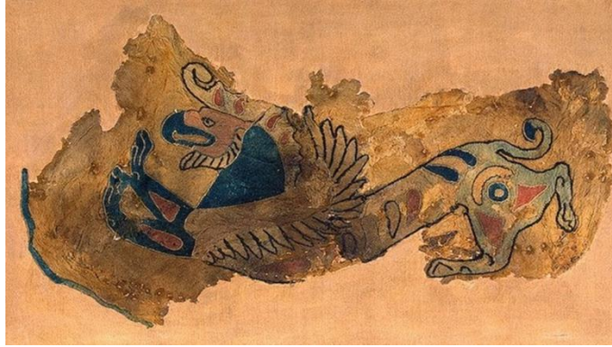
Görsel 1. Hun Sanatından Bir Örnek

Mitolojik hikâyeler, farklı kültürlerde ortaya çıkan anlatılardır. Genellikle konularını doğa olayları, tanrılar ve kahramanlıklar oluşturmaktadır. Eski çağlardan beri, insanlar anlam veremedikleri olaylar karşısında hayal güçlerini kullanarak çevrelerindeki durumları anlamlandırmaya çabalamışlardır. Böylece kendilerine tanrılar ve kahramanlar yaratmışlardır. ““Mitoloji” sözü, belirli bir kavme ait efsaneleri inceleyen, bir ilim dalı anlamına gelir.” (Gültepe,2015, s. 17). Mitolojik unsurlar, bir topluluğun dünya görüşünü şekillendiren ve geçmişle geleceği bağlayan önemli sembollerdir. “Mitler, binlerce yıl içinde yeryüzünün farklı noktalarında benzerlik içeren bir biçimde meydana gelmişlerdir ve toplumlara ait ortak mesajlardır” (Çağlayan Öcal, 2023). Dolayısıyla, mitoloji, belirli bir kültürün kolektif hafızası üzerinden çeşitli disiplinlerin iş birliği yaparak tarih, kültür ve insanlık hakkında derinlemesine anlayışlar sağlamak amacıyla incelenmektedir. İnsan (...) miti, kolektif düşüncenin en önemli biçimi addederek, genel bir düşünce tarihi ile birleştirmeye çalıştı. “Kollektif düşünce”, evrim mertebesi ne olursa olsun hiçbir toplumda asla tamamen fes edilmediği için modern dünyanın hala belli ölçüde mitsel bir davranışı muhafaza ettiği gördü (Eliade, 2017, s. 22).