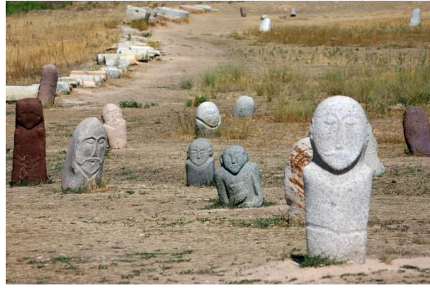
Görsel 2. Göktürk Balbal Örnekleri

Sanat eserlerini mitolojiden ayrı değerlendirmenin zor olduğu söylenebilir. Çünkü toplumun sahip olduğu mitoslar nesilden nesile aktarılmakta böylece geçmişten günümüze kadar farklı sanat formlarında kendine yer bulmaktadır. Kaptan Bazıyar (2016), “Mitoloji ve Çağdaş Sanat” isimli çalışmasında; “İnsan var oldukça sanat da mitler de ölmeyecektir. Sanatın dili, biçimi değişmektedir. İnsanın inanmaya ve yaratmaya olan eğilimi bitmeyecektir. Sanat, bu durumda doğaüstüne, ruhani olana, hayal gücüne en yakın dil olmaya devam edecektir. Tanrılar susmayacak, sanatçılar yoluyla konuşmaya devam edecektir.” şeklinde açıklamıştır. (Kaptan Bazıyar, 2016, s. 128). İnsanın mağara duvarlarından beri sanatla olan büyüsel ilişkisi, mitoloji ile devam etmiş, bugün de sanatçılar duygu ve düşüncelerini bu yönde ifade etmeye devam etmektedirler. “Tarihin alacalı dönemlerinden günümüze intikal eden çeşitli simgeler ve işaretlerle yeni anlamlar ve plastik değerler kazandırmak kavramı hem modern Batı ressamlarının hem de Türk ressamlarının yaratıcılıklarının esasında duran ortak bir özelliktir” (Yayan ve Sivri, 2017). Bu simgeler, sanatçılar tarafından sıklıkla yeniden yorumlanmakta ve modern sanatın dilinde yeni anlamlarla buluşmaktadır. Türk ressamları da kendi kültürel miraslarından ilham alarak, tarih boyunca kullanılan sembollerin yanı sıra Türk mitolojisinin unsurlarını da eserlerinde kullanmakta ve bu şekilde eserlerinde kullandıkları tarihsel simgeler,