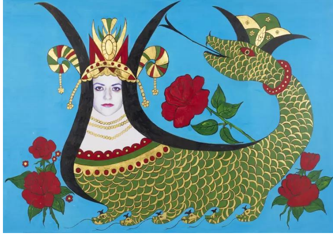
Görsel 7. Minyatür: Özel Asitsiz Kâğıt Üzerine Altın ve Asetat Üzerine Fotoğraf, 67 x 91 cm

üretimleri” (Gürlek, 2017, s. 12) yer almaktadır. Sanatçı bu üç katı Cehennem, Araf ve Cennet olarak üç bölüme ayırmıştır. Arafta yer alan sanatçının ‘Şahmeran’ (Görsel 7) eseri bu araştırma kapsamında ele alınacak imgedir. Şahmeran Mezopotamya topraklarında doğmuş ve çeşitli kültürlerde yer alan bir halk anlatısıdır. Kadın başlı, vücudu yılan olarak tasvir edilen bu efsanevi yaratığın en bilindik hikâyesi Cemşab ile olanıdır;