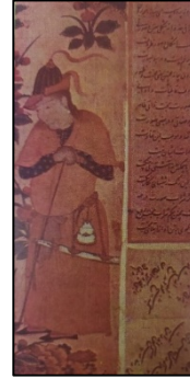
Resim 8: Muhammed Siyah Kalem'e Atfedilen Minyatür (Karamağralı, 1984)

Giysilerin üzerine kemer ya da kuşak bağlama geleneği, Türklerin Anadolu'ya yerleşmesinden sonra da süregelmiştir. Kemere asılan keselerle küçük eşyaların taşınması sağlanmıştır. XV. yüzyılda Muhammed Siyah Kalem'e atfedilen minyatürler arasında kemerinden kese sarkan figür (Resim, 8)