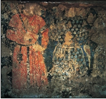
Resim 7: Gazneli Dönemine ait Leşker-i Bazar Sarayı Duvar Resmi (Sanatın Yolculuğu, 2022)

İslam öncesi Türk toplumlarında kullanılan giysiler ve aksesuar, İslam sonrası dönemde değişikliğe uğramadan kullanılmaya devam edilmiştir. Gazneli dönemine ait Leşker-i Bazar Sarayı'nın taht salonunda XI. yüzyıl başına ait duvar fresklerinde (Resim, 7) figürlerin kaftanlarına taktıkları kemerlerine asılı birer kese bulunmaktadır (Aytaç, 2009, s. 13; Çetin, Polat, 2020, s. 222).