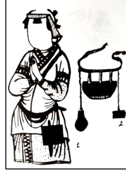
Resim 4, 5 ve 6: Uygur Dönemi Beyleri ve Vakıfçılar (Ögel, 1991, s. 85; Aslanapa, 2000, s. 19-23).

İslam öncesi Türk toplumlarında kullanılan giysiler ve aksesuar, İslam sonrası dönemde değişikliğe uğramadan kullanılmaya devam edilmiştir. Gazneli dönemine ait Leşker-i Bazar Sarayı'nın taht salonunda XI. yüzyıl başına ait duvar fresklerinde (Resim, 7) figürlerin kaftanlarına taktıkları kemerlerine asılı birer kese bulunmaktadır (Aytaç, 2009, s. 13; Çetin, Polat, 2020, s. 222).