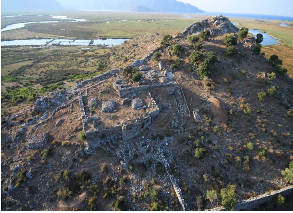
Fig. 1. Demeter Terası ve Kilise

Hristiyanlık evresine kadar terasın önemli bir kült merkezi olabileceğine işaret etmektedir (Zäh 2001, 403-413; Zäh 2001a, 111-116). Alanın yapılaşmaya uygun bir topografik yapıya sahip olmamasına ve burasının Hristiyanlık Dönemi'nde oldukça küçülen kent merkezinden nispeten uzak olan bu teras üzerine kentin en erken ve en anıtsal kilisesinin inşa edilmiş olması ancak alanın erken dönemlerden beri kutsallığını halk arasında devam ettirmiş olmasıyla açıklanabilir. Sonuç olarak arkeolojik kalıntılara göre yaklaşık olarak MÖ 500 ile MÖ II. yüzyıl ortaları arasında (çok büyük yoğunluk Hekatomnoslar Dönemi olmak üzere) bu alanda kült uygulamalarının gerçekleşmiş olduğunu söylemek mümkündür. Bu durum büyük oranda diğer Demeter kültlerinde de karşımıza çıkmaktadır (Arkeolojik ve epigrafik kalıntılar doğrultusunda Anadolu ve yakın çevresindeki kutsal alanlardaki kullanım süreçleri için bk. Karataş 2014, 565 Fig. 65).