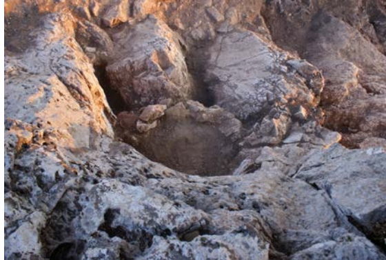
Fig. 7. 2 no'lu ocak, kazı sırasında

Kaya bloğunun kuzeyinde yer alan ve yan yana açılmış olan iki ocak (Fig. 5-9), bağımsız kaya kütleleri ve anakayaya oyulmuş kanallar ile birlikte kutsal alanın erken döneminin en önemli unsurlarını oluştururlar. Ocaklarla ilgili kültürler olasılıkla en erken kültür uygulamalarının da merkezindeydi. Ateş, tapınak kavramı henüz gerçek anlamına ulaşmadan ocaklarla birlikte kutsal kabul ediliyor olmalıydı ve Paleolitik dönemlerden itibaren içerisinde ateş yanan ocaklarda sunular ve adaklar yapılmaktaydı (Burkert 2011, 96).