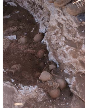
Fig 12. 2 no'lu ocağın üzerindeki hydria depolama alanı

Demeter'in zemindeki yarıklar sayesinde yer altıyla bağlantısı bilinmesine (Kayaya açılmış kanalların en güzel örneklerinden biri Efes'te karşımıza çıkmaktadır. Bk. Soykal-Alanyalı 2005, 319-326) karşın bu yarıklar sadece Demeter için değil genel olarak diğer khtonik tanrılar için de önemliydi (Kült alanlarında karşımıza çıkan benzer karşılaştırma örnekleri için bk. Bulba 2019a). Teras üzerinde çok yoğun buluntular ele geçmesine rağmen, bu adakların bırakılmış olabilecekleri bir alan ya da altar tespit edilememiştir. Belki de adaklar tüm kayalık alana, aynı zamanda da bu kanalların içine bırakılmaktaydı.