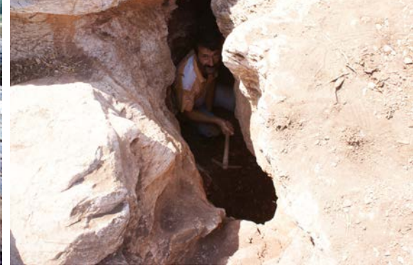
Fig. 4. Doğal Kaya Oyuğu