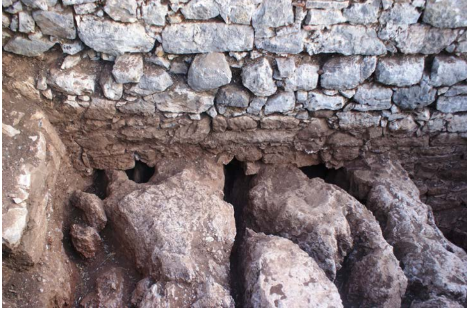
Fig. 10. Kilise orta nefi kuzey duvarı altındaki kanallar

geldiği, kanalların ise açık kalmaya devam ettiği ve her dönemde işlevlerini devam ettirdikleri düşünülmektedir. Bunu destekleyen en güçlü veri ocakların aksine kanalların içlerinde her dönemden buluntuların ele geçmesidir. Dolayısıyla bu kanallar gerek Hekatomnoslar Dönemi öncesi gerekse de sonrası dönemlerde yer altı tanrılarıyla ilgili kült uygulamalarıyla bağlantılı olmalıydı.