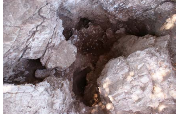
Fig. 6. 1 no'lu ocak, kazı sonrası

Kaya bloğunun kuzeyinde yer alan ve yan yana açılmış olan iki ocak (Fig. 5-9), bağımsız kaya kütleleri ve anakayaya oyulmuş kanallar ile birlikte kutsal alanın erken döneminin en önemli unsurlarını oluştururlar. Ocaklarla ilgili kültürler olasılıkla en erken kültür uygulamalarının da merkezindeydi. Ateş, tapınak kavramı henüz gerçek anlamına ulaşmadan ocaklarla birlikte kutsal kabul ediliyor olmalıydı ve Paleolitik dönemlerden itibaren içerisinde ateş yanan ocaklarda sunular ve adaklar yapılmaktaydı (Burkert 2011, 96).