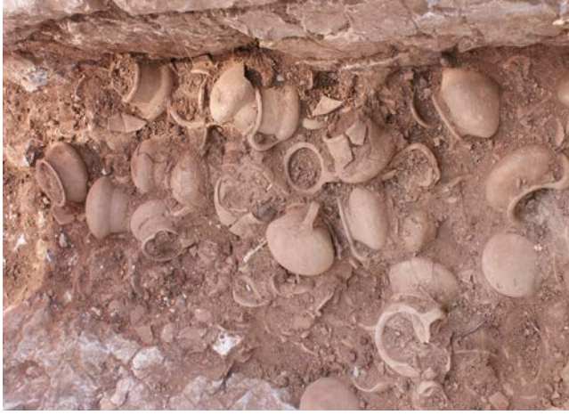
Fig. 11. Chytralar