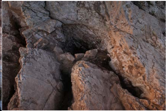
Fig. 8. 2 no'lu ocak, kazıdan sonra

Bu ocakların zeminin altına gelecek şekilde açılmış olmaları khthonik tanrı inancına işaret etmektedir. Bu tarz zemine açılmış çukurlar ve ocaklar özellikle ölü kültürlerinde görülmektedir. Bu kültürlerde bir altar dikilmeyip, yere çukur açılarak sıvı sunular içine akıtılmaktaydı (Örneğin Odysseus, Kirke'nin yönlendirmesiyle dünyanın kenarında yere bir çukur açarak üç kere libasyon yaptıktan sonra Hades ve Persephone'ye dualar ederek bir koç ve koyun kurban eder ve kanlarını bu çukura akıtır. Daha sonra ruhlar buraya toplanarak susuzluklarını giderirler. Kurban hayvanları da çukurun hemen yanında yakılmaktadır [Hom. Od. X. 517-537; XI. 23-50]). Anakaya bloğuna kuzey yönde yan yana yapılmış iki ocakta da çok ince, içerisinde yanmış ahşap ve başka organik madde kalıntısı olmayan kül tabakaları tespit edilmiştir. Bu ocaklarda neler yakıldığına yönelik analizler yapılmamıştır. Bununla birlikte güçlü bir ateş olmadığı gerek taşlarda yanık izleri olmamasından, gerekse yanmış odun vb. organik madde kalmamasından anlaşılmaktadır.