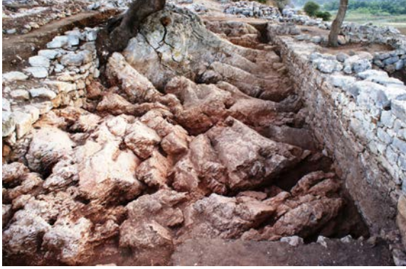
Fig. 3. Anakaya bloğu ve kilise orta nefinin içerisindeki kayalık zemin

olabilir: Kron 1992a, 56-70. Ancak yazarın da vurguladığı gibi, genellikle yazıtlı belgeler eksik olduğu için bunların yorumlanmaları zor ve spekülatifdir).