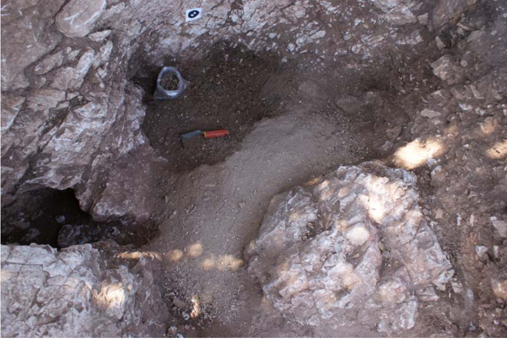
Fig. 9. 1 no'lu ocak, sunu çukuru, kemikler ve küller

Sembolik de olsa ateş, ısı ve ışık vermesiyle, koruyucu ve yakıcı özelliğiyle insanlar için kültürel anlamda her zaman çok önemli bir role sahip olmuştur. Burkert, ateşin aynı zamanda kötü ruhlardan da koruyucu bir özelliği olduğunu düşünmektedir. Ayrıca ocak bir tanrıça olarak (Hestia) Hellen kültüründe karşımıza çıkmaktadır ve yine en eski tapınaklar ocak-ev şeklindeydiler (Burkert 2011, 100). İçerisinde ateşin önemli role sahip olduğu birçok kült ve bu kültlere ait törenler mevcuttur (Burkert 2011, 102).