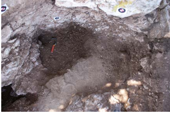
Fig. 5. 1 no'lu ocak, kazı sırasında

olmalıdır. Daha sonraki evrelerde yapılan düzenlemelerle anakaya bloğu da olasılıkla anikonik tanrı olma özelliğini kaybederek, etrafındaki kaya yarıkları yoluyla kızımın yeraltından çıkmasını beklerken yas tutmak için üzerinde oturduğu sembolik bir kayalık olarak algılanmaya devam etmiş olabilir.