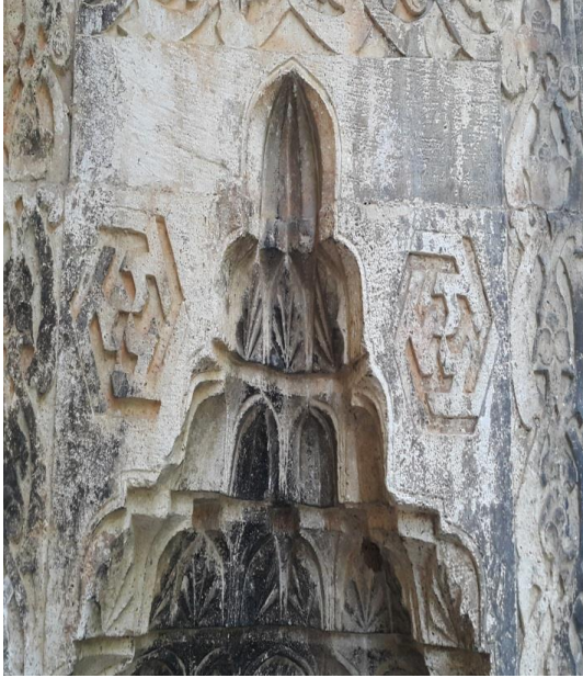
Fig. 8. Sağ mihrabiye nişi detay. Kufi hatla üçer adet iççe "على" yazısı (M. Demir 2019)