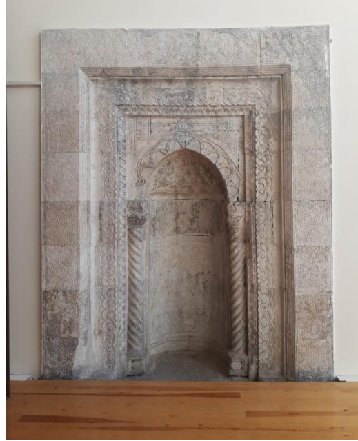
Fig. 5. Mihrabın günümüzdeki durumu