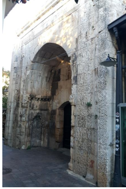
Fig. 3. Celaleddin Karatay Dârü's Sülehâsı (M. Demir 2019)