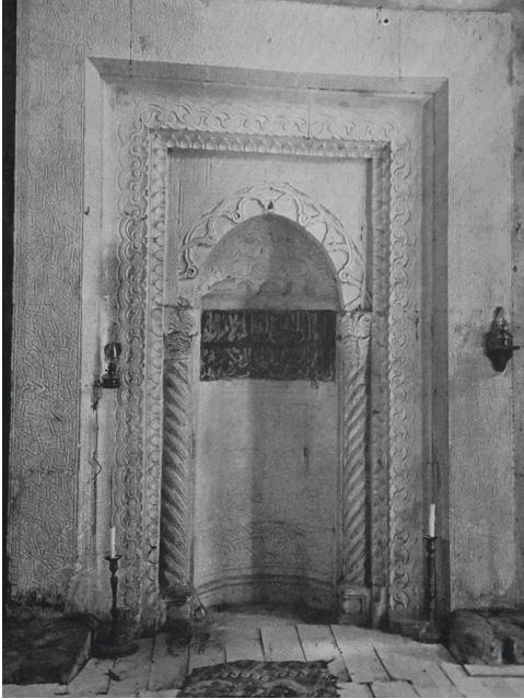
Fig. 4. Binanın mihrabı (Riefstahl 1941, 40-41)