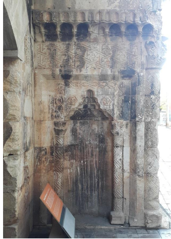
Fig. 7. Binanın sağ mihrabiye nişi (M. Demir 2019)