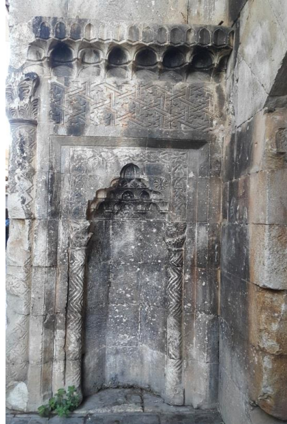
Fig. 9. Binanın sol mihrabiye nişi (M. Demir 2019)