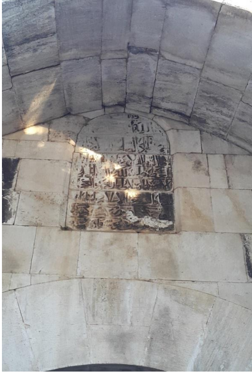
Fig. 6. Celaleddin Karatay Darü's-Sülehası kitabesi (M. Demir 2018)