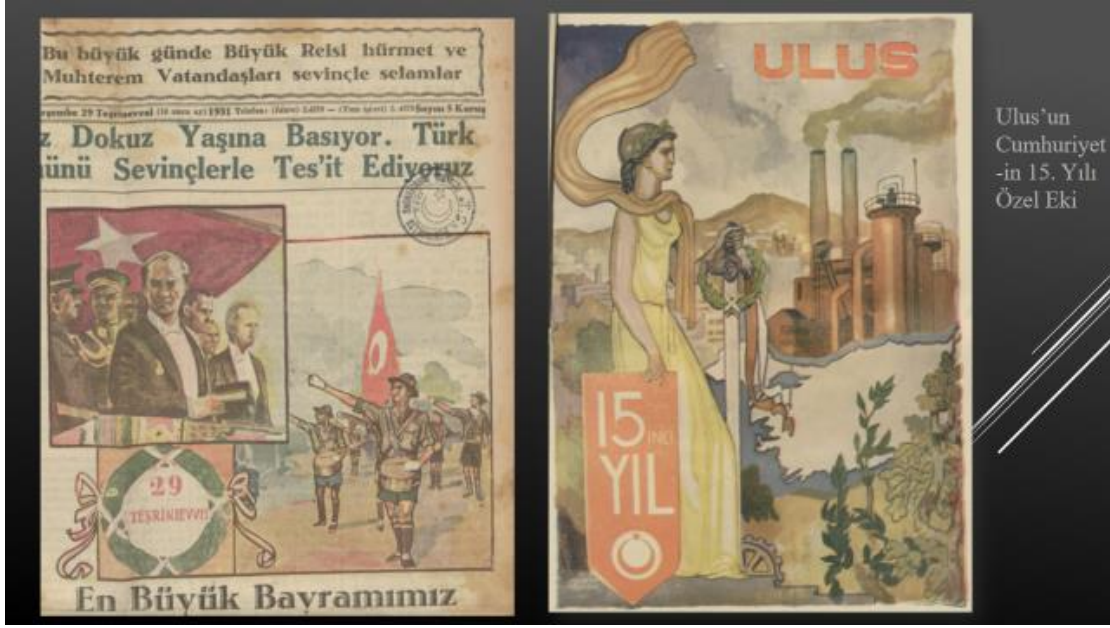
Resim 8, 9. 29 Teşrinivevvel/Ekim 1931 Vakit-30 Ekim 1938 Ulus

1920’li ve 1930’lu yıllarda gazetelerin klişeleşmiş düzenlerinin -29 Ekim’de grafik çizimlerin sonraki günlerde tören fotoğraflarının yayımlanmasının- dışına çıkan örneklerle de karşılaşılmaktadır. Nitekim 29 Ekim 1931 tarihli Vakit ’in ön sayfasında -Cumhuriyet Bayramı törenlerinin fotoğraf karesini anımsatır şekilde- izci geçişini ve Mustafa Kemal’in selamlamasını içeren çizimlere başvurulmuştu. Bir anlamda sonraki günlerin fotoğraflarının provası çizimle yapılmıştı ( Vakit , 29 Teşrinivevvel/Ekim 1931, s.1). Ulus gibi bazı gazeteler tarafından ilerleyen tarihlerdeki Cumhuriyet Bayramlarında (çoğunlukla 30 Ekim’de) Cumhuriyet eki çıkartılmış; bu eklerde de grafik çizimlere yer verilmişti.