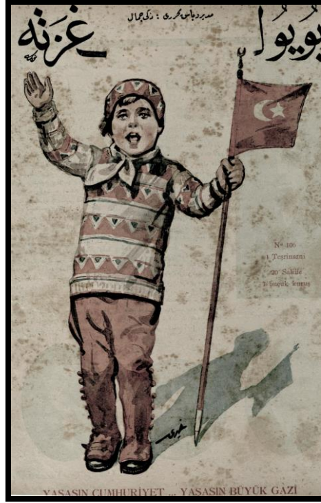
Resim 32. 1 Kasım 1928 Büyük Gazete