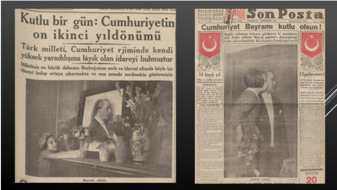
Resim 34, 35. 29 Ekim 1935 Cumhuriyet-29 Ekim 1936 Son Posta