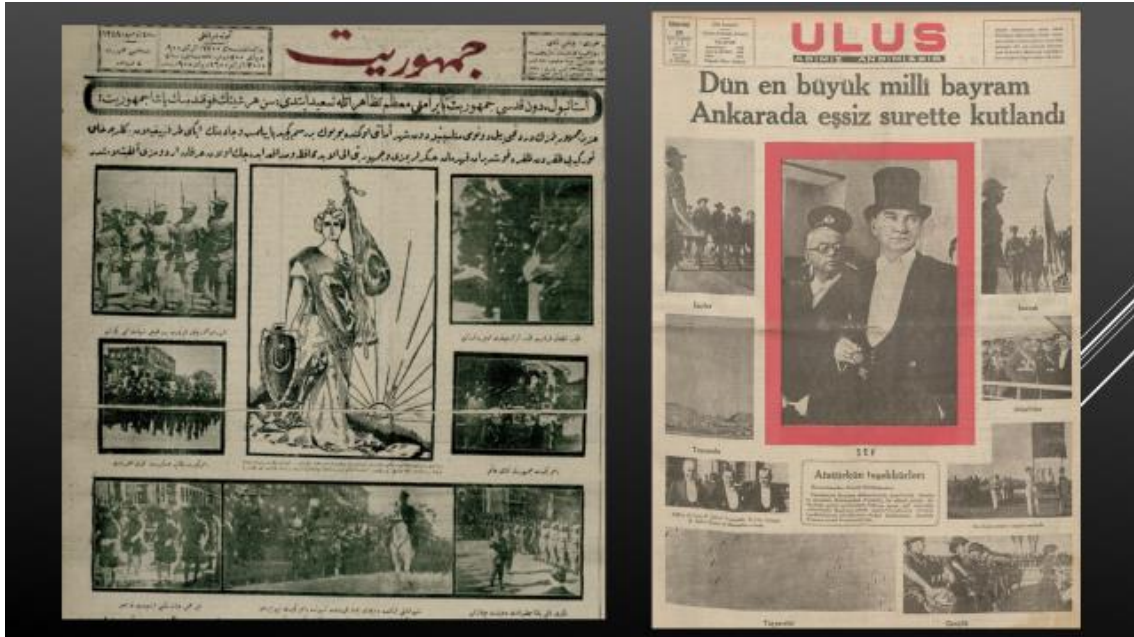
Resim 6, 7. 30 Ekim 1927 Cumhuriyet-30 Ekim 1937 Ulus

30 Ekim 1927 tarihli Cumhuriyet 'in birinci sayfasındaki çizim, omuzundan beline inen ayyıldızlı kuşak takan, sol elinde Türk bayrağı sağ elinde üstünde ayyıldız bulunan kalkan taşıyan zırh giymiş kadın ve arkasından içinde cumhuriyet yazan güneşin doğuşunu içeriyordu. Burada da yine kadınla ülke sembolleştirilirken -adeta biraz bilinçaltına hitap eder şekilde- başarı/zafer, savunma-güvenlik, barış ve aydınlık geleceğin ümidi gibi vurguları öne çıkartılmak istenmişti ( Cumhuriyet , 30 Ekim 1927, s.1). 1930'ların sonlarında smokin ve silindir şapkalı fotoğraflarıyla Cumhurbaşkanı Mustafa Kemal Atatürk, Cumhuriyet 'in öncelikli simgesi ve imajı olarak ön sayfaların merkezindeydi ( Ulus , 30 Ekim 1937, s.1)