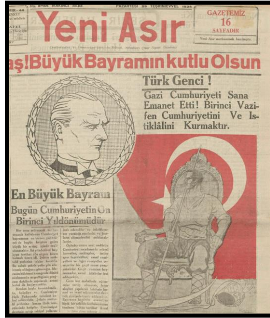
Resim 33. 29 Ekim 1934 Yeni Asır

Yeni nesiller açısından çocuklarla Cumhuriyet'in ilişkilendirilmesi ve Atatürk'le resmedilmelerinin ilk örnekleri doğal olarak 1920'li yıllara inmektedir ( Büyük Gazete , 1 Kasım 1928, kapak sayfası). Bununla birlikte çocukların Cumhuriyet ile bağlarını açıklamaya ve güçlendirmeye yönelik yayın politikasını, 1930'ların ikinci yarısındaki Cumhuriyet bayramlarında özellikle Son Posta gazetesi gütmüştü 4 .