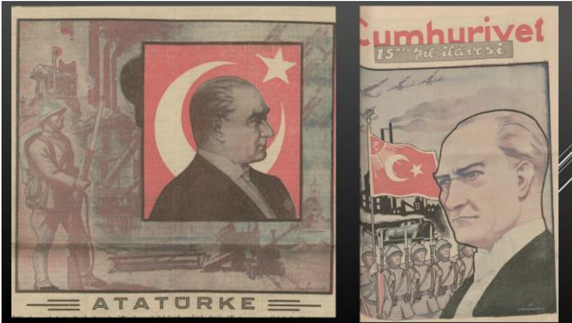
Resim 30, 31. 29 Ekim 1937 Cumhuriyet-30 Ekim 1938 Cumhuriyet 15. Yıl Eki

Nihayet, gazete görsellerinde barış teması aslında hem 1920'li yıllarda hem de 1930'larda ihmal edilmemişti. Üstelik 1930'ların parolası Yurtta Sulh Cihan'da Sulh idi. Askeri güç vurgusunun caydırıcı bir konumda olduğu hemen yanında barış temasının güçlü şekilde işlenmesinden anlaşılmaktadır. Grafik çizimlerde caydırıcı da olsa süngüler ön plana çıkmıştı.