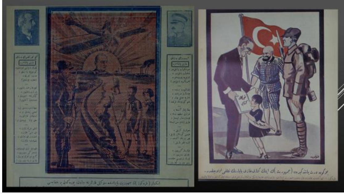
Resim 17, 18. 30 Teşrin-i Evvel/Ekim 1926-29 Teşrin-i Evvel/Ekim 1927 Karagöz

Ayrıca 1920'lerin ortalarında olduğu gibi 1930'ların hemen başlarında da görülecek film şeridi mantığında kronolojik görsel dizileri de oluşturulmuştu. Milliyet , manşetinin hemen altında yatay ve sayfanın sol başında ise dikey görsel şeritleri düzenlemiş; ters L (Γ) olarak görülebilecek bu düzenlemenin köşesine (manşet altındaki sol yan) parıldayan güneş içinde Mustafa Kemal Paşa'nın resmi yerleştirilmişti. Dolayısıyla yatay ve dikey yerleştirmelerin başlangıç noktasında ve ortaya çıkan 90 derecelik açının merkezinde Mustafa Kemal Paşa durmaktaydı. Dikey şerit maliye, adalet, savunma, sanayi üretimi, barış sembollerinden oluşurken yatay şerit askeri/sivil denizcilik, havacılık, tarım, ulaştırma, demokrasi mesajını veren çizimlerden kurgulanmıştı. Ters L'nin (Γ) oluşturduğu açının içinde Mustafa Kemal Paşa'nın takım elbiseli çizimine de yer verilmişti ( Milliyet , 29 Teşrin-i Evvel/Ekim 1926).