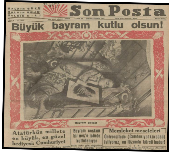
Resim 36. 29 Ekim 1937 Son Posta

Son Posta 'nın 1936-1938 yılları arasında yayınladığı görseller, çocukların Atatürk sevgisinin yanında gelecek ve vizyon temasını içermekteydi. Kuşkusuz bu görseller, Atatürk'le birlikte cumhuriyet kültürünün oluştuğu izlenimini de somutlaştırmaktadır. Öte yandan Atatürk'ün kaybından 12 gün önce Son Posta 'nın yayınladığı 29 Ekim 1938 tarihli, küçük bir çocuğun sarıldığı Atatürk fotoğrafını hiç birşeye değişmemesi, paylaşmak istememesini işleyen görsel ve «Ona herşey feda!» söylemiyle Cumhuriyet Bayramının kutlanması, aslında içten bir vedalaşma olarak kabul edilebilir. Kuşkusuz bunlar, halkın en küçük halkasında bile Atatürk ve Cumhuriyet'in içselleştirildiğinin/benimsendiğinin, onlara gösterilen samimiyet ve duyulan sevginin göstergesiydi ( Son Posta , 29 Ekim 1936, s.1; Son Posta , 29 Ekim 1937, s.1; Son Posta , 29 Ekim 1938, s.1).