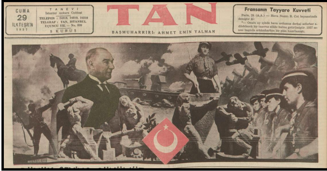
Resim 29. 29 Ekim 1937 Tan

Kuşkusuz O'na karşı duyulan saygı, hayranlık ve hassasiyeti de işliyordu (Cumhuriyet, 29 Ekim 1937, s.1; Cumhuriyet 15. Yıl İlavesi, 29 Ekim 1938, s.1).