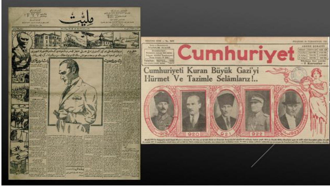
Resim 19, 20. 29 Ekim 1926 Milliyet-29 Ekim 1931 Cumhuriyet

1920'lerin özellikle grafik çizimlerden oluşan görsellerinde yer yer gelecek, başarı/zafer, aydınlık ve umut temasıyla karşılaşılacaktır. Dönemin özelliği, Cumhuriyet'in sık sık doğrudan Mustafa Kemal Paşa ile özdeşleştirilmesidir. Görsellerde Cumhuriyet'in O'nun eseri olduğunun altı çizilmektedir. Buna bağlı olarak sonraki süreçlere göre basit çizim ve tekniklerle hayat öyküsü işlenmiştir. Öte yandan farklı sembol ve temaları işleyen grafik çizimlerini de ilk ve temel-basit örnekleri gazete ve dergilerin (Karagöz) sayfalarını süslemişti. Bu görsellerde genellikle, savunma-güvenlik, ulaştırma, gelişme/sanayileşme ve üretim alan ve çabaları konu edilmiştir.