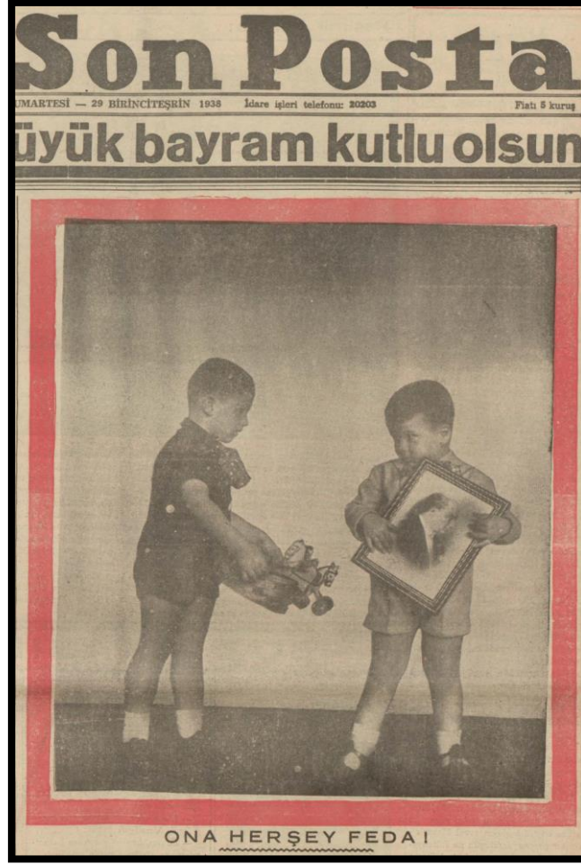
Resim 37. 29 Ekim 1938 Son Posta