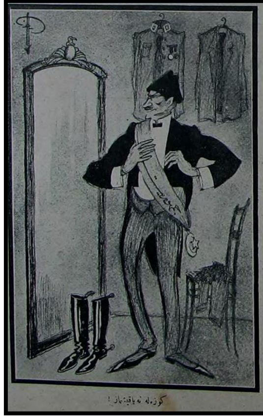
Resim 10. 1 Teşrin-i Evvel 1339/1923 Akbaba

Karikatür[k]te Mustafa Kemal Paşa'nın göğsünden beline üstünde cumhuriyet yazan bir kuşak uzanıyordu. Askeri üniforması ise duvara asılmıştı. Karikatür[k]ün altına ise «Güzele ne yakışmaz!» açıklaması yazılmıştı (Akbaba, 1 Teşrin-i Evvel 1339, s.1; Malkoç, 2023b, s.335-337,341-342). Kuşkusuz bu karikatür[k] cumhuriyet sistemi açısından keskin bir öngörü içerirken Akbaba açısından -özellikle derginin başyazarı Yusuf Ziya Bey'in Cumhuriyet'in ilanı öncesindeki yazıları dikkate alındığında- eleştirel bir boyut taşımaktaydı (Üçüncü, 2023, s.10-12).