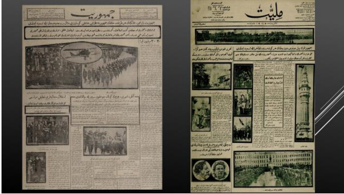
Resim 4, 5. 31 Ekim 1925 Cumhuriyet-30 Ekim 1927 Milliyet

30 Ekim 1927 tarihli Cumhuriyet 'in birinci sayfasındaki çizim, omuzundan beline inen ayyıldızlı kuşak takan, sol elinde Türk bayrağı sağ elinde üstünde ayyıldız bulunan kalkan taşıyan zırh giymiş kadın ve arkasından içinde cumhuriyet yazan güneşin doğuşunu içeriyordu. Burada da yine kadınla ülke sembolleştirilirken -adeta biraz bilinçaltına hitap eder şekilde- başarı/zafer, savunma-güvenlik, barış ve aydınlık geleceğin ümidi gibi vurguları öne çıkartılmak istenmişti ( Cumhuriyet , 30 Ekim 1927, s.1). 1930'ların sonlarında smokin ve silindir şapkalı fotoğraflarıyla Cumhurbaşkanı Mustafa Kemal Atatürk, Cumhuriyet 'in öncelikli simgesi ve imajı olarak ön sayfaların merkezindeydi ( Ulus , 30 Ekim 1937, s.1)