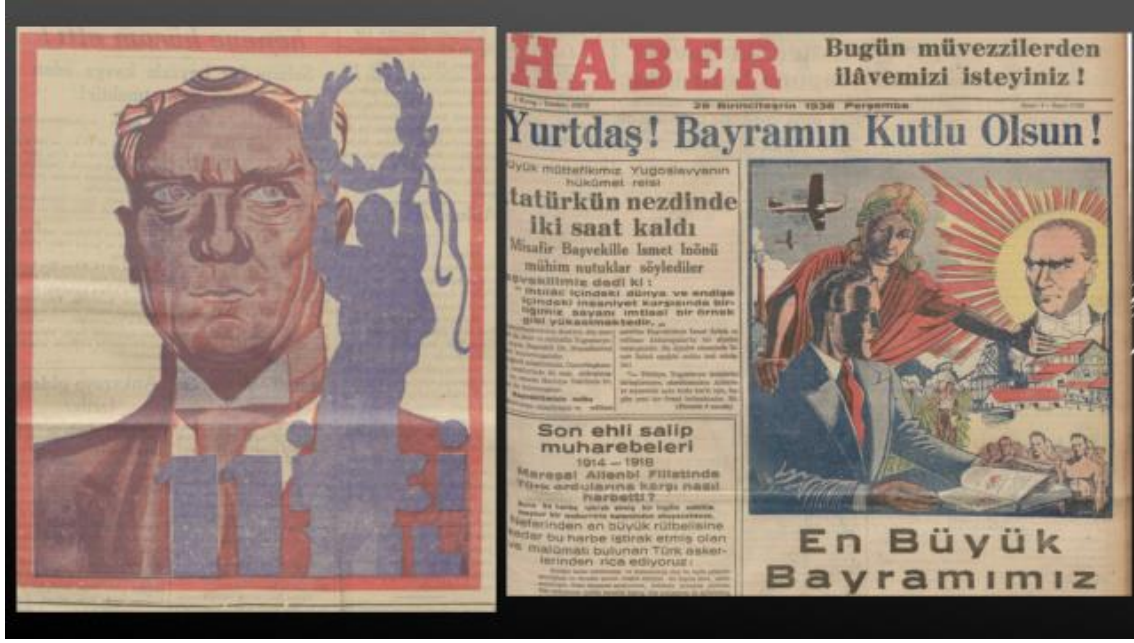
Resim 27, 28. 29 Ekim 1934 ve 29 Ekim 1936 Haber

Bu bağlamda 1930'ların ortalarında barış simgesini yansıtan figürler, çizimler; bağımsız olarak ya da çağdaşlaşma çabalarını içeren görsellerin içinde azımsanmayacak orandadır. Bunların renkli örneklerinden birini 29 Ekim 1936 tarihli Haber gazetesi yayımlamıştı (Haber, 29 Ekim 1934, s.1; Haber, 29 Ekim 1936, s.1). 1936 yılına ait görselde Atatürk güneşi altında Türkiye'nin her alanda zaferi/başarısı, kalkınması, şehirleşmesi, çalışma azmi ve gençlere dayanan dinamizmi sembolleştirilirken ön plana alınan tema, entelektüel gelişim, yani kültür devrimleriyle barıştı (Haber, 29 Ekim 1936, s.1). Zaten barış, bir diğer ifadeyle muhtemel savaşa karşı savaşız çözüm Türkiye için adeta zorunluluktur. Çünkü Türk Devrimi'nin çağdaşlaşma çalışmalarının hedeflerine taşınması ve ekonomik gelişmenin sağlanması; iş yapının güçlendirilmesi ve bunların sürdürülebilirliği için barış, Türkiye'nin ihtiyaç duyduğu iklimdi.