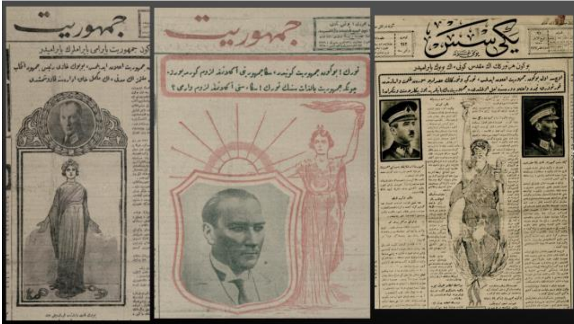
Resim 13, 14, 15. 29 Ekim 1925-29 Ekim 1926 Cumhuriyet-29 Ekim 1926 Yeni Ses

1920'lerin ikinci yarısında daha çok yönlü çizimlerle karşılaşılmaktadır. 29 Ekim 1928 tarihli Son Saat gazetesinin ilk sayfasındaki görsel, bu açıdan çarpıcı örneklerden biri olarak kabul edilebilir. Görsel içine yerleştirilmiş «Büyük Gazi, bağışladığım Cumhuriyeti kutlularız.» cümlesi aslında içeriği bütünüyle tanımlamaktadır. Bununla birlikte görsel içindeki figürler ve temanın pek de bir tanıtım söylemine ihtiyaç duymadığı ileri sürülebilir. Grafik çizimin merkezinde Mustafa Kemal Paşa'nın vesikalik boyutundaki profil fotoğrafı bulunuyordu. Bir yanda, askerlerle, uçaklarla, gemilerle, binalar ve dönen çarklarla hem sanayi ve teknoloji hem de savunma açısından kalkınma; diğer yanda da demiryolu, elektrik-telgraf direkleri, fabrika, tarladaki köylü ve buğday başaklarından oluşan figürlerle çok yönlü üretim, bir çağdaşlaşma modeli tanımlanmıştı. En önemlisi bu modelin kurucusuna işaret edilmekteydi ki bunlar, biraz da Türkiye'nin hayatında Mustafa Kemal'in yeri ve liderliğinin zamanla