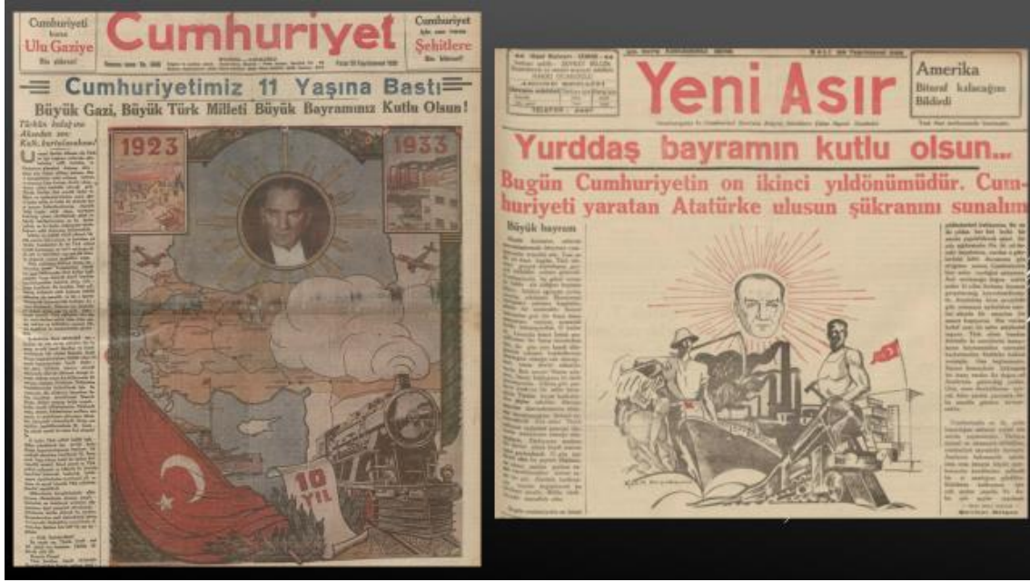
Resim 21, 22. 29 Ekim 1933 Cumhuriyet-29 Ekim 1935 Yeni Asır

Cumhuriyet'in 10. Yıl Kutlamaları sırasında Cumhuriyet gazetesi 29 Ekim sayısında eski-yeni, yani cumhuriyet öncesiyle 10. Yıl'ın karşılaştırmasına dayanan bir görseli kamuoyuna sunmuştu. Görselin çerçevesini harap bir ülkeden sanayileşmiş ve kalkınmış Türkiye'ye uzanan çizgiler oluşturmuştu. Görselde de Hatay'ın Türkiye'ye dahil olmadığı Misak-ı Milli sınırları etrafında uçaklar, demiryolları, askeri gemiler resmedilerek işgalden gerçek kurtuluşa ülkenin hikayesi özetlenmişti. Bu arada Ankara ve İzmir'deki Atatürk heykelleri işaretlenerek Atatürk odaklı sanatsal gelişme de ihmal edilmemişti. Üstelik bunların hepsinin üstünde Mustafa Kemal (Atatürk), Türkiye'nin güneşi olarak ışıldıyordu ( Cumhuriyet , 29 Ekim 1933, s.1).