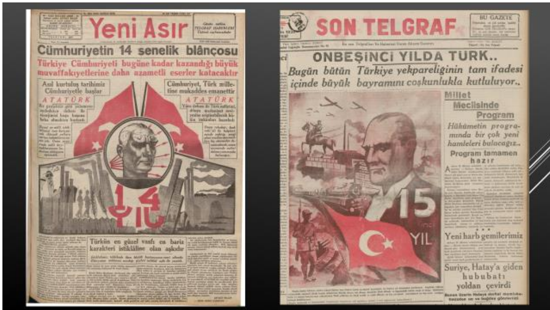
Resim 25, 26. 29 Ekim 1937 Yeni Asır-29 Ekim 1938 Son Telgraf

Bir yıl sonra Yeni Asır 'ın 29 Ekim tarihli ve Vedat imzalı ilk sayfa görseli, bol figür ve sembol içermekteydi. Kırmızı renk ve bayrak temasıyla milliyetçiliği öne çıkartırken grafik çizim çerçevesinin geneli benzer örneklere göre daha soluk renkler içermişti. Mustafa Kemal