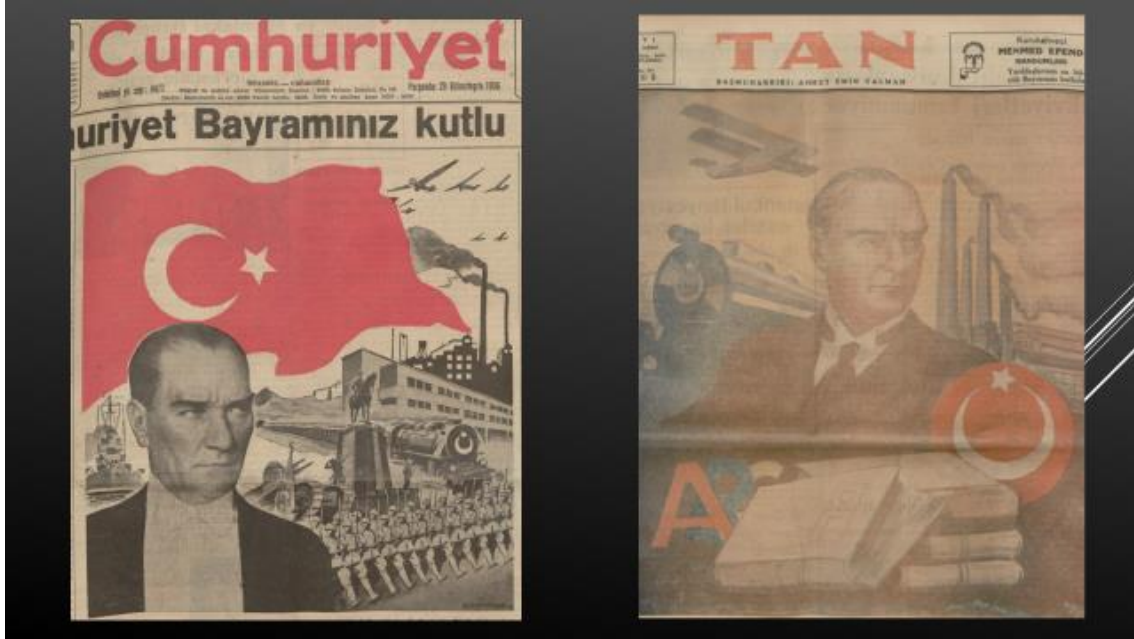
Resim 23, 24. 29 Ekim 1936 Cumhuriyet-29 Ekim 1936 Tan

bütün askerlerin yüzü ön plandaki Atatürk'e dönüktür ki kuşkusuz bu, O'nun ülke yaşamındaki konumunu belirlemektedir (Cumhuriyet, 29 Ekim 1936, s.1). Aynı tarihli Tan 'da yine ilk sayfanın yarısından fazlasına yayılan daha az figür ve simge içeren bir grafik çizim yayımlanmıştı. Atatürk'ü merkeze alarak çağdaşlaşma çalışmalarını sembolize eden görsel, kitap simgeleri üzerinden özellikle dil ve tarih çalışmalarına işaretle kalkınmanın kültürel boyutuna atıf yapmaktaydı ( Tan , 29 Ekim 1936, s.1).