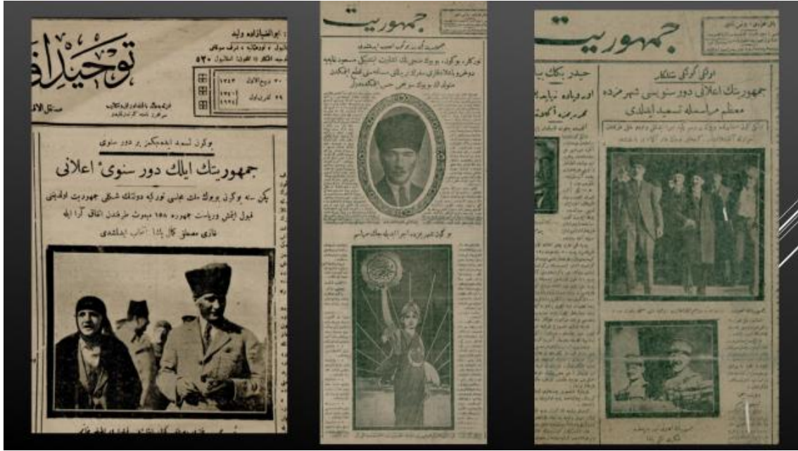
Resim 1, 2, 3. 29 Ekim 1924 Tevhid-i Efkar, 29 ve (sırasıyla) 31 Ekim 1924 Cumhuriyet

29 Ekim 1924 tarihli Cumhuriyet gazetesinin ilk sayfasındaki çizimde arkasından güneş doğan Türk bayrağına sarılı kadın, başında ortasında hilal bulunan bir defne taç takıyordu 1 ve sağ eliyle göğe doğru uzatarak cumhuriyet yazılı bir çelenk tutuyordu. Ülke, başarı-güven, barış, umut-aydınlık gelecek ve cumhuriyetin önceliğini, el üstünde tutulmasını vurgulayan; aslında fazla detay içermeyen bu çizim dışında Tevhid-i Efkar , 29 Ekim’de Mustafa Kemal Paşa ve eşinin; 31 Ekim tarihli Cumhuriyet , İstanbul’daki kutlamalardan çok etkinliklere katılan şehrin ileri gelenlerinin fotoğraflarını yayımlamıştı ( Tevhid-i Efkar , 29 Ekim 1924, s.1; Cumhuriyet , 29 Ekim 1924, s.1; Cumhuriyet , 31 Ekim 1924, s.1; Cumhuriyet , 31 Ekim 1925, s.1; Milliyet , 30 Ekim 1927, s.1).