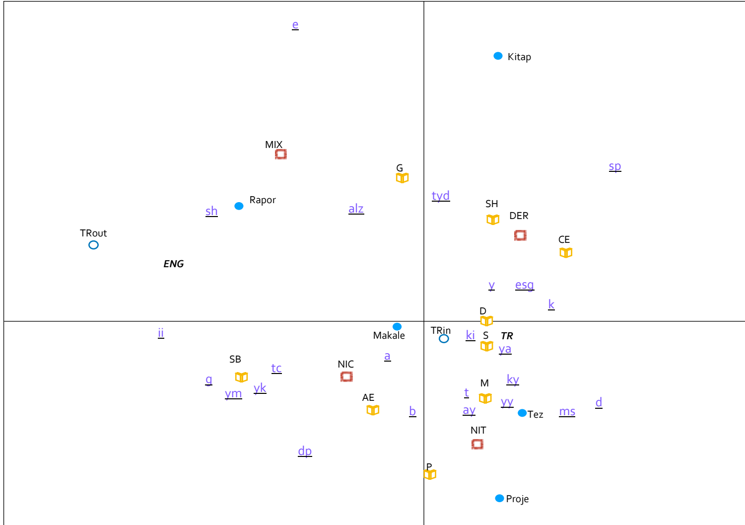
Grafik 4. Türkiye’de yaşlanma çalışmalarının güzergâhı (çoklu müttekabiliyet analizi)