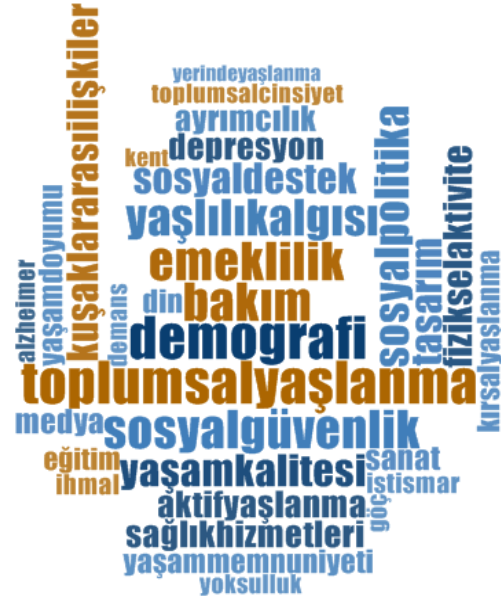
Grafik 3. Yayınların Temaları-Tema Bulutu

Yaşlanma ve yaşlılık alanında çalışılan konuların yıllar itibarıyla izlediği yörüngedeki dönüşümler oldukça dikkat çekicidir. Örneğin, 2012 yılında en çok çalışılan ilk beş konudan