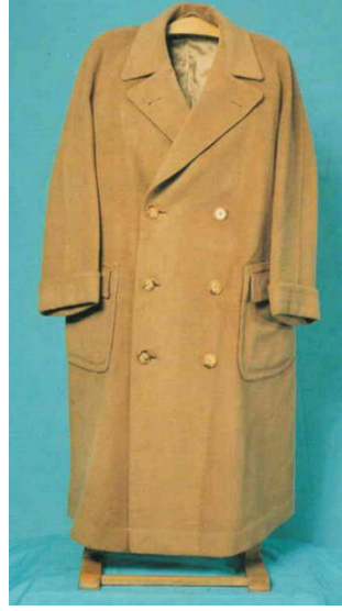
Görsel 9. Palto

Palto: Yapımında siyah yün kumaş, samur kürk ve düğme kullanılmıştır. Boyu 135 cm'dir. Kruvaze model olup rahat kesimlidir. Yakası şal yaka modelde olup samur kürkten yapılmıştır. Yanlarda kapaklı fleto cep çalışılmıştır. Kollar iki parçalı takma koldur. Birit ilik yapılmış, altı düğmelidir. Parçalar makine dikişi ile birleştirilmiştir. Kol ve etek uçları elde baskı dikişi ile tutturulmuştur. İçi samur kürkle kaplanmış, elde baskı dikişi ile paltoya tutturulmuştur.