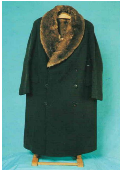
Görsel 8. Palto

Montgomeri: Malzeme olarak kahverengi süet kumaş, yün, pamuklu bej astar ve düğmeden oluşmaktadır. Ön ortasından kapamalı rahat kesimdir ve boyu 63 cm'dir. Şömiziye yakalıdır, yanlarda kapaklı aplike cep kullanılmıştır. Kollar iki parçalı takma koldur. İlikler kendi kumaşından parçalı ilik olarak çalışılmıştır. Yaka, kol uçları ve etek uçları bej yün ribanadır. Parçalar makinede dikilmiştir. Astar bej renkli poplin kumaşandır ve elde baskı dikişi ile montgomeriye tutturulmuştur. Eres - Tailor Made" markalı ve "Marinos - İstanbul" yapımıdır.