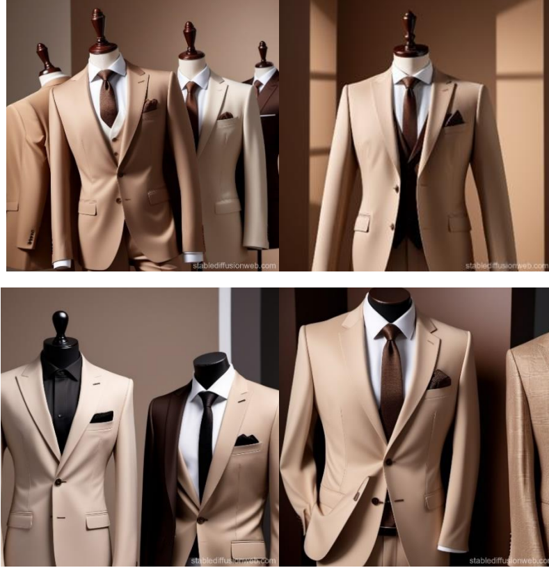
Görsel 15. Stable Diffusio XL ile Hazırlanan Koleksiyon