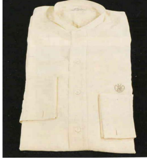
Görsel 13. Gömlek

Gömlek: Beyaz renkli poplin kumaştan yapılmıştır. Yakasız frak gömleğidir ve boyu 92 cm'dir. Uzun kollu, roba kısmı pililidir. Pili kısmında iki adet üstten, bel hizasında iki adet gizli yerleştirilmiş düğmesi vardır. Pilinin bitiminden sonra pantolona bağlanmak için iki ilikli bant bulunmaktadır. Gömlek parçaları makine dikişi ile birleştirilmiştir. Süslemeler elde yapılmıştır. Boyun kısmında içte "KEMALAT D. Grammatika" etiketi vardır. Sol kol üzerinde dirsek altında dairesel olarak "G. M. K." harfleri işlenmiştir.