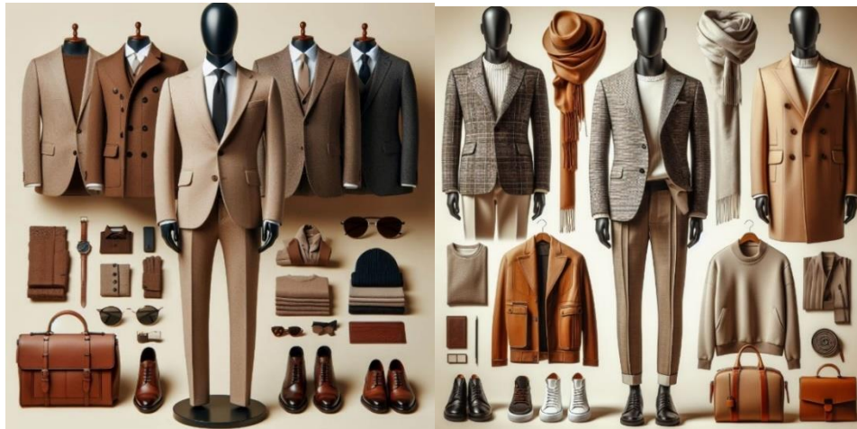
Görsel 14. Bing Image Creator ile Hazırlanan Koleksiyon

Çalışmanın bu bölümünde, Atatürk için üretken yapay zekâ araçları kullanılarak koleksiyonlar oluşturulmuştur. Koleksiyonu tanımlayıcı olarak oluşturulan prompt şu şekildedir: “2023-2024 sonbahar kış sezonu moda trendlerine uygun, cesur modern yenilikçi erkekler için, haute couture, klasik minimalist sofistike, siyah beyaz bej ve kahverengi renklerde giysi koleksiyonu”. Oluşturulan metin iki farklı yapay zeka aracına aynı şekilde girilmiş ancak farklı görseller elde edilmiştir. Oluşturulan koleksiyonlara ait görsellerden seçilenler aşağıda sunulmuştur.