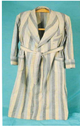
Görsel 10. Robdöşambr

Palto: Yapımında açık kahverengi kaşmir kumaş, kahverengi saten astar ve düğme kullanılmıştır. Palto kruvaze kapama olup geniş kesimlidir. Yakası bel hattına kadar açık röverli erkek yakadır. Ön bedende yanlarda kapaklı aplike cep çalışılmıştır. Reglan kol kullanılmıştır ve kol üstü dikişlidir. Kol uçlarına kendi kumaşından bant geçirilmiştir. Ön kapamada altı, arkada kemerin üzerinde iki tane düğmesi vardır. Parçalar makinede dikilmiştir. Etek ucu ve koldaki bantlar elde bastırılmıştır. Cep kenarları, ön ortası, yaka kenarları elde dikilmiştir. Kahverengi satenden yarım astar çalışılmıştır. Astar elde baskı dikişi ile paltoya tutturulmuştur.