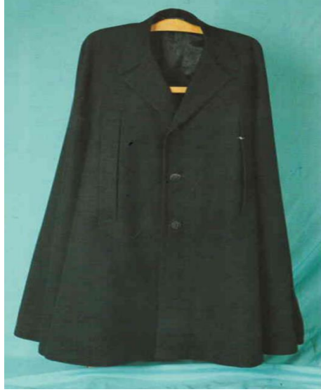
Görsel 4. Pelerin

Pantolon: Yünlü siyah kumaş, düğme ve sutaşı malzemeleri kullanılmıştır. Düz kesimli olan pantolonun boyu 98 cm'dir. Bel kısmında askı düğmeleri arkasında ise kısa bel kemeri vardır. Beli pervazla temizlenmiştir. Her iki yanında yan dikişlerden açılan cepler ve arkada tek fleto cep çalışılmıştır. Parçalar makine dikişi ile tutturulmuş, paçalarda elde baskı dikişi kullanılmıştır. Pantolon yan dikişleri üzerine siyah sutaşından biye geçirilmiştir.