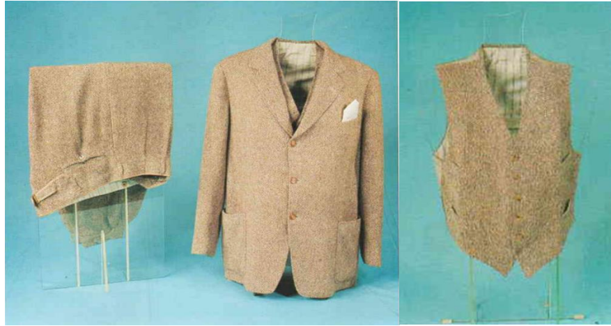
Görsel 2. Spor Takım Elbise

Pantolon: Malzeme olarak yünlü hâkî kumaş, yünlü kırmızı kumaş, pamuk astar ve düğme kullanılmıştır. Pantolon düz kesimlidir ve boyu 98 cm'dir. Önde iki yanda yan dikişlerde açılan cepler, arkada sol tarafta fleto cep çalışılmıştır. Bel kısmında askı düğmeleri ve arkasında kısa bel ayarlama kemeri vardır; ayrıca beli pervazla temizlenmiştir. Parçalar makinede tutturulmuş, paçaların temizliği elde baskı dikiş tekniği ile çalışılmıştır. Yanlarında belden paçaya kadar inen ince şerit bunun her iki tarafında 4 cm genişliğinde kırmızı renk bant bulunmaktadır. Aksesuar olarak kullanılan şapkanın yüksekliği 15 cm çapı 31 cm'dir. Siperliği kahverengi olan şapkanın etrafını dolanan bant ve öndeki kokart sim işlemelidir.