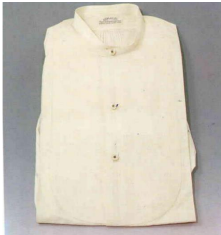
Görsel 12. Gömlek

Pijama pantolonu: Yapımında beyaz ve yeşil ipek kumaş kullanılmıştır. Pantolon modelinde kesilmiştir, boyu 105 cm'dir. Beli pervazla temizlenmiştir ve püsküllü kuşağı vardır. Parçalar makinede tutturulmuştur. Paçaları elde bası dikişi ile temizlenmiştir. Yan dikişlerine yeşil şerit biye geçirilmiştir.