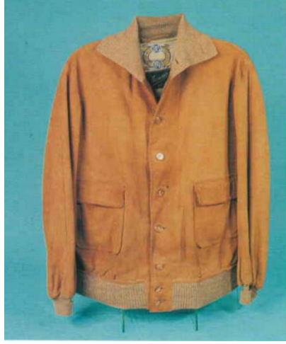
Görsel 7. Montgomeri

Yelek: Yünlü lacivert kumaş, çizgili beyaz ipek astar ve düğmeden oluşmaktadır. Önden tek sıra kapama tercih edilmiş ve altı düğme kullanılmıştır. İki yanda ve göğüs üzerinde cepler vardır. Yakası beden hattına kadar açık V yakadır. Sırt kısmı lacivert astar kumaşandır. Parçalar makinede tutturulmuştur. Etek ucu elde baskı dikişi ile tutturulmuştur. İlikler elde açılmıştır. Astar olarak boyuna çizgili beyaz renk ipek astar kullanılmıştır. Astar parçaları makinede dikilmiş, yelege elde baskı dikişi ile tutturulmuştur.