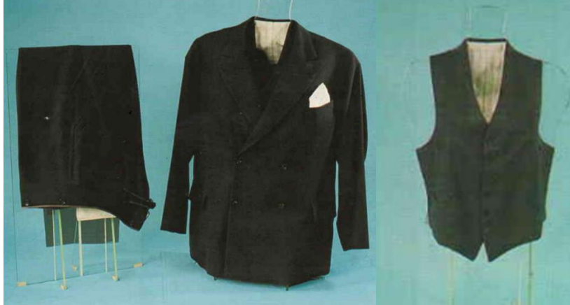
Grsel 6. Takım elbise

Yelek: Ynl siyah kumař, ipek siyah astar, dğme ve sutařı kullanılmıřtır. nden kapamalı olup bedene oturtmak iin pens kullanılmıřtır, boyu 55 cm'dir. Yakası belden 5 cm yukarıdan bařlayan řal yakadır. Kapama iin drt dğme arka arkaya yerleřtirilmiřtir. Her iki yanda fleto cep kullanılmıřtır. Etek ucu n ortasında sivrilerek yanlara doęru bele aklařmıřtır. Paralar makine dikiři ile birleřtirilmiřtir. Etek uları elde baskı dikiři ile dikilmiřtir. İlikler elde aılmıřtır. Siyah ipek astar kullanılmıřtır. Astar paraları makinede dikilmiř, yeleęe elde baskı dikiři ile tutturulmuřtur. Yaka kenarlarına siyah sutařı dikilmiřtir.