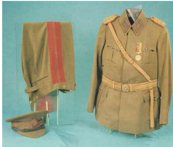
Görsel 1. Mareşal Üniforması

Anıtkabir Atatürk Müzesi’nde sergilenen 23 adet giysiye uygulanan gözlem formu ile elde edilen bulgular aşağıda yer almaktadır.