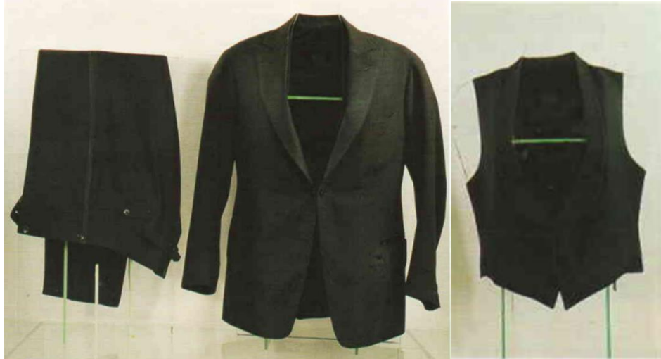
Görsel 5. Smokin

Pelerin: Malzeme olarak siyah yünlü kumaş, siyah ipek astar ve düğme kullanılmıştır. Boyu 150 cm'dir. Ön ortasından kapamalı kloş kesimlidir. Yakası beden hattına kadar açık röverli erkek yakadır. Ön bedende 30 cm uzunluğunda iki cep yeri bulunmaktadır Arka ortası dikişlidir. Parçalar makine dikişi ile birleştirilmiş, etek uçları elde baskı dikişi ile çalışılmıştır. İlikler elde açılmıştır. Astar olarak siyah ipek astar kullanılmıştır. Parçalar makine dikişi ile dikilmiş, elde baskı ile pelerine geçirilmiştir. Kumaş kaplı üç düğme kullanılmıştır.