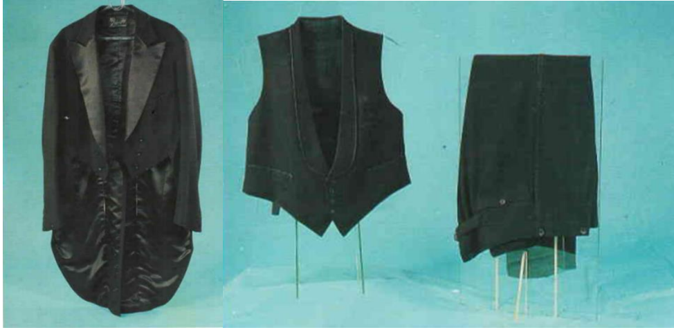
Görsel 3. Frak takımı

Yelek: Malzeme olarak tüvit kumaş, astar ve düğme kullanılmıştır. İçi beyaz çizgili, sırt kısmı bej renkte astar kumaştandır, boyu 56 cm'dir. Ön ortasından kapamalı, düz kesimli olup penslerle bedene oturtulmuştur. Yakası beden hattına kadar açık V yakadır. İki yanda ikisi göğüs üzerinde olmak üzere toplam dört adet fleto cep çalışılmıştır. Sırt kısmı bej renk astar kumaştandır. Parçalar makinede tutturulmuş, etek ucu elde baskı dikişi ile çalışılmıştır. İlikler elde açılmıştır. Astar olarak beyaz boyuna çizgili astar kullanılmıştır. Astar parçaları makinede birleştirilmiş, yelege elde baskı dikişi ile tutturulmuştur.