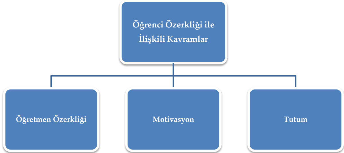
Şekil 3. Öğrenci Özerkliği ile İlişkili Kavramlar

Yapılan alanyazın taraması sonucunda, öğrenci özerkliği ile ilişkili temel kavramların; öğretmen özerkliği, motivasyon ve tutum kavramları olduğu görülmektedir. Öğrenci özerkliğinin ilişkili olduğu temel kavramlar, Şekil 3'te gösterilmiştir.