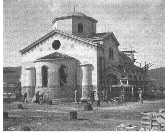
Fig. 4. 1942 yılında inşa edilen kilise (Shkreli 2018).

Tiran'ın başkent olarak tayin edilmesinin ardından İtalyan Mimar Armando Brazini şehir düzenlemesi için Tiran'a davet edilmişti. Brazini'nin hazırladığı plana göre kilisenin olduğu yere cumhurbaşkanlığı sarayı inşa edilecekti. Bu amaçla kilise de kamulaştırılarak 1937 yılında yıkılmıştı. Bu kilisenin kamulaştırılmasından elde edilen parayla 1942 yılında Tiran sınırları içerisinde başka bir yere yeni bir kilise inşa edilmişti (Fig. 4) (Shkreli 2018).