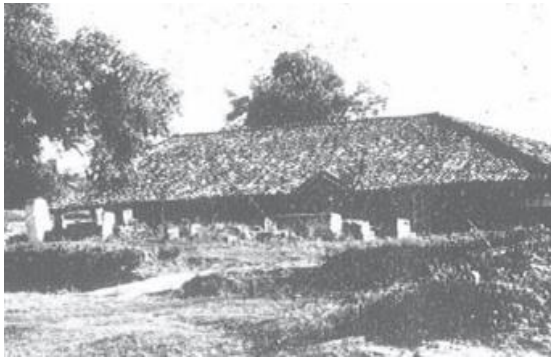
Fig. 3. 1937 yılında yıkılan eski kilise (Shkreli 2018).

Kilise 22x13 m ölçülerinde olup alçak duvarlara sahipti (kaynakta verilen ölçüler belgelerde geçen zirâ birimindeki ölçülerle uygunluk göstermektedir. Bu hesapla duvarlar da yaklaşık 10-11 m yüksekliğe sahip olmalıdır). Kilisenin üzeri kırma çatıyla örtülmüştü. Kiliseye girişi sağlayan iki adet kapısı bulunmaktaydı. Yapının dış cepheleri sade olmasına rağmen iç cepheleri fresklerle bezenmişti (Shkreli 2018). Kiliseye dair yalnızca dış görünüşünü algılayabileceğimiz bir görsele ulaşılabilmıştır (Fig. 3).