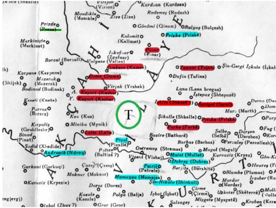
Fig. 1. Tiran'ın Çevresindeki Yerleşimleri Gösteren Harita (İnalçık 1987)

Tiran adının kökeniyle ilgili çeşitli görüşler öne sürülmüş olsa da bu konuda kesin bir yargı ortaya koymak mümkün görünmemektedir. Şehrin tarihinin en az 3.000 yıl geriye dayandığı Arnavutların kökenini oluşturduğu söylenen İirlere ait yer adlarının bugün de kullanılıyor olmasından anlaşılmaktadır (Kiel 2012, 193). Bu döneme dair elimizde fazla bilgi bulunmamasıyla birlikte en detaylı kayıtlar Osmanlı Dönemi'nde tutulmaya başlanmıştır. Bölgenin M 1431/2 (H 835) tarihli ilk tahririnde doğrudan Tiran adının geçmemesi burada bir yerleşimin olmadığını göstermektedir (İnalçık 1987). Bugünkü Tiran civarındaki köylerin nüfusları 2 ile 41 hane arasında değişmekte, ortalamada ise 15 hanelik nüfusa sahip oldukları görülmektedir. Köylerin günümüzdeki konumları tespit edildiğinde Tiran'ın olduğu yerin boş bir arazi olarak bırakıldığı anlaşılmaktadır. Tespit edilen köyler şu şekildedir: Şin Nikola (8 hane), Lalm (41 hane), Priske (13 hane), Pınar (9 hane), Tuzani (2 hane), İşkliz (10 hane), Suriyel (14 hane), Farke (22 hane), Mulet (12 hane), Petril (3 hane), Mumayza (5 Hane), Andonik (23 hane), Kuşar (23 hane), Dome (14 hane), Kimbeze (4 hane) (İnalçık 1987, 103, 104, 106, 107, 109, 111, 114, 115, 117, 119, 120) (Fig. 1).