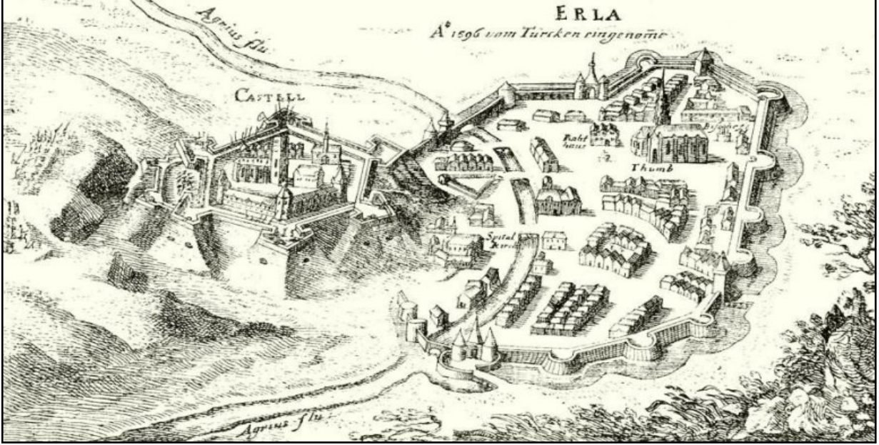
Resim II: Eğri Kalesi'nin 1596 Yılında Genel Görünümü

(Kaynak: Gróf Zrínyi Miklós (1620-1664) , Széchy Károly (szerk.), 163)