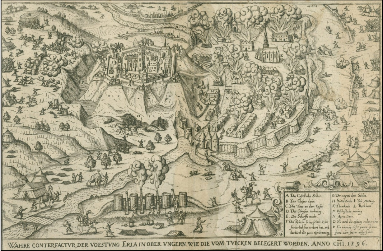
Resim II: 1596 Yılında Eğri Kalesi'nin Osmanlı Ordusu Tarafından Kuşatılması