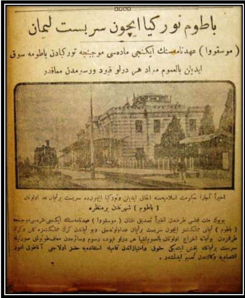
EK – 5) Moskova Antlaşması üzerine Tevhid-i Efkâr gazetesindeki “Batum Türkiye İçin Serbest Liman” başlıklı haber ( Tevhid-i Efkâr , 14 Eylül 1337/1921, n. 95(3123), s. 1).