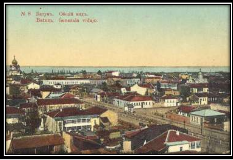
EK 1. Batum şehir manzarası ( http://archives-ajara.gov.ge/index.php?rf=photogallery&galid=1&lang=en , Erişim Tarihi: 01.06.2017).