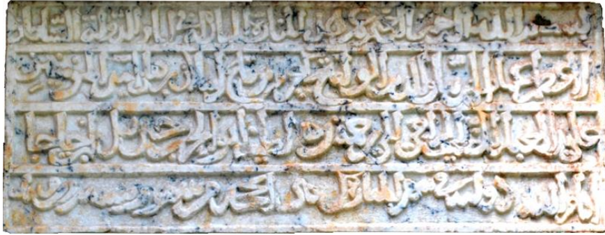
Fig. 4. Cacaoğlu Nureddin'in Minare İnşa Kitabesi