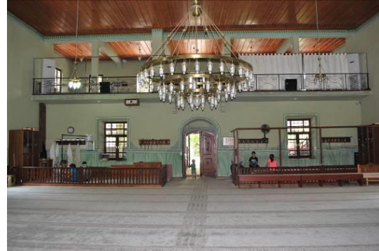
Fig. 12. Harimin Güneyden Görünüşü

Yuvarlak kemerli kavsaraya sahip mihrap nişinin etrafını ikisi düz, biri içbükey diğeri dışbükey dört bordür çevrelemektedir. Kavsaranın üzerindeki dikdörtgen alınlıkta Kur'ân-ı Ker'im, Âli İmrân Sûresi 39. Ayet'ten bir bölüm " Fe nâdetul melâiketu ve huve kâimun yusallî fil mihrabi "= Anlamı: O kalkmış mihrapta namaz kılıyor iken, melekler kendisine şöyle seslendiler (Yazır 2002, 49) kalemîsi olarak yazılmıştır. Mihrabın kavsarası, nişi ve bordürleri kalemîşleri ile süslenmiştir. Kavsaradaki oval madalyonun içerisinde, mavi zemin üzerine işlenmiş çiçek buketi yer almaktadır. Niş içerisindeki kırmızı renkli perde kompozisyonu iki kordon ile yanlara toplanmış olup, zemine kadar uzanmaktadır. Aşağı doğru kademeli bir şekilde daralan perdeye, üst kısmındaki pileler ve renk tonlamaları derinlik kazandırmıştır. Perdenin ortasında askılı bir kandil sarkmaktadır. Mihrap nişini çevreleyen birinci bordürü; yeşil, kırmızı, kahverengi ve mavi renklerle boyanmış soyut bitkisel bezemeler, üçüncü bordürü ise rumilerin çevrelediği palmet motifinin birbirine ulandığı kompozisyon süslemektedir. Mihrap çerçevesinin üst kısmı, palmetlerle süslenmiş alçı bir tepelik ile nihayetlenmektedir. Tepeliğin kenarlarındaki palmetler yarım, aradakiler ise ortadaki daha büyük olmak üzere tamdır. Kavsaranın ortasındaki büyük palmetin altında, iki yandan uzanan kıvrım dal ve üzerindeki yapraklar ile sınırlandırılmış