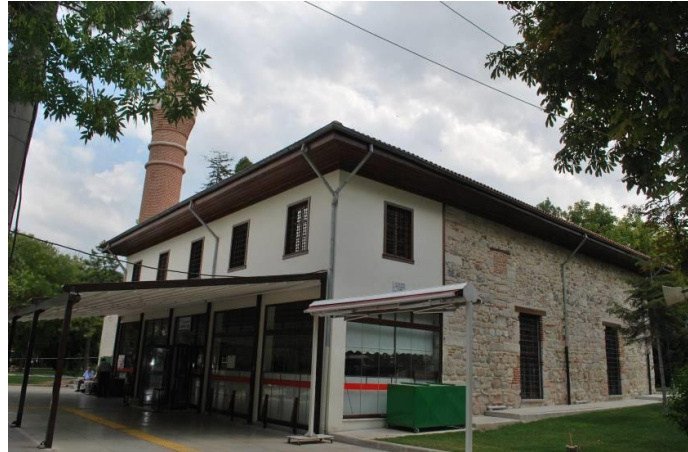
Fig. 1. Eskişehir Alâeddin Camisi'nin Genel Görünüşü

Cami, Eskişehir merkezde, kendi adıyla anılan park içerisinde yer almaktadır. Yapıdaki tek kitabe minare üzerinde olup 1268 yılına aittir. Kitabede minarenin banisinin Caca oğlu Cibril olduğu yazılıdır. Camiye ait inşa kitabesinin bulunmaması yapının kim tarafından, hangi tarihte yapıldığını tespiti imkân tanımamaktadır. Yapı ile ilgili arşiv belgelerinde baninin Selçuklu Sultanı Alâeddin olduğu ifade edilmektedir. Ancak bunun hangi Sultan Alâeddin olduğundan bahsedilmemektedir.