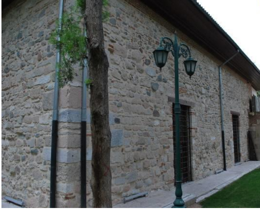
Fig. 5. Doğu Cephe Genel Görünüşü

Kitabeden minarenin Selçuklu sultanı III. Gıyâseddin Keyhusrev zamanında, Caca oğlu Cibril tarafından 1268 yılında yaptırıldığı anlaşılmaktadır. Bitişindeki ikinci minare; kare kaideli, silindirik gövdeli, tek şerefeli olup, kademeli bir külahla nihayetlenmektedir. Minarenin şerefe altı ve pabuçtaki silmeleri ile kaidesinde taş, diğer kısımlarında ise tuğla malzeme kullanılmıştır.