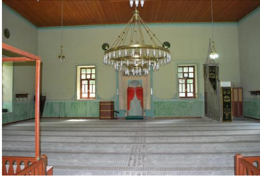
Fig. 11. Harimin Kuzeyden Görünüşü

Caminin harimine basık kemerli mermer kapı açıklığından geçildikten sonra ulaşılmaktadır. Tek mekânlı harimin üzeri, kirişlemesi alttan kaplamalı ahşap tavan ile örtülü olup, ortasında sekiz dilimli ahşap bir kubbe yer almaktadır (Fig. 11-12). Dört cephesindeki ikişer pencere ile aydınlatılan harimin güney cephesine, kapı ile aynı aksta yarım daire nişe sahip taş mihrap yerleştirilmiştir (Fig. 13-14). Nişin üzeri yuvarlak kemerli bir kavsara ile örtülüdür.