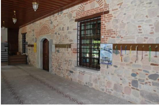
Fig. 9. Son Cemaat Mahali Genel Görünüşü

ortasındaki balkon harime doğru çıkıntı yapmaktadır. Caminin harime açılan kuzey cephesinde, basık kemerli kapı açıklığıyla iki yanında birer dikdörtgen pencere açıklığı yer almaktadır. Kapı ve pencerelerin üzerine tuğladan yapılmış sivri tahfif kemerleri yerleştirilmiştir (Fig. 9).