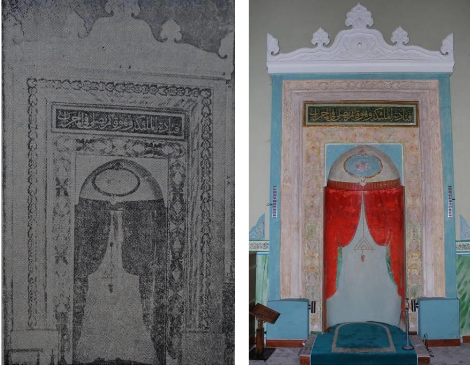
Fig. 13-14. Mihrabın Eski (Aslanbay 1955, 52) ve Yeni Genel Görünüşü

Başbakanlık Osmanlı Arşivi'nde yer alan belgeler, caminin belirli bir tarihi süreç içerisindeki seyri hakkında bazı bilgilere ulaşılmasına imkân sunmaktadır. İncelenen belgelerden caminin 19. yüzyılın son çeyreğine gelindiğinde oldukça harap bir durumda olduğu anlaşılmaktadır. Bu doğrultuda yapının onarılması için çeşitli girişimlerde bulunduğu yazışmalardan anlaşılmaktadır.