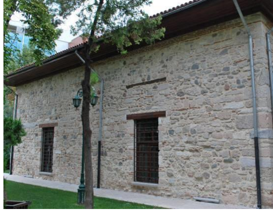
Fig. 6. Güney Cephe Genel Görünüşü