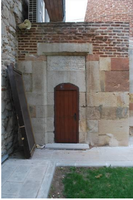
Fig. 2. Kuzeydoğu Köşedeki Eski Minare Kaidesi

kaidesi günümüze ulaşmıştır (Fig. 3). Güney cephesindeki basık kemerli kapı açıklığının üzerindeki dört satırlık celi-sülüs hatlı Arapça kitabe şu şekildedir (Fig. 4):