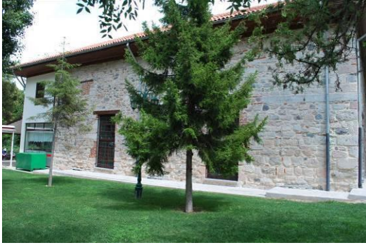
Fig. 7. Batı Cephe Genel Görünüşü