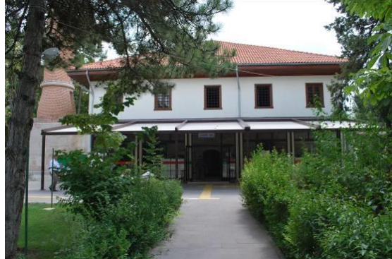
Fig. 8. Kuzey Cephe Genel Görünüşü

Caminin düzensiz örgülü beden duvarlarına bakıldığında, moloz, kesme taş, mermer ve tuğla malzemenin kullanıldığı görülmektedir. Örgü içerisindeki mermer malzemelerin devşirme olduğu üzerindeki yazı ve bezemelerden tespit edilebilmektedir. Caminin doğu ve güney cephesinde ikişer, batı cephesinde ise biri mahfile açılan dikdörtgen formlu üç pencere açıklığı mevcuttur (Fig. 5-6). Batı cephenin kuzey ucundaki izler, harime açılan bir üst pencere açıklığının tuğla ile kapatıldığını göstermektedir (Fig. 7). Kuzey cephede ikisi altta harime, beşi üstte kadınlar mahfiline açılan dikdörtgen formlu yedi pencere açıklığı bulunmaktadır (Fig. 8). Kuzey cephedeki son cemaat mahali beş betonarme kolon tarafından taşınmakta olup, (1951 yılındaki onarım öncesinde bu kısım altı mermer direk tarafından taşınmaktaydı (Aslanbay 1955, 14) kuzey ve batı cepheleri açıktır (Fig. 9). Açık olan cepheler günümüzde şeffaf cam-çerçeve ile çevrilidir. Son cemaat mahalinin doğusundaki merdiven ile harime dahil edilmiş mahfile ulaşılmaktadır. Mahfil katı, doğu-batı doğrultuda uzanmakta olup, girişlemesi alttan kaplamalı ahşap tavadır. Tavan, betonarme kolon ve kirişler tarafından taşınmaktadır. Mahfil katı kuzey cephesinde beş, batı cephesinde bir pencere açıklığı ile aydınlatılmaktadır (Fig. 10). Mahfilin güney cephesinin