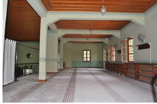
Fig. 10. Mahfil Katı Genel Görünüşü

Caminin harimine basık kemerli mermer kapı açıklığından geçildikten sonra ulaşılmaktadır. Tek mekânlı harimin üzeri, kirişlemesi alttan kaplamalı ahşap tavan ile örtülü olup, ortasında sekiz dilimli ahşap bir kubbe yer almaktadır (Fig. 11-12). Dört cephesindeki ikişer pencere ile aydınlatılan harimin güney cephesine, kapı ile aynı aksta yarım daire nişe sahip taş mihrap yerleştirilmiştir (Fig. 13-14). Nişin üzeri yuvarlak kemerli bir kavsara ile örtülüdür.