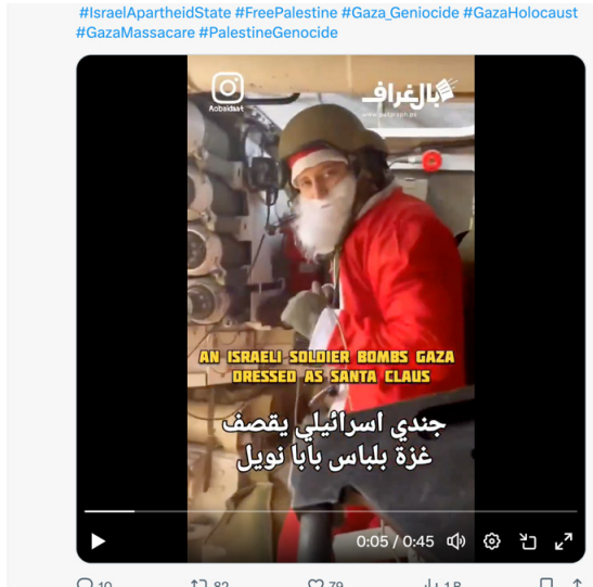
Resim 4. Noel Baba kıyafeti giymiş bir İsrail askeri