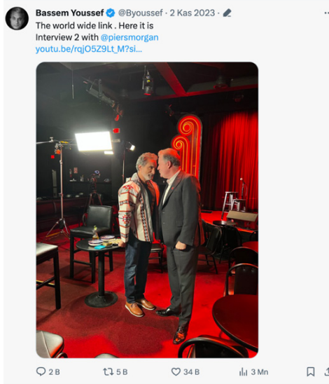
Resim 1. Bassem Youseff'in programla ilgili attığı tweet

Youseff'un ikinci programa dair yaptığı tanıtım paylaşımı bile 3 milyon kişi tarafından görülmüştür. Bu paylaşımında gergin geçen ilk oturuma bir atıf yapılarak ikinci oturumunda gergin geçtiği ya da geçeceği anlatılmak istenmiştir.