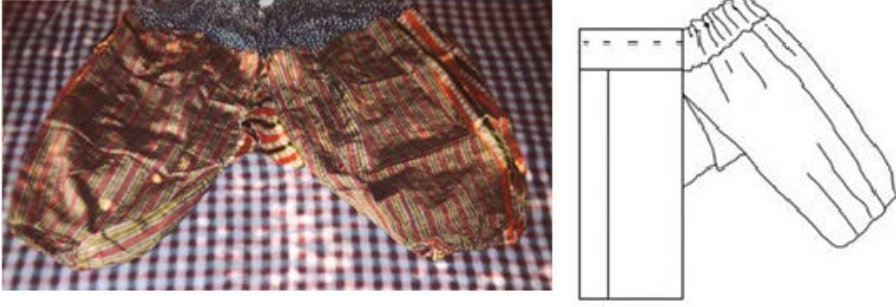
Şekil 3. Kõnçek ve biçimsel çizimi

Şekil 3'deki kutnu dokumadan yapılmış olan kõnçekin oldukça geniş olan beli uçkurla toplanmıştır. Beldeki 10 cm genişliğindeki basma kumaştan ek parçası uçkur yerinin de olduđu kısımdır. Düz bol paçaların arasına yerleştirilmiş olan kare şeklindeki kuş parçası ile ağ formu oluşturulmuş olan kõnçekin, yanlarına farklı kumaştan ek parçaları ile genişletilmiş paçaları ve aynı kumaştan ağ parçası dikkat çekicidir. Paça uçları lastikle toplanmıştır.