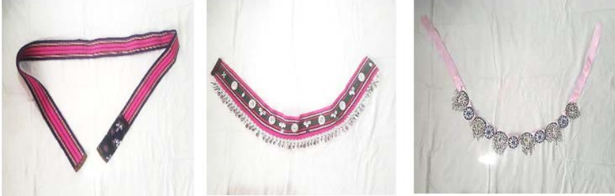
El dokuma kemer

Kemer: giysiyi toplamak, beli sarmak gibi işlevsel özelliklerinin yanı sıra görüntü ve süslenmek amacıyla da kullanılan kemerler, Türk halk giyiminin önemli tamamlayıcı unsurlarıdır. Üzerinde taşıdıkları sembol, motif, değerli/değersiz taş ve metaller vb. birçok öge ile kullanıldığı toplumun kültürel mesajlarını da yansıtır. Bu nedenle, kemerlerin özelliklerinin değişime uğraması pek çok anlamın da yok olması anlamını taşımaktadır. Karıncalık köyü kadınlarının deyrerinin bellerine taktıkları kemerlerde bu değişim açıkça görülebilmektedir.