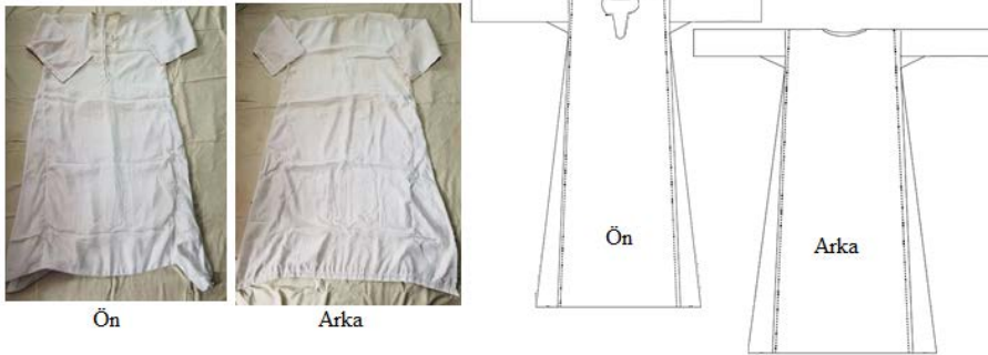
Şekil 4. Gõynek ve biçimsel çizimi

Gõynek/İç elbise :Karıncalık köyü kadınlarının geleneksel giyim kuşamlarında üst bedende ten üzerine giyilen, ayak bilekleri uzunluğundaki gõynek, Gülizar Kurt'un evlendiğinde çeyizinde yer alan yaklaşık 40 yıllık bir iç giysidir ve üzerinde bir değışiklik yapılmamıştır.