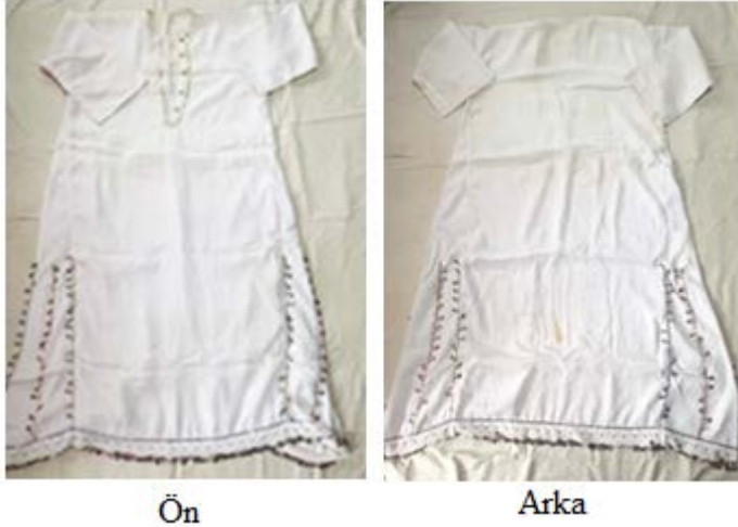
Şekil 5. Günümüzde üretilmiş süsleme özellikleri değişime uğramış göyneğ

ancak özel günlerde giyilen gömleklerin yaka çevresi, yırtmacı, kol ve etek uçları oyalar ve işlemelerle süslenmektedir. Koca - Vural'ın (2013), geleneksel Türk giyimini bir parçası olan göyneğin biçim olarak benzerlik göstermelerine rağmen, yakasız veya ince dik yaka formunun dışında yaka çevresi, kol ağzı ve etek uçlarına oya ve işlemelerle oluşan süslemeler yapılmış türleri de bulunduğunu, ipek, pamuk, keten veya ikili karışımlarından üretildiklerini, kısa olanlarının erkek, uzun ve bol olanlarının ise kadınlar tarafından iç giysi olarak kullanıldıklarını belirtmeleri de bu bilgileri destekler niteliktedir.