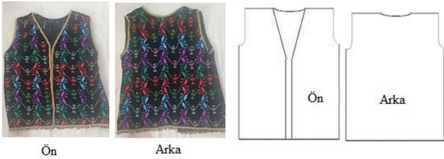
Şekil 7. Yelek ve biçimsel çizimi

Şekil 7'deki kadife yeleğin kaynak kişi Gülüzar Kurt tarafından dikildiği ve 20-25 yıl önceye tarihlendiğinin belirtilmesi nedeniyle diğer giysilere göre daha yeni olduğunu söylemek mümkündür. Yelek kumaşının desenli kadife olması ve bu kumaşın umreden getirildiğinin belirtilmesi de bu söylemi desteklemektedir. Ayrıca, eski dönemlerde kutnu ve diğer yöresel dokumaların yanı sıra düz kadifeden de dikilen yeleklerin kullanıldığı ve yelek ve cepkenlerin günlük yaşamda dışarı çıkarken giyilen giysiler olduğu da vurgulanmıştır