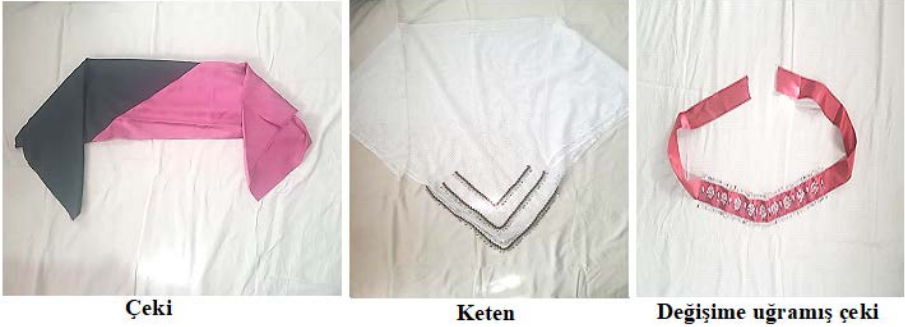
Şekil 10. Baş bağlamada kullanılan çeki, keten ve değişime uğramış çeki