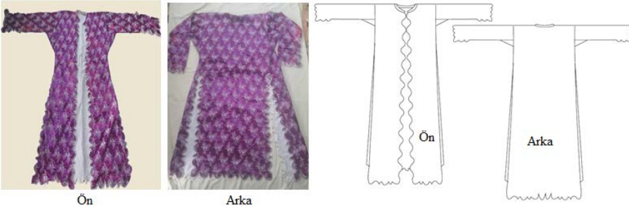
Şekil 6. Değre/Deyre (üçetek) ve biçimsel çizimi

Şekil 6'daki mor renk zemin üzerine gümüş rengi sıralı çiçek desenleri olan ipeklî kumaştan yapılmış deyre, ön ve arka beden bütün ve omuz dikişleri olmayan bir kesime sahiptir. Deyrenin boyu ayak bileğine kadar uzunluktadır ve iki yan dikişinde etek ucundan bele kadar uzanan (72cm) derin yırtmaçları bulunmaktadır. Kol formu göyneğin kolu ile aynı kesim özelliğinde olup kol ağzı alt dikişinden yırtmaç bırakılarak çevresi oyuntulu şekilde biçimlendirilmiştir. Uç uca kapamalı olan deyrenin 3 cm genişliğinde ince dik yakası vardır. Etek ucu, yırtmaçlar ve kapama kenarları, kol ağzı çevresinde olduğu gibi oyuntulu şekilde biçimlendirilmiş ve kenarları gümüş rengi kordon ile süslenmiştir. Giysi parçaları makine dikişi ile birleştirilmiş ve içi beyaz pamuklu astar ile astarlanmıştır.