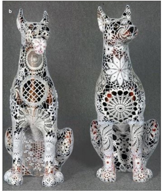
Şekil 4. a, b (a) Joana Vasconcelos, "Dantelli Piyano" (Dentelle Piano). (b) Joana Vasconcelos'a Ait Dantelle Kaplanmış Hayvan Figürleri. Kaynak: (URL-7) https://textileartcenter.wordpress.com/tag/piano-dentelle/ (26.10.2021)