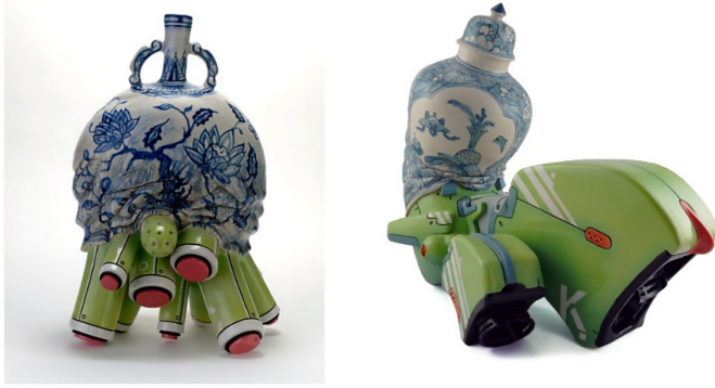
Şekil 13. Manga Ormonolu, Hibrit Koleksiyonu (Tang, 2009) (Sol). Manga Ormonolu, Hibrit Koleksiyonu (Sağ) (Tang, t.y.)