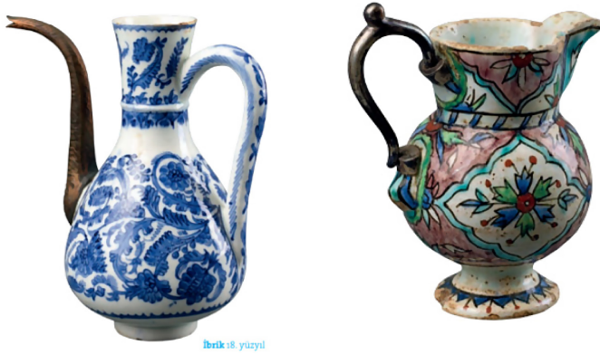
Şekil 3. Kütahya Çinisi, İbrik, 18. yy. İkinci Yarısı Pera Müzesi Koleksiyonu (Sol). Kütahya Çinisi, Sütlük, 18. yy. Pera Müzesi Koleksiyonu (Sağ) (Kutahya Tiles and Ceramics, 2016)