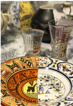
Şekil 9. Seletti Hibrit Tula Çorba Kasesi (CTRLZAK, 2021)

Seletti Hibrit-Aglaura 3'lü bardak setinde yine hibrit bir yapı görülmektedir. Burada bahsi geçen hibrit tasarım, seramik ve cam malzeme birlikteği ile oluşturulmuştur. Bu eşsiz parçalar hem kullanışlı hem de dekoratiftir. Şık sofraların temsilcisi olan kâseler, kupalar ve tabakların her biri iki farklı tarza sahip olup renkli, ilginç bir masa düzeni için mükemmel birer tasarım objesi olarak da tanımlanabilir (Şekil 11).