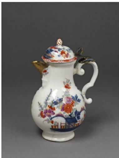
Şekil 5. 1730-1735 Kahve Kabı, Meissen Fabrikası (Victoria and Albert Museum, 2021)