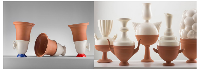
Şekil 12. Tal Batit, Hibrit Koleksiyonu (Batit, t.y.)

Tasarımların bir araya getirilmesinde fırın içi ısıdan faydalanılarak sır ile yapıştırma yöntemi kullanılmaktadır. Pişirimin kontrol edilemeyen