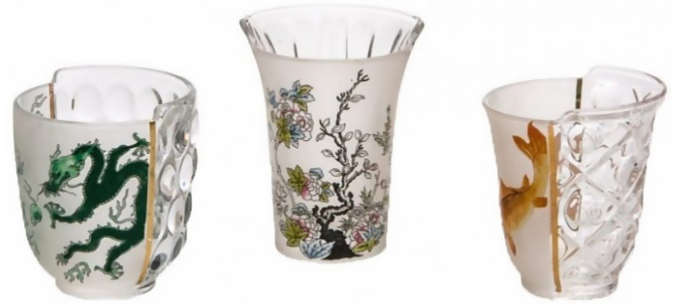
Şekil 10. Seletti Hibrit-Aglaura 3'lü Bardak Seti (CTRLZAK, 2021)