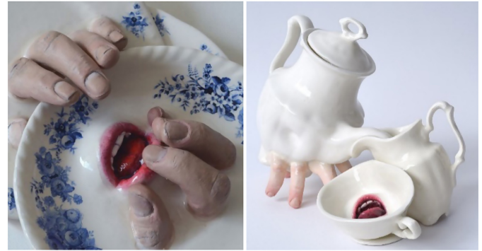
Şekil 11. Ronit Baranga'dan Gerçeklikten Uzaklaştırırken Tüyerinizi Ürpertecek Seramik Çalışmaları Breakfast, 2014 (Sol), Embraced, 2017 (Sağ) (Yıldız, 2018)

İsrailli sanatçı Ronit Baranga, hibrit heykelsi sofa ürünleri; fonksiyonel nesnelere aktif ve duyarlı nesnelere dönüştürülmüş uzantıları olarak tanımlanabilir. Son derece ayrıntılı, kimi zaman ürkütücü geleneksel seramik sofa ürünleri, ağız, parmak ve dil gibi insan uzuvları ile birleştirilmektedir (Şekil 12) (Beinart Gallery, 2021).