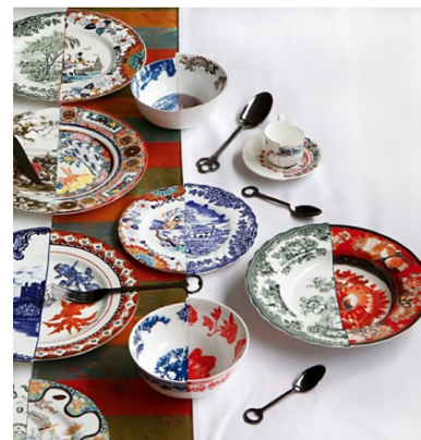
Şekil 7. İtalyan Seletti Firmasının CTRLZAK ile Tasarlamış Olduğu Hibrit Porselen Sofra Ürünleri (Gessato, t.y.)

Tasarım stüdyosunun Seletti firması için tasarlamış olduğu hibrit koleksiyon yine benzer sloganlarla yola çıkmıştır. Çin'de üretilen hibrit porselen ürünler renk, desen ve form birlikteliği ile ele alınmıştır (Şekil 7). İki farklı kültürün desen ve form özelliklerini sınırları