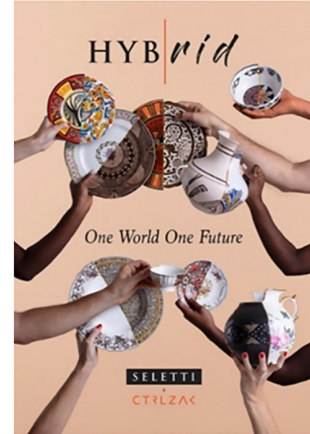
Şekil 6. İtalyan Seletti Firmasının CTRLZAK ile Tasarlamış Olduğu Hibrit Porselen Sofra Ürünleri (CTRLZAK, 2021)

günümüze sofran takımlarında kullanılan eklektik yaklaşımlar post-modern dönemde kültürler arası bağlamda değerlendirildiğinde küreselleşme ile yakın bir birliktelik kurduğu görülmektedir (Şekil 6).