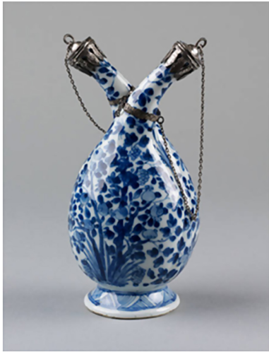
Şekil 4. 1680 – 1700, Jingdezhen, Çin, Victorian and Albert Müzesi, Yağ ve Sirke Koyulan Sofra Ürünü (Victoria and Albert Museum, 2021)