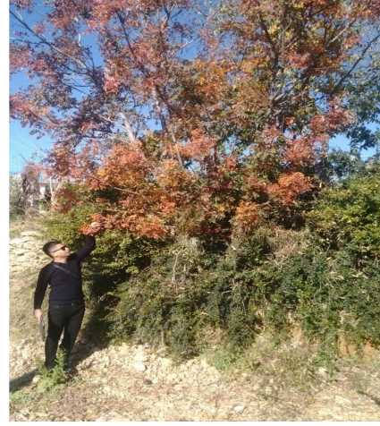
Fig. 3. Araştırma Sahasındaki bir Menengiç Ağacından Görüntü