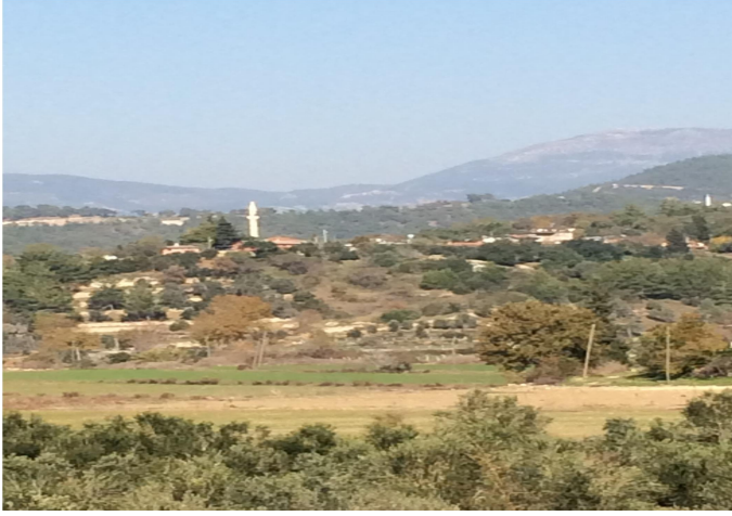
Fig. 2: Uzunlar Köyünden Genel Bir Görünüş