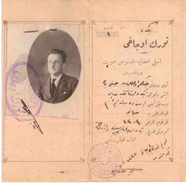
Ek1: Niğde Türk Ocağı Hüviyet Varakası (iç Kapak) (Topal 2013: 668)