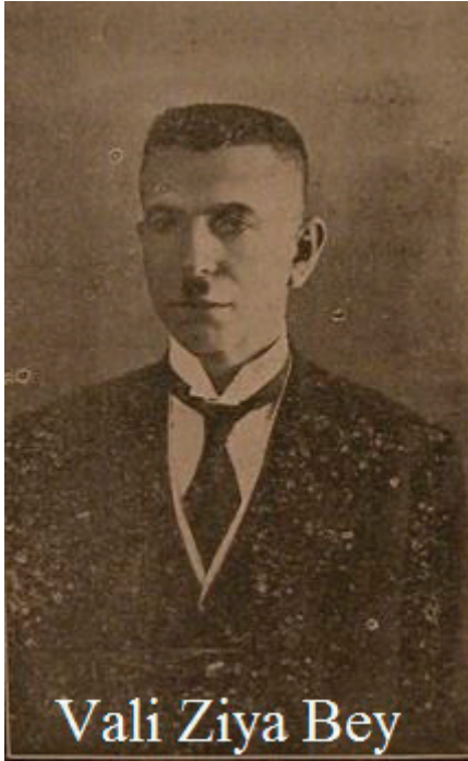
Resim 3: Vali Ziya Bey (Türk Ocağı başkanı)