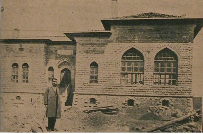
Resim 2: Aksaray Kütüphanesi (Mart 1927’de Türk Ocağı genel Kurulunun yapıldığı bina) (Aksaray Vilayet Gazetesi, nr.12, s. 1)