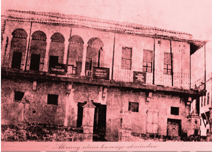
Resim 1: Aksaray Türk Ocağı Binası