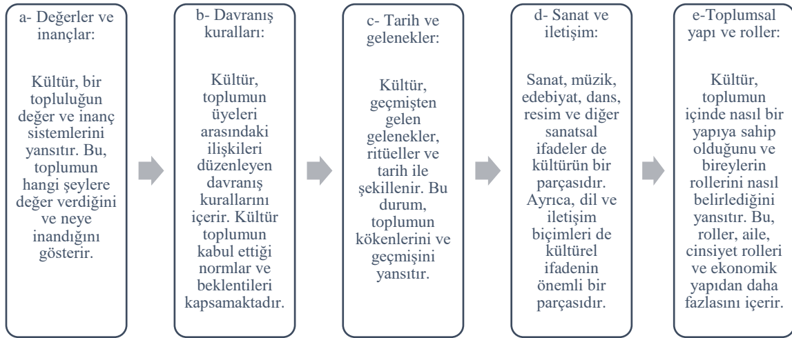
Şekil 1. Kültürün temel ortak özellikleri. UNESCO (2023) ve OECD, (2018)’ den yazar tarafından uyarlanmıştır.

Küresel eğitim, öğrencileri sadece kendi ülkeleri ve topluluklarıyla sınırlandırmaz. Bu yaklaşım, öğrencileri daha iyi bir dünya vatandaşı olarak yetiştirmelerini sağlar ve küresel sorunların çözümüne katkıda bulunmalarına yardımcı olur (Merryfield, 1995; Fiske, 2000; UNESCO, 2020). Küresel eğitimin önemli bir parçası olan kültür, toplumların, grupların veya bireylerin yaşam biçimi, değerleri, inançları, davranışları, gelenekleri, sanatları, dil ve diğer semboller aracılığıyla ifade edilen geniş bir kavramdır. Kültür, insanların bir arada yaşadığı toplulukların ortak bir bilgi, deneyim, anlayış ve yaşamlarıyla ilgili paylaşımı içerir. Bu nedenle kültür, insanların birbirleriyle iletişim kurmalarını ve bir toplum içinde nasıl davranmaları gerektiğini belirleyen kurallar ve normlar sistemi olduğu söylenebilir (UNESCO, 2023; OECD, 2018). Kültürün bilinen bazı temel özellikleri, şekil 1’de kültürel kartlar üzerinde açıklanmıştır: