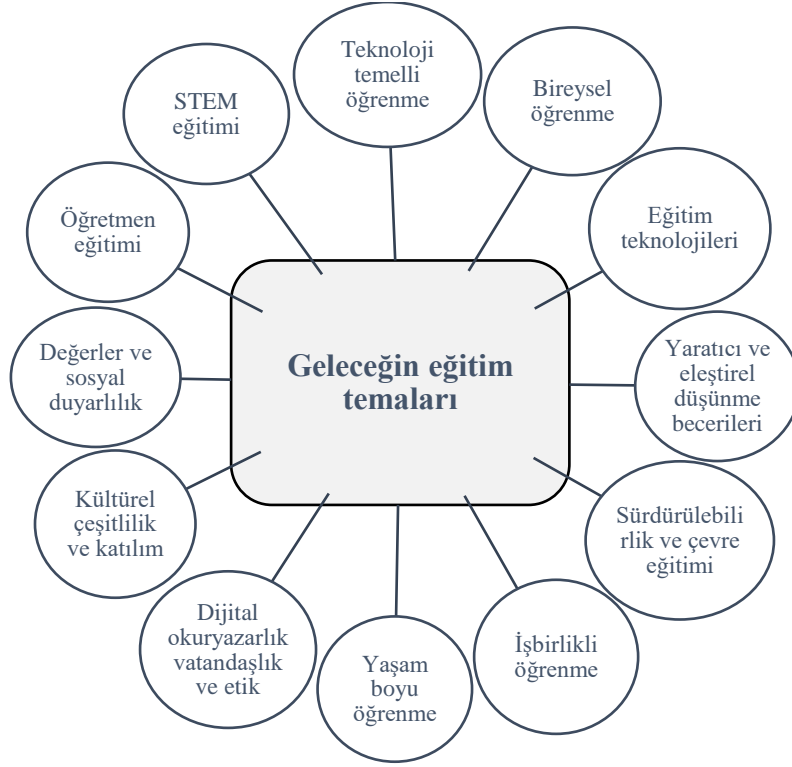
Şekil 3. Geleceğin eğitim temaları

artırmaktadır. Bu açıdan bakıldığında genel olarak geleceğin eğitim politikalarını şekillendiren önemli temalar (Ertürk Keskin, 2008; United Nations, 2023; UNESCO, 2023; CE, 2023a; UE, 2023; OECD, 2018; WB, 2023), şunlar olabilir: