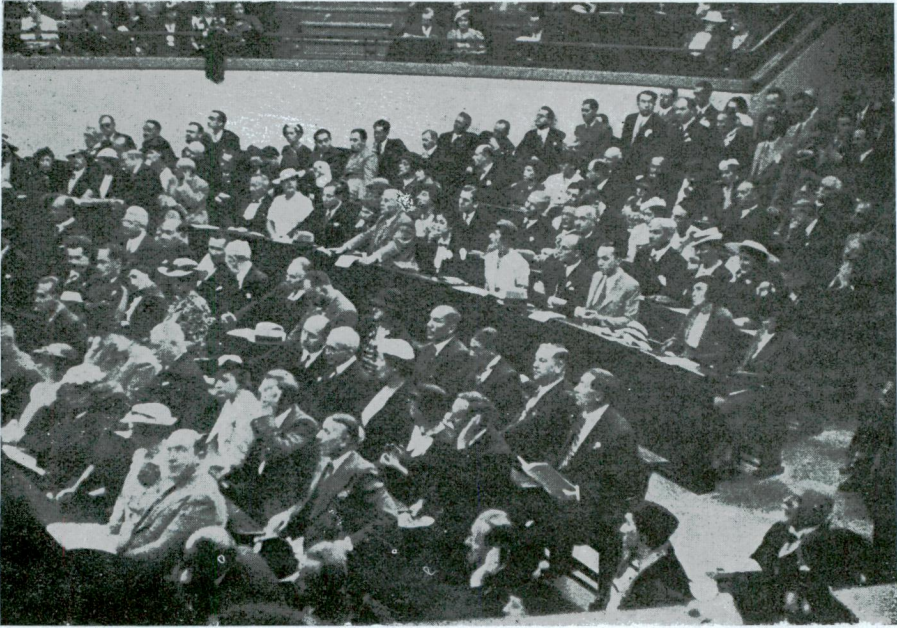
Bükreş kongresine ait iki intiba