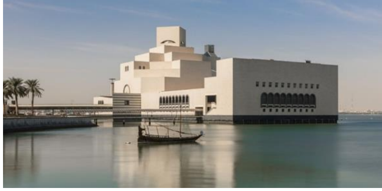
Fig. 4. İslam Sanatları Müzesi-Doha

Doha’da Eğitim Şehri olarak oluşturulan bölgede çok sayıda yabancı üniversite kampüs açarak eğitim vermiştir. Bu noktada temel amaç mesleklerde uzmanlaşmanın sağlanmasıdır. Doha’da açılan üniversitelerin sanat ile ilgili bölümleri de etkin olmuştur. Bu bölümlerde sanatta uzman kişilerin yetişmesini sağlamıştır. University College London’un “Müze Araştırmaları” adı altında Doha’da açmış olduğu bir bölüm bu açıdan sanata bakışın önemini göstermektedir (Ahmed 2019, 50).