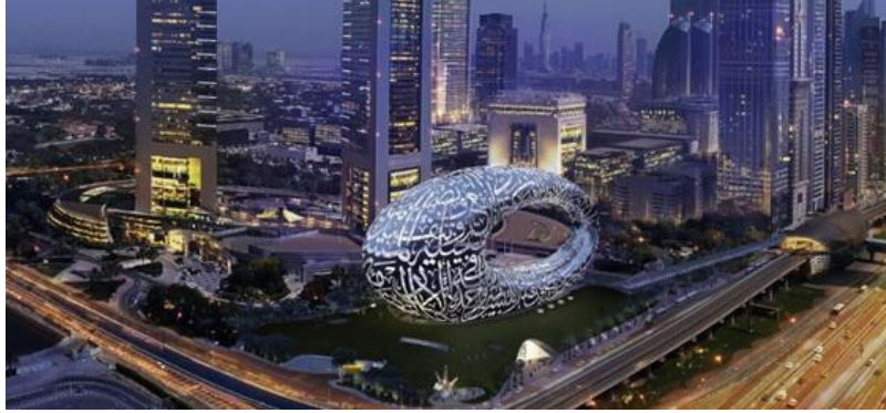
Fig. 5. Museum of Future-Dubai

Bu postmodern kültürün toplumu merkezileştirmesiyle de ilgili olmuştur. Postmodern kültür sosyoekonomik olarak zaman ve mekânı yapıbozuma uğratarak kendisine yeni bir gerçeklik yaratmıştır (Curtis 2011, 1943-1944). Dubai bu açıdan mekânı dönüştürebilmiş ve kendine yeni bir kent imgesi yaratabilmiştir. Bu olgu ayrıca yeni bir kimlik inşasına sebep oluşturmuştur. Küresel Güney'in evrensel mekanlarının sahibi bir sanat merkezi olarak Dubai küresel ve çok kültürlü bir moda merkezine dönüşmüştür. Bu bir merkez olarak Dubai'nin İslam, postkolonyalizm, göç ve yerinden edilme gibi kavramları da dönüştürmesine ve kendi içinde eritebilmesine olanak sağlamıştır (Moghadam 2021, 11).